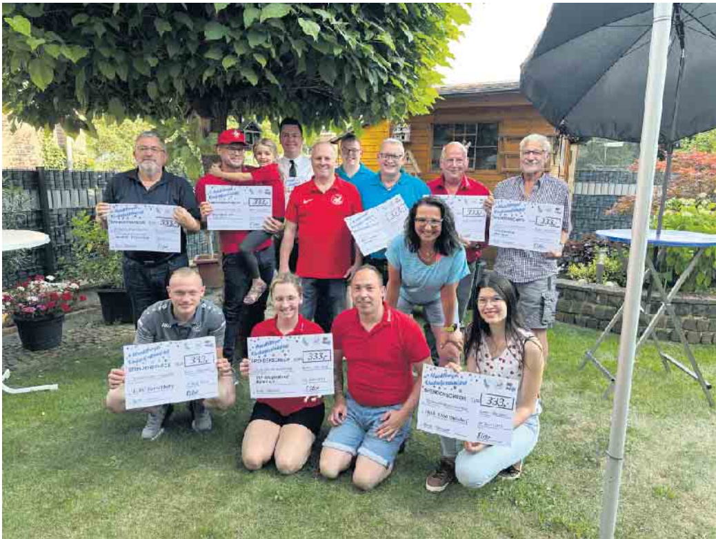
Spendenübergabe an Duisdorfer Vereine

West, die Freiwillige Feuerwehr Bonn-Duisdorf, den Spielmannszug Rot-Weiß Duisdorf, den Musikverein Duisdorf, die Jugendabteilung des TKSv Duisdorf, die Jugendabteilung des 1. FC Hardtberg, den TSV Legends of Dance, das Cadettencorps der Ehrengarde und die KG Lessenicher Sterne. Die Veranstalter bedankten sich bei allen ehrenamtlichen Helferinnen und Helfern, die zum Er-