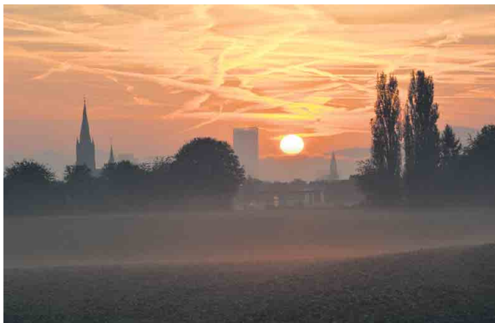
Geheimnisvoll im Herbst: Nebel und Sonnenaufgang im Meßdorfer Feld