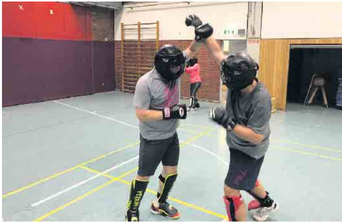
Der Krav Maga Selbstverteidigungskurs ist für alle ab 15 Jahren geeignet

Die Teilnahme ist für Erwachsene und Jugendliche jeden Geschlechts ab 15 Jahren geeignet (unter 15 Jahren nur nach Absprache oder in Begleitung eines Elternteils). Die Teilnahme ist ohne Vorkenntnisse möglich, setzt aber eine Grundkondition voraus. Für Sparring wird eine Schutzausrüstung benötigt. Kursbeginn Fr, 11. August, 20 bis 22 Uhr, Kettelerschule, Dransdorf. Die Kursgebühr beträgt 70 Euro für Mitglieder, 105 Euro für Nichtmitglieder. Weitere Informationen und Anmeldung auf der TGV-Hompage. ( https://www.tgv-bonn.de/kurse ).