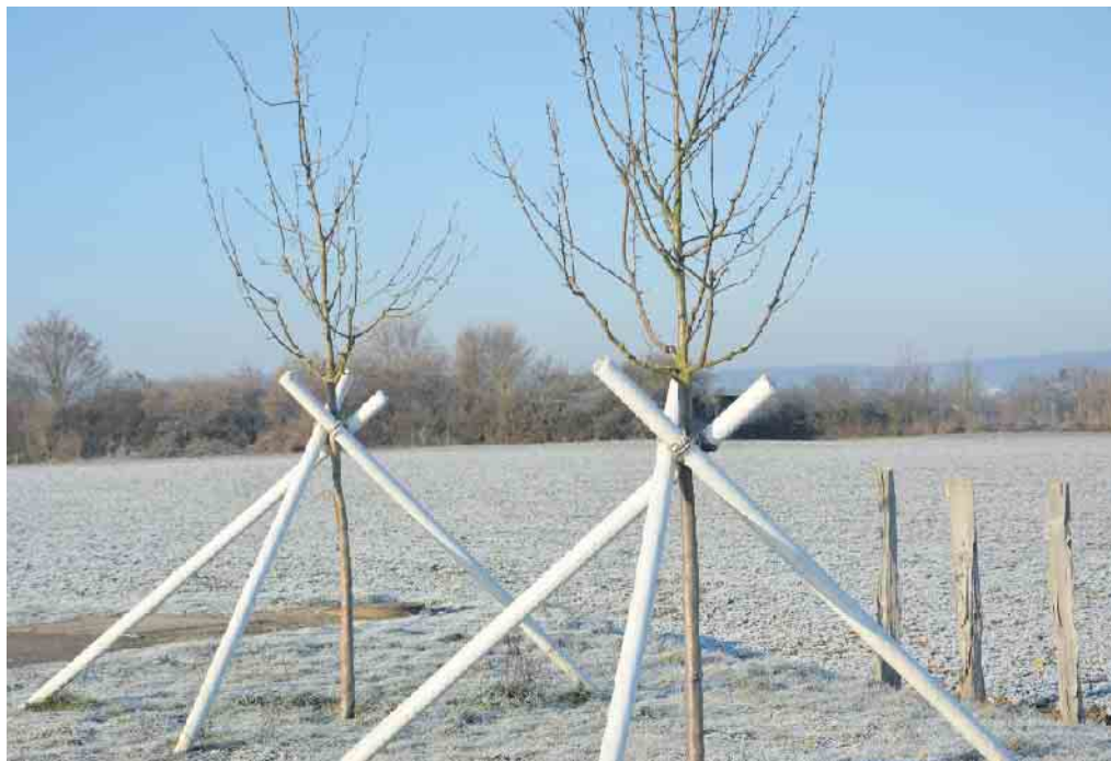
Zu jeder Jahreszeit reizvoll: Meßdorfer Feld im Schnee.

Das Feld war ursprünglich größer. 2009 wurde der erste Bauabschnitt des Geländes Am Bruch realisiert, der zweite, der bis an den Sportplatz von Rot-Weiß Lessenich heranreichen sollte, wurde bislang nicht umgesetzt. Es gab Gutachten für die Nutzung zweier Flächen entlang des Hermann-Wandersleb-Ringes, die Bonner Universität will auf einer kleinen Randfläche ihren Campus erweitern und für die alte Stadtgärtnerei ist ebenfalls eine Bebauung vorgesehen. Am 6. August von 12 bis 18 Uhr wird es wieder einen Infotag der Bürgerinitiative für die Erhaltung des Meßdorfer Feldes geben, mit vielen Attraktionen und Informationen rund um das Meßdorfer Feld. Interessierte sind herzlich eingeladen. Die Bürgerinitiative macht sich seit Jahren dafür stark, dass das Feld als grüne Lunge für Bonn und als Naherholungsgebiet in seiner heutigen Größenordnung auch für künftige Generationen erhalten bleibt. CSH