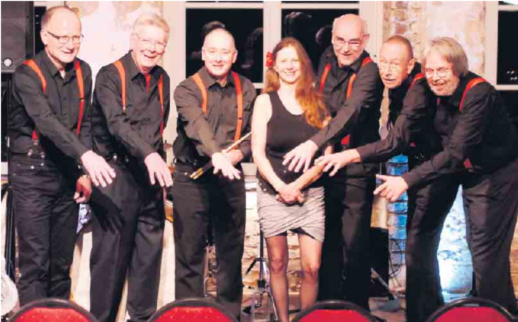
Präsentieren klassischen New Orleans-Jazz: Red Onion Hot Jazz