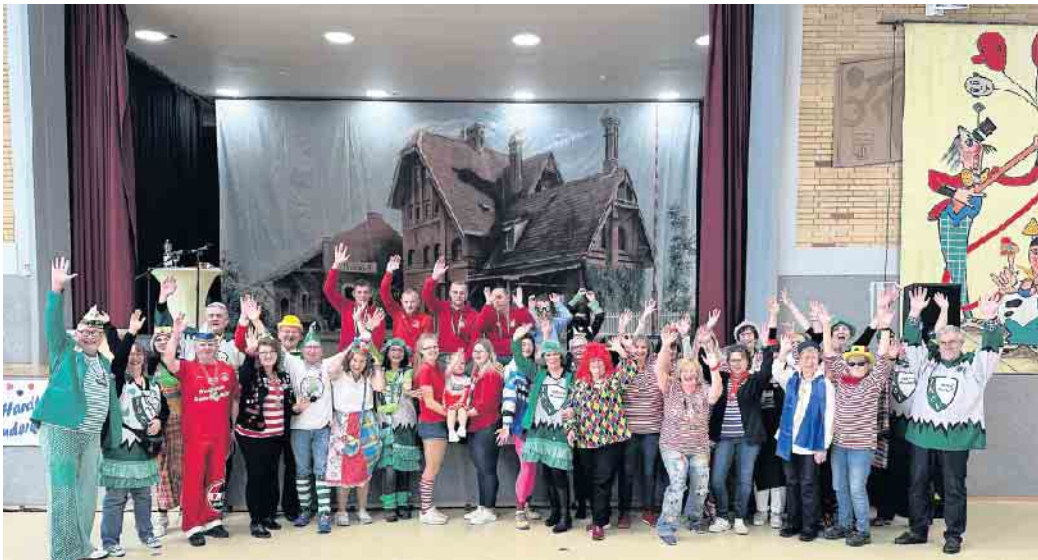
Stellen immer ein tolles Programm auf die Beine: Helferteam des Kinderkostümfestes