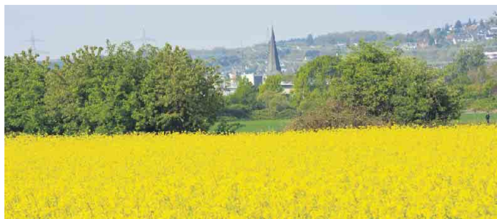
Leuchtendes Blütenmeer: im Frühling: Rapsblüte im Meßdorfer Feld