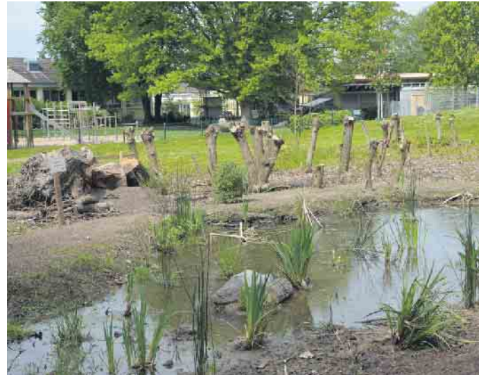
Sorgt für Artenvielfalt im Stadtbezirk: das neue Feuchtbiotop im Kreuzbergpark.