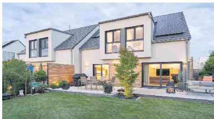
Doppelhaus in Fertigbauweise - das geht achsensymmetrisch oder auch grundverschieden.