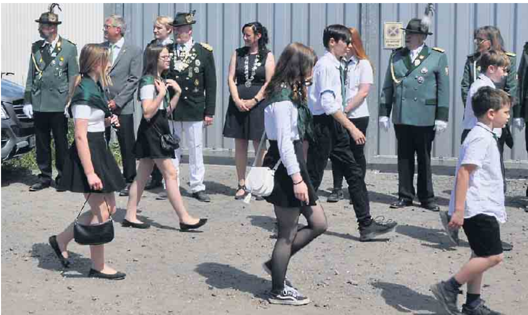
Sehr erfreulich war die Zahl der Nachwuchsschützen, die am Bezirksschützenfest teilnahmen. Im Bild Jugendliche von der Älfterer Bruderschaft

Aber alles ging gut und der Besuch mit rund 300 Schützen und Gästen war mehr als zufriedenstellend, wozu das herrliche Wetter sicherlich auch beitrug.