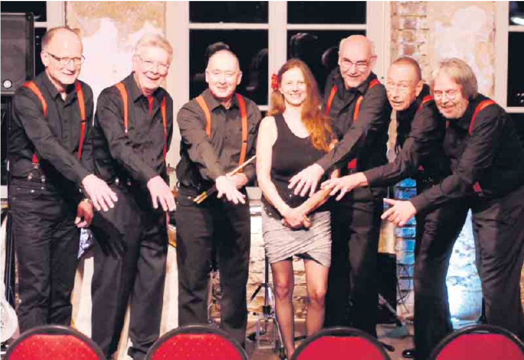
Klassischer New Orleans-Stil: Red Onion Hot Jazzband