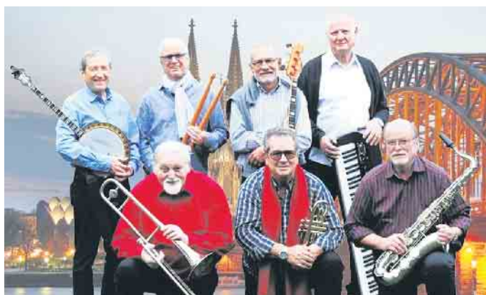
Britischer Jazz der 60er: Dom Town Seven

Das Kulturzentrum Hardtberg ist gut mit öffentlichen Verkehrsmitteln erreichen. Parkmöglichkeiten gibt es direkt am Kulturzentrum, in der Derlestraße und auf den Parkplätzen „Auf der Urdel“ und „Am Burgweiher/Burgacker“ (gegenüber der Feuerwache). Darüber hinaus gibt es zusätzliche Parkmöglichkeiten neben dem Alten Friedhof in der Rochusstraße, im Maarweg oder an der Mehrzweckhalle in der Schmittstraße. CSH