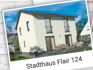
Stadthaus Flair 124