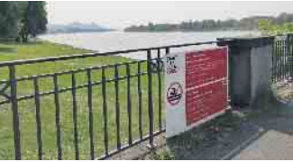
Warnschilder am Rhein weisen in Deutsch und Englisch auf die Gefahren von Baden im Rhein hin.