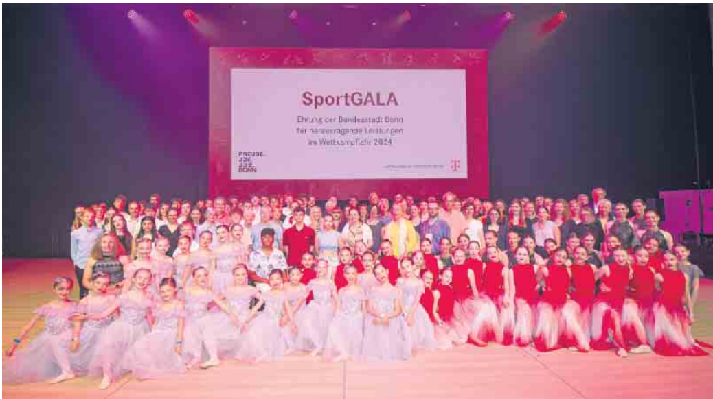
Bei der Sportgala ehrt die Stadt viele Bonner Sportler*innen für ihre Erfolge im Jahr 2024.

Oberbürgermeisterin Katja Dörner hat im Telekom-Forum in Beuel am Freitagabend, 13. Juni, rund 260 Bonner Sportler*innen für ihre herausragenden Erfolge im Jahr 2024 ausgezeichnet. Die feierliche Gala, die das Sport- und Bäderamt der Stadt Bonn in Kooperation mit der Deutschen Telekom nun zum dritten Mal ausrichtete, setzt erneut ein starkes Zeichen für die lebendige und vielseitige Bonner Sportlandschaft. Insgesamt 259 Aktive aus Spitzen-, Nachwuchs- und Seniorensport waren eingeladen, viele von ihnen nahmen ihre Urkunden persönlich entgegen. Ihre Erfolge reichen von regionalen Titeln bis zu internationalen Podestplätzen in mehr als 30 Sportarten, darunter Badminton, Kanu, Kunstradfahren, Taekwondo, Leichtathletik, Schwimmen oder Schach. Einige Sportler*innen konnten nicht anwesend sein, da sie bereits wieder bei Wettkämpfen oder in der Vorbereitung standen. Oberbürgermeisterin Dörner würdigte in ihrer Ansprache nicht nur die Leistungen der Sportler*innen, sondern auch das Engagement im Hintergrund: „Mein Dank gilt ausdrücklich auch den Trainer*innen, Vereinsvorständen und Engagierten, die mit viel Einsatz die Basis für sportliche Erfolge legen. Unsere Vereine sind Orte des sozialen Miteinanders, der