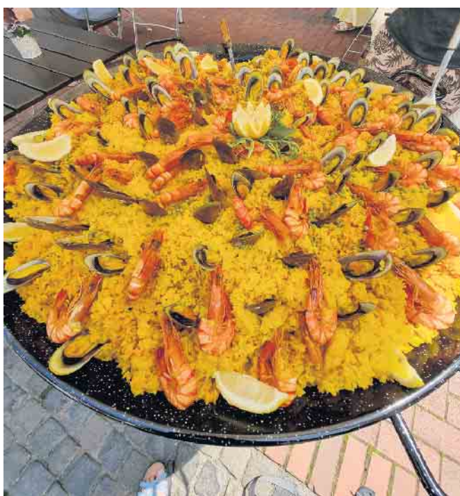
Leckere Paella vom Restaurant LA ESTRELLA auf der Rochusstraße