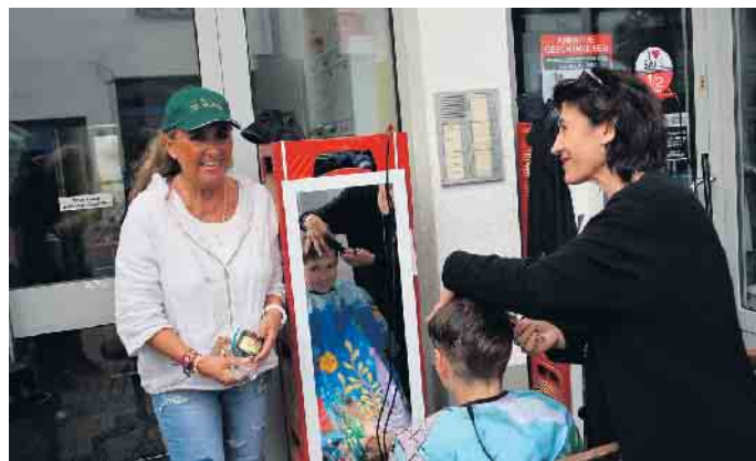
Haarschneiden für den guten Zweck bei Anjas Teestübchen

Duisdorf. Sie hat eine lange Tradition, die Duisdorfer Gewerbeschau: Zum 37. Mal fand sie in diesem Jahr statt, und zum 3. Mal in Kombination mit dem Stadtbezirksfest. In den letzten Jahren war das ehemalige Flaggship Gewerbeschau etwas ins Trudeln geraten: Mal machte die Pandemie ihr einen Strich durch die Rechnung, im letzten Jahr wurde sie wegen Turbulenzen im Vorstand der WGH und mangelndem Teilnehmerinteresse kurzfristig abgesagt. Aber in diesem Jahr startete sie wieder durch und das mit Vollgas: