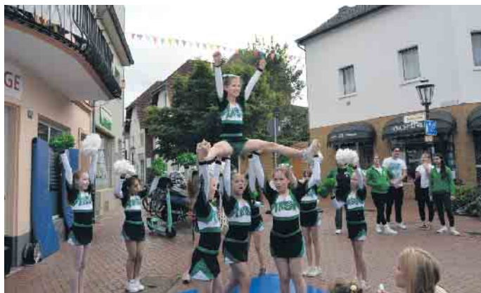
Akrobatisch: die Cheerleader des TKSv bei der Gewerbeschau.

Stadtbezirksfest und Gewerbeschau in Duisdorf.