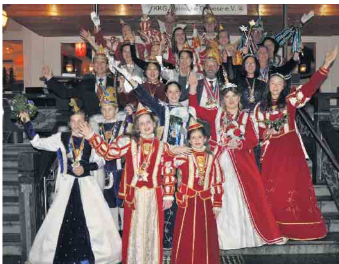
Beim großen Tollitäten-Empfang geben sich große und kleine närrische Herrscher im „Kaiser Garden“ die Klinke in die Hand.