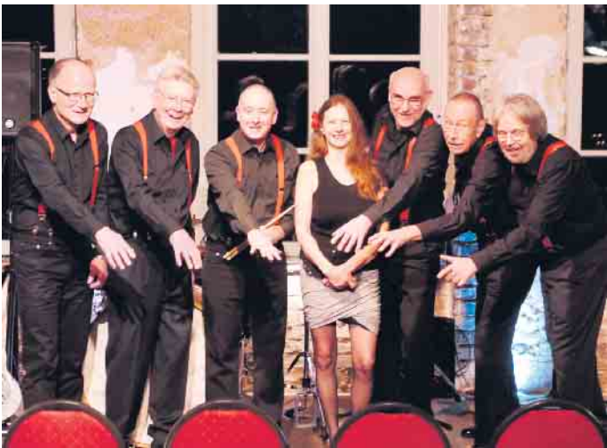
Jazz in traditioneller Besetzung: Red Onion zu Gast im Kulturzentrum

Banjo, Gitarre, Kontrabass und Piano. Es ist die Musik, die sich mit Jazz-Legenden wie Clarence Williams, Jo „King“ Oliver, Duke Ellington, Jolly Roll Morton und natürlich auch Louis Armstrong sowie den Red Onion Jazz Babies verbindet. Von der zuletzt genannten Band hat die „Red Onion Hot Jazz“ ihren Namen. Beide Konzerte beginnen um 11 Uhr, Einlass ist ab 10.30 Uhr. Der Eintritt ist - wie immer - frei. Um Spenden wird gebeten. Das Kulturzentrum Hardtberg ist erreichbar mit ÖPNV, RB 23, Buslinien 88, 845 bis Duisdorf Bahnhof, Buslinien 605, 606 bis Haltestelle Duisdorf Schickshof. Parkplätze befinden sich am Kulturzentrum, in der Derlestraße und „Auf der Urdel“. CSH