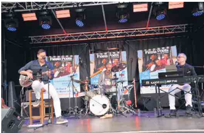
Gute-Laune-Musik bei der Gewerbeschau von Fiesta Poets