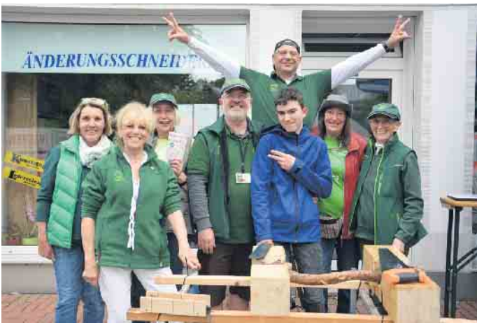
Erst sägen, dann Geschenk: die Waldfreunde Duisdorf bei der Gewerbeschau

Chateaufstr. 1-5 • 53347 Alfter-Oedekoven Tel.: 0228 - 928 926 44 • www.aktivo-alfter.de