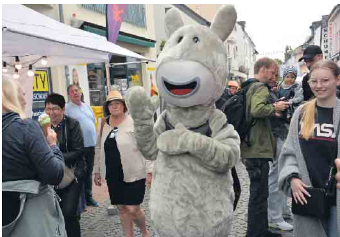
Das Duisdorfer Maskottchen war natürlich auch dabei.