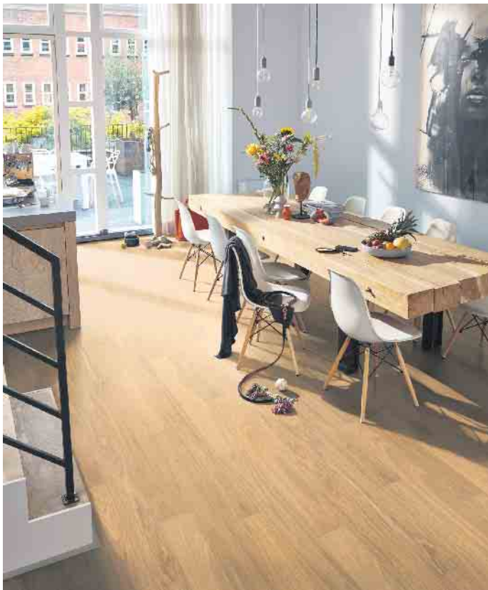
Formschön, nachhaltig und gesund - für Parkett spricht vieles.

sitzer kontinuierlich weitere Bäume gegen den Klimawandel pflanzen.