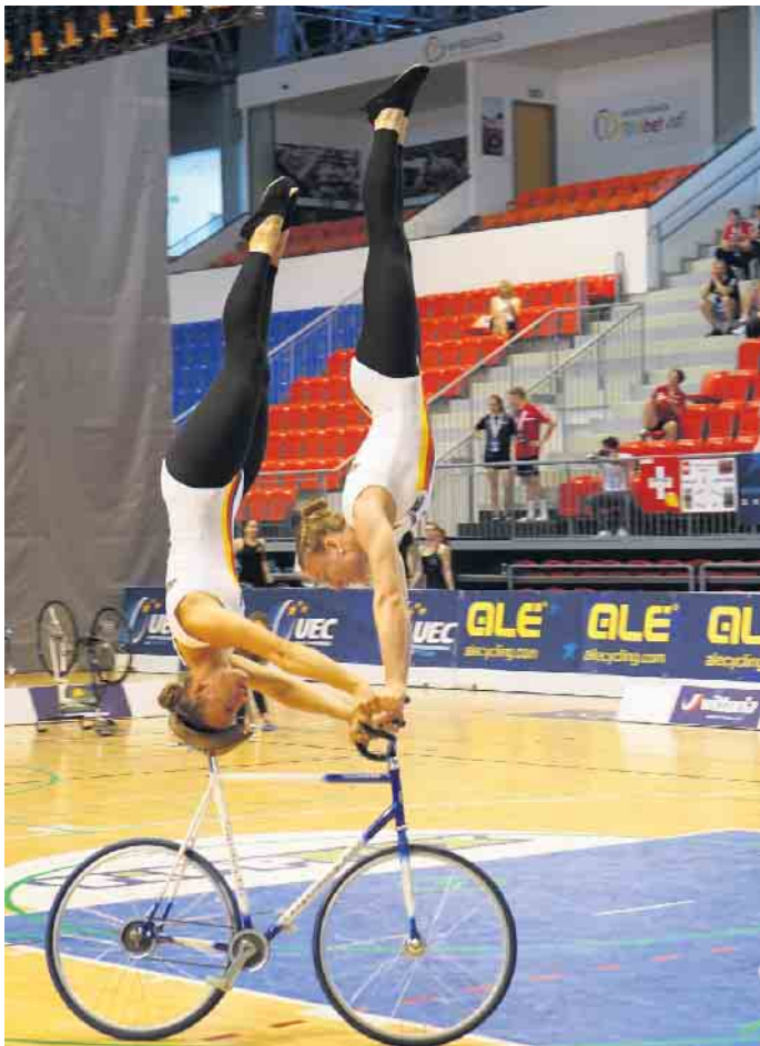
Meisterhaft ausgeführt: Kopf-Handstand