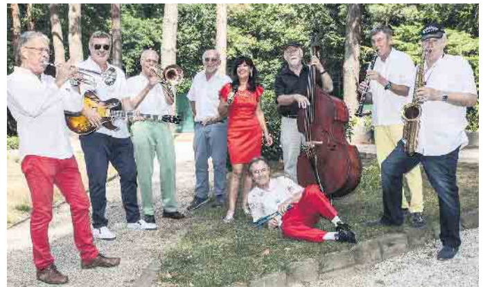
Dixie, Swing und Rock-Jazz mit der Hot Jazz GmbH