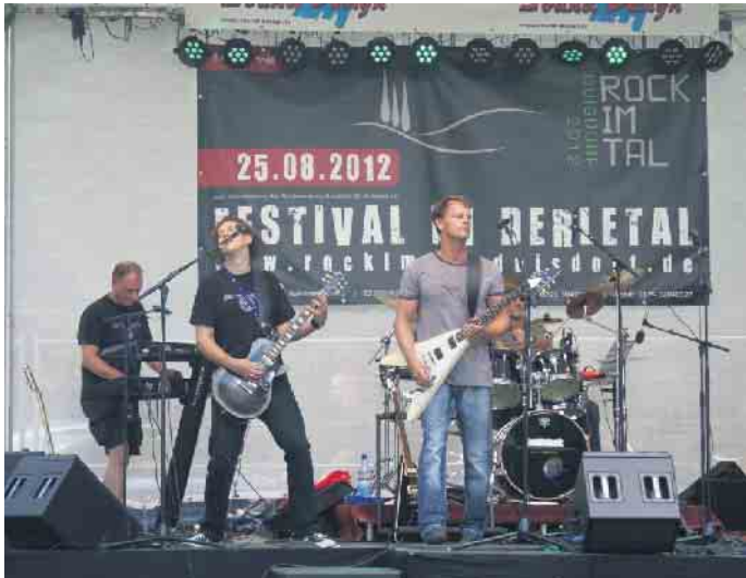
So fing es an: erstes „Rock im Tal“ 2012

Duisdorf. Beides sind große Veranstaltungen mit unterschiedlich langer Tradition: das Derletalfest ist seit vielen Jahren eine beliebte Veranstaltung für die ganze Familie. 35 mal fand es bisher statt. Deutlich jünger, aber auch längst eine Erfolgsgeschichte ist „Rock im Tal“, die Veranstaltung für ein jüngeres und jung gebliebenes Publikum. Insbesondere für das Derletalfest wurde nach einer Möglichkeit gesucht, es für Jugendliche und Erwachsene attraktiver zu machen.