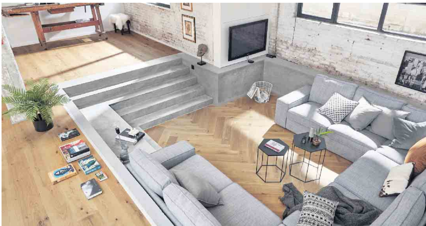
Ein Parkettboden ist auch 2022 moderner denn je.