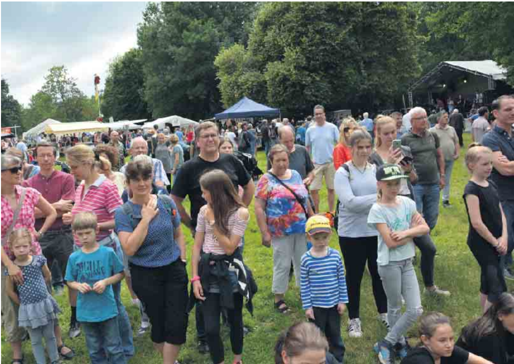
Seit vielen Jahren ein Fest für die ganze Familie im Derletal

Und so kam es im Jahr 2019 zu einer Zusammenlegung der beiden weit über die Grenzen des Stadtbezirks hinaus beliebten Veranstaltungen.