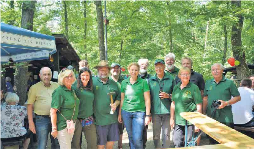
Aktive Truppe: die Duisdorfer Waldfreunde