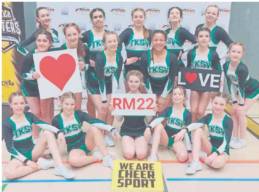
Erfolgreich bei den Pokalmeisterschaften: die „Heroes“ des TKSv

Duisdorf. Am 11. und 12. Juni fand die Deutsche Pokalmeisterschaft des Cheerleading und Cheerdance Verbandes Deutschland e.V. in der Sachsenarena in Riesa statt. Dafür konnten sich die „Heroes“ des TKSv, die alle im Alter von 11 bis 16 Jahren sind, qualifizieren. Mit schönem Erfolg: der TKSv freut sich darüber, dass die Gruppe hochmotivierter Sportlerinnen, den siebten Platz von insgesamt 16 Mannschaften erreichen konnte. Die Mühen des Training hatte sich damit mehr als gelohnt. Vorstand, Mitglieder und Freunde des TKSv gratulieren recht herzlich zu diesem Erfolg. CSH