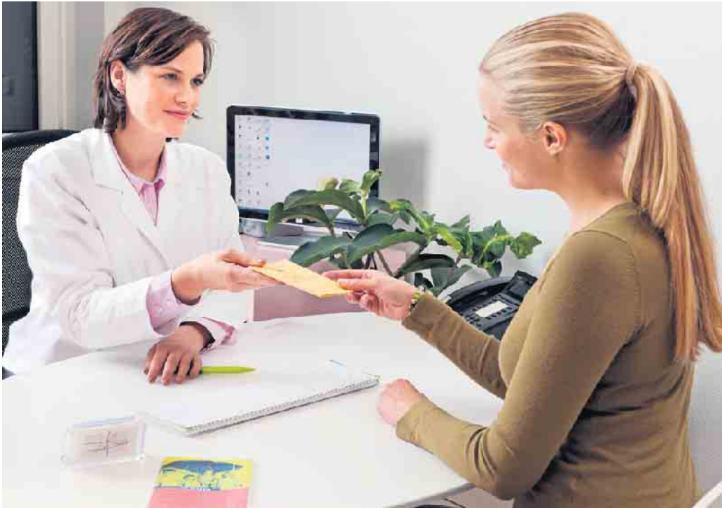
Beratung, Screening und Impfung zu Hepatitis B und /oder C sind bei Hausarzt möglich.