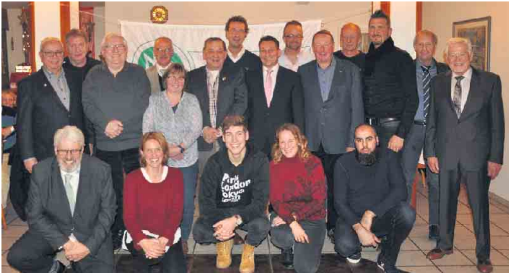
Wie hier im Jahre 2019 herrscht bei den ausgezeichneten Ehrenamtlern im Fußballkreis Bonn Jahr für Jahr große Freude.