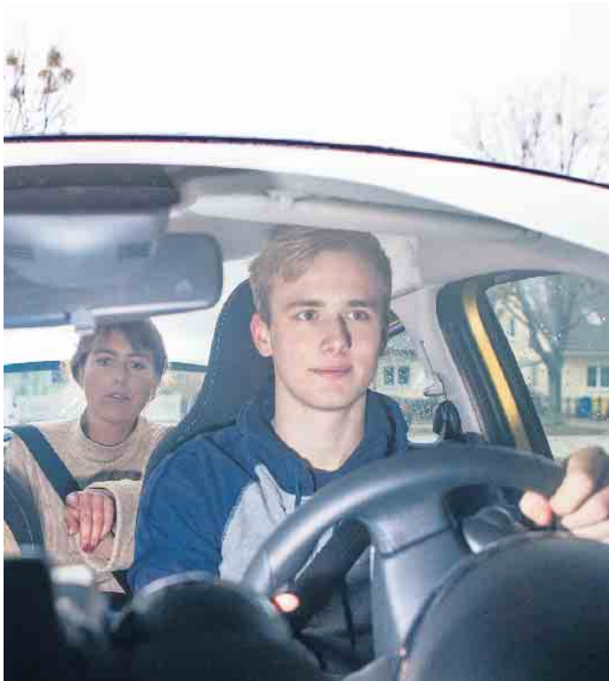
Studien belegen: Jugendliche, die am BF17 teilgenommen haben, fahren sicherer. Sie sind im ersten Jahr des selbstständigen Fahrens rund 20 Prozent seltener an Unfällen beteiligt als Gleichaltrige, die nach der Fahrschule direkt auf sich gestellt sind.

Nach der Fahrschulzeit sammeln BF17 Fahranfängerinnen und Fahranfänger bis zu einem Jahr lang in Anwesenheit ihrer Begleitpersonen Erfahrungen im Straßenverkehr. Studien belegen, dass Teenager, die am Programm teilgenommen haben, im ersten Jahr des Fahrens ohne Begleitung rund 20 Prozent seltener an Unfällen beteiligt sind als Gleichaltrige, die unmittelbar nach der Fahrschule auf sich allein gestellt waren. Auch mit Blick auf die Kfz Versicherungsbeiträge wirkt sich das Begleitete Fahren ab 17 häufig positiv aus, wenn später ein eigenes Auto versichert oder das Fahrzeug der Eltern weiter mitbenutzt werden soll. Viele Versicherungen unterscheiden sich darin, ob bei der Nutzung für das Begleitete Fahren ab 17 die Beiträge gleichbleiben oder sich erhöhen. Ist BF17 in der Familie geplant, kann eine frühzeitige Nachfrage bei der eigenen Kfz-Versicherung sinnvoll sein. (djd)