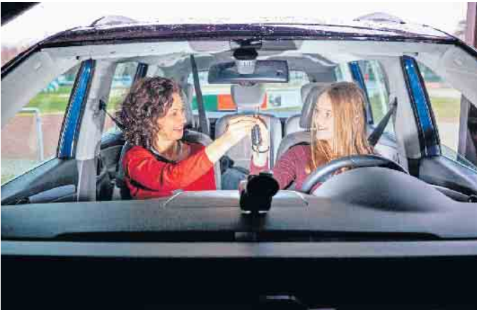
Beim BF17 sammeln Fahranfängerinnen und -anfänger begleitet und unterstützt hilfreiche Erfahrungen im Straßenverkehr.

Das Begleitete Fahren ab 17 lohnt sich für Jugendliche