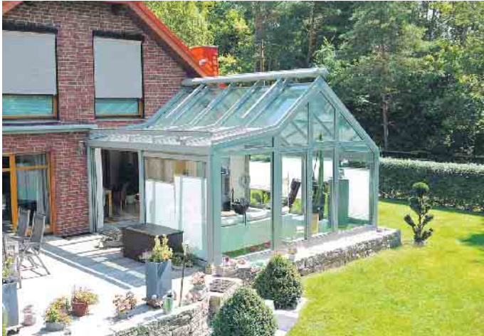
Ein Wintergarten verbindet Haus und Garten und sorgt für mehr Tageslicht im Haus.

Warum handwerkliche Kompetenz bei der Wintergartenplanung besonders wichtig ist