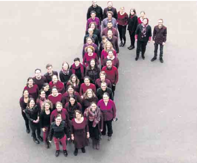
Vibrierender Chor: die POLYPHONIKER zu Gast im Kulturzentrum

Polyphoniker und Allegro Orchester beim Duisdorfer Jazzsommer