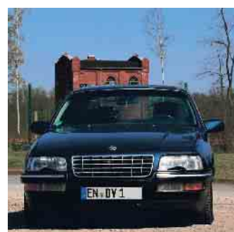
Autokennzeichen müssen von Gesetzes wegen gut lesbar sein.