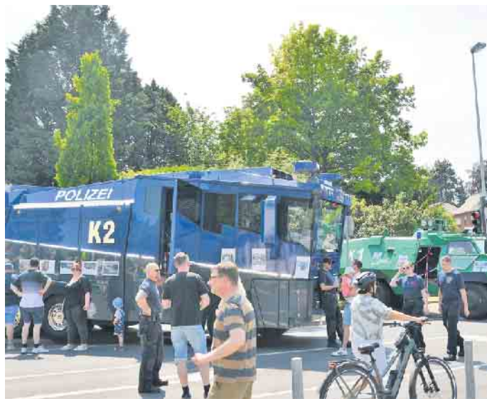
Ungewöhnlicher Anblick: Panzerwagen und Wasserwerfer auf der Villemombler Straße

Bleibt zu hoffen, dass bis zum nächsten Sommerfest der Duisdorfer Polizei nicht wieder 29 Jahre vergehen. CSH