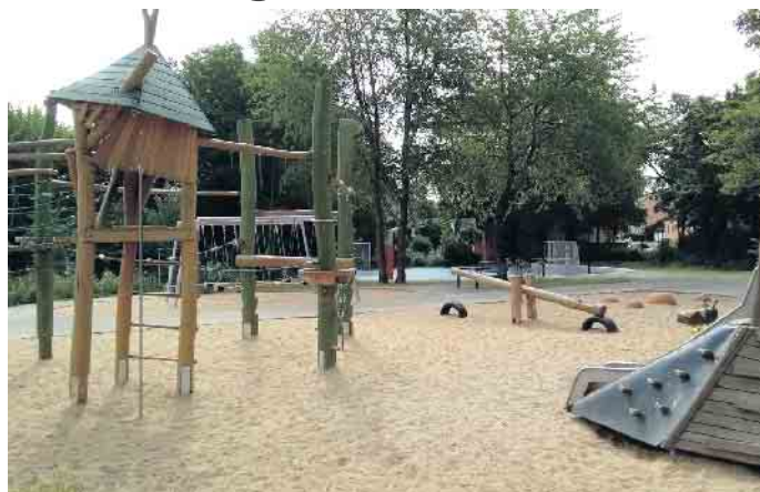
Der neu gestaltete Spielplatz „Auf dem Hügel“ ist für Kinder wie auch Jugendliche attraktiv.

Für jedes Kind sollen mindestens 6 m 2 zur Verfügung stehen und attraktiv ausgestattet sein. Bei Kindern stehen Rutschen, Schaukeln, Kombi-Klettergeräte hoch im Kurs. Jugendliche haben mehr Interesse an Ballspielen oder Bike Parcours. „Wichtig für Jugendliche sind aber vor allem auch Treffpunkte, wo sie ungestört zusammen sein können“, weiß Max Biniek aus seiner beruflichen Erfahrung als Sozialarbeiter. Für Kinder mit Einschränkungen sollen Spielplätze künftig nach einem Um- oder Neubau gut zugänglich sein und über mindestens zwei barrierefreie Spielangebote verfügen.