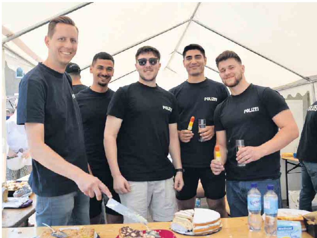
Gestandene Polizisten können auch Kuchenbüffett.

Großes Familienfest rund um die Wache Duisdorf