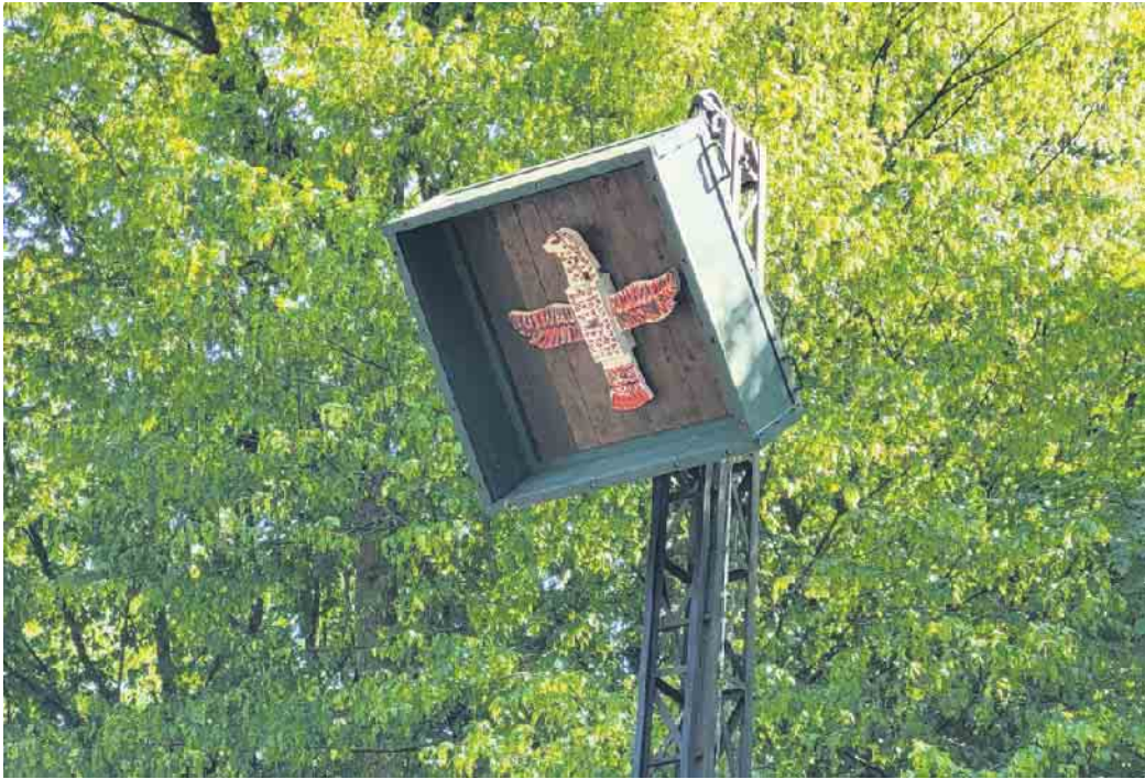
Vogel im Hochstand

Die Veranstaltung ist im Schützenhaus, oben im Derletal (53125 Bonn, In der Dehlen 50). Der erste Tag ist den Vereinsmitgliedern vorbehalten. An diesem Tag wird der neue Schützenkönig ermittelt. Geschossen wird mit der „Donnerbüchse“ auf den Vogel im Hochstand. Der neue Schützenkönig repräsentiert den Verein dann ein ganzes Jahr lang nach außen. Der zweite Tag des Schützenfestes beginnt um 11 Uhr und ist für die Öffentlichkeit bestimmt. An diesem Tag ermitteln die befreundeten Vereine einen Vereinssieger und die Bürgerinnen und Bürger ermitteln den sogenannten Bürgerkönig. Neben dem Schießen