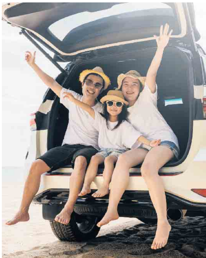
Mobil auch im Urlaub: Schon mit der Miete für eine Reise kann sich die Flatrate lohnen.