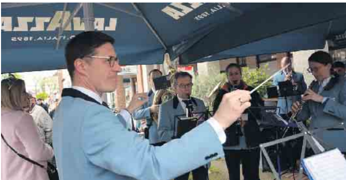
Ein Ständchen des Musikvereins zur Eröffnung.