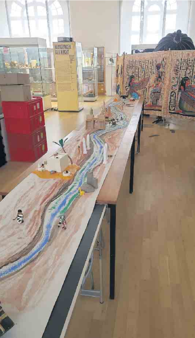
Der Nil von Assuan bis Kairo im Modell

Auch im Mai finden Workshops im Ägyptischen Museum statt