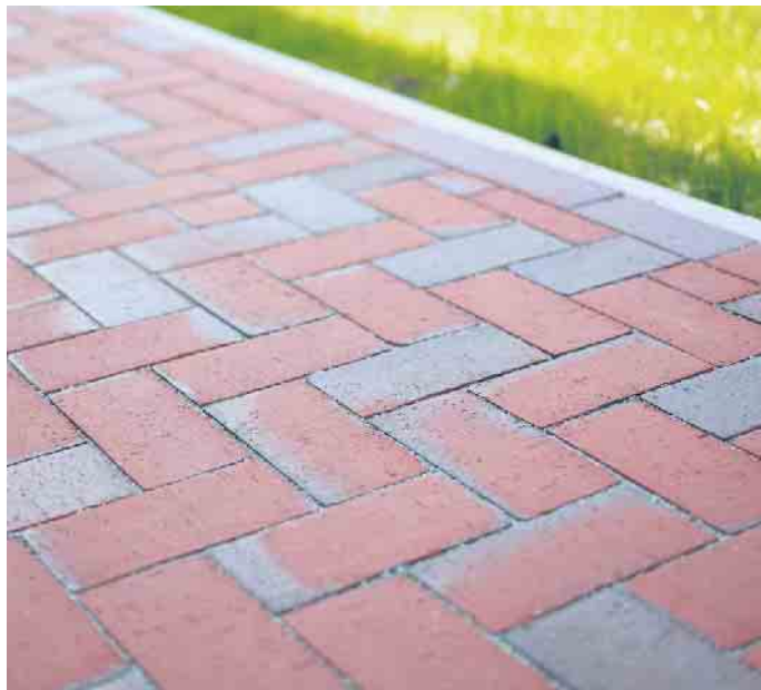
Pflasterklinker bieten mit ihrer Vielzahl an Farben, Formen, Formaten und Verlegemustern großen Gestaltungsspielraum.