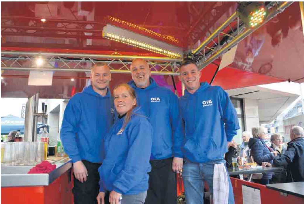
Hatten alle Hände voll zu tun: die Crew des Bierstandes.

Für den Spaß sorgten etliche Fahr- geschäfte wie Autoscooter, Kin- derkarussell, Hawaiiswing und Scheibenwischer. Für jeden Besu- cher und jeden Geschmack war etwas dabei. Es ging aber auch gemächlicher. Beim Entenageln waren z. B. Geschicklichkeit und eine ruhige Hand gefragt. Der Bier- stand - betrieben vom Ortsfest- ausschuss - war Treffpunkt für die Erwachsenen. Sechs Tage lang - von Freitag bis Dienstag - war Zeit für Groß und Klein, sich hier zu treffen, miteinander zu klönen und Spaß zu haben. Diese Zeit nutz- ten alle gern und reichlich. Die traditionelle Duisdorfer Mai- kirmes ist ein beliebter Treffpunkt für die großen und kleinen Duis- dorfer und ihre Gäste. Entstan- den ist sie aus dem früheren Kirch- weihfest. Daher war es auch frü- her Brauch, die Häuser für das Fest schön herzurichten und Freun- de und Verwandte einzuladen. Inzwischen ist sie zu einem ein- genständigen Volksfest gewor- den. Schon seit langem ist die Duisdorfer Kirmes ein fester Be- standteil im Veranstaltungskalen- der des Stadtbezirks Hardtberg. Als eine der ersten Kirmesveran- staltungen im Jahr trifft man sich hier in familiärer Runde zum ge- mütlichen Beisammensein. Der Duft von gebrannten Mandeln