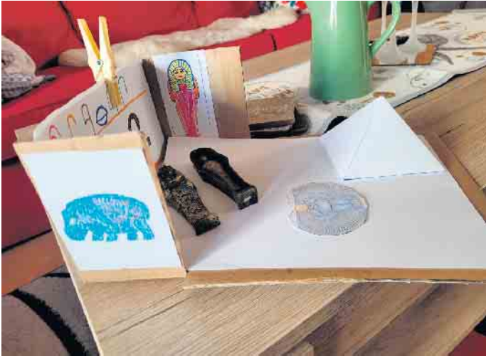
So kann ein Diorama (Schaukasten) selbst gebastelt aussehen.

Noch findet man das Ägyptische Museum an alter Stelle am Regina-Pacis-Weg 7 in Bonn. Doch immer mehr Objekte verschwinden in Kisten oder werden vorbereitet für den Abtransport durch eine Spezialfirma in das neue Domizil. Die Restauratoren und viele weitere Helfer aus dem Museum, inklusive des Kurators, arbeiten nun auf Hochtouren. Ganz neu ist in diesem Zusammenhang ein Termin, der seit kurzem gehandelt wird. Am 18. Oktober soll das neue Haus in der Poststraße eröffnet werden. Mit eine Sonderausstellung zum Thema „Objektgeschichten“ wird wohl gestartet. Bis dahin verkürzen wir vom Förderverein die Zeit und bieten auch im Mai noch ein paar Workshops an. Weitere Informationen zu den Workshops findet man unter Museumziehtum@web.de