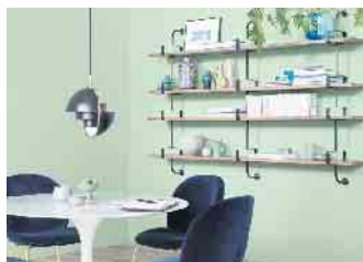
Mehr Mut zur Farbe: Das kreative Kombinieren von Wandfarben, Bödenbelägen und Möbeln verleiht dem eigenen Zuhause mehr Ambiente.

Wer hingegen kräftige Farbakzente setzen will, ist mit den „fruchtigen“ Tönen Amarena, Mango oder dem satten, beruhigenden Blau von Blueberry in der passenden Einrichtungswelt unterwegs. Die 32 Trendfarben aus der Kollektion von Schöner Wohnen-Farbe ermöglichen das Einrichten im eigenen Stil. Für ein unkompliziertes Verarbeiten und Verschönern sind die Dispersionsfarben fertig gemischt in unterschiedlichen Gebindegrößen im Fachhandel sowie in vielen Baumärkten erhältlich. Unter www.schoener-wohnen-farbe.com