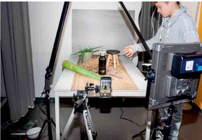
Im hauseigenen Fotostudio wurde eifrig dekoriert.

Bei leckerer Pizza ging ein aufregender und abwechslungsreicher Tag zu Ende.