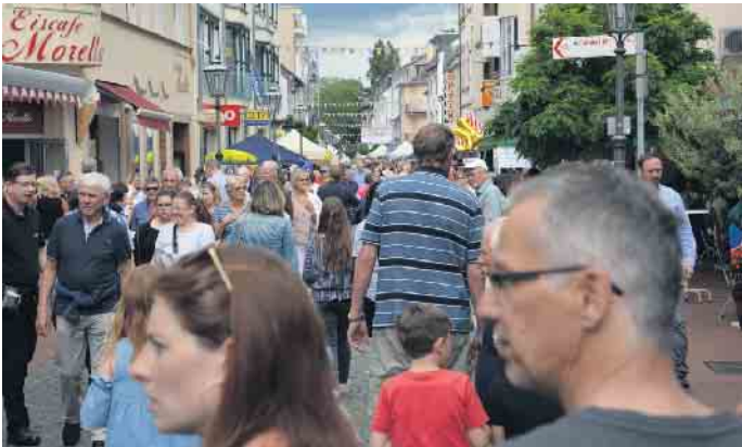
Auf volle Straßen und viele Besucher hoffen die Organisatoren des Stadtbezirksfest.

Duisdorf. Am 1. Juniwochenende ist es wieder soweit: dann startet erneut die traditionelle Duisdorfer Gewerbeschau in Verbindung mit dem Stadtbezirksfest. Die Kombination aus Stadtbezirksfest mit begleitender Gewerbeschau hat sich bewährt und wird in alter Tradition und Form erneut aufgelegt. Ein umfangreiches Unterhaltungsangebot steht im Vordergrund der zwei Tage. Mit dabei ist wieder der Hardtberg-