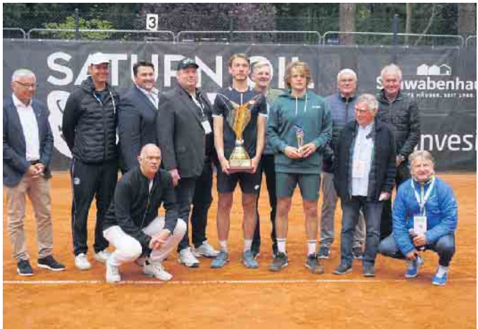
Veranstalter, Organisatoren, Publikum und Tennis-Profis freuen sich auf die 2. Auflage der Saturn Oil Open.

Ort: TC RW Troisdorf e.V., Carl Diem Str. 2, 50840 Troisdorf, www.tcrwt.de Parkplatz: Stadthallen Parkhaus Troisdorf (An der Stadthalle) Format: ATP Challenger Tour (Herren), ITF World Tennis Tour (Damen) Gesamtpreisgeld: 100.000 US Dollar Titelverteidiger: Lukas Klein (SVK) Veranstalter: M.A.R.A. Sport-Consulting, www.mara-sc.de Homepage: www.saturnoilopen.com