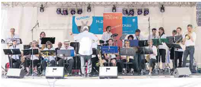
Abschluss des Hardtberger Frühlings mit dem „Allegro-Orchester“

Das Kulturzentrum ist erreichbar mit öffentlichen Verkehrsmitteln: Regionalbahn S 23 bis Bonn-Duisdorf Buslinien 800 und 845 bis Duisdorf Bahnhof Buslinien 605 und 606 bis Haltestelle Schickshof