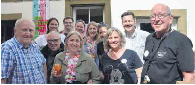
Organisieren tolle Veranstaltungen in der Burg; das Team von KUBE

Endenich. Der gemeinnützige Kultur- und Bürgerverein Endenich e.V. (KUBE) veranstaltet dieses Jahr, am 20. Mai, zum fünften Mal die Endenicher BurgArt, unter dem Motto „Erschwingliche Kunst.