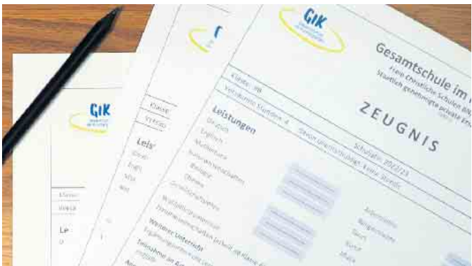
Der Abschluss des Schuljahres - die Zeugnisvergabe.

Zeugnissorgen an Gymnasium und Realschule jetzt angehen