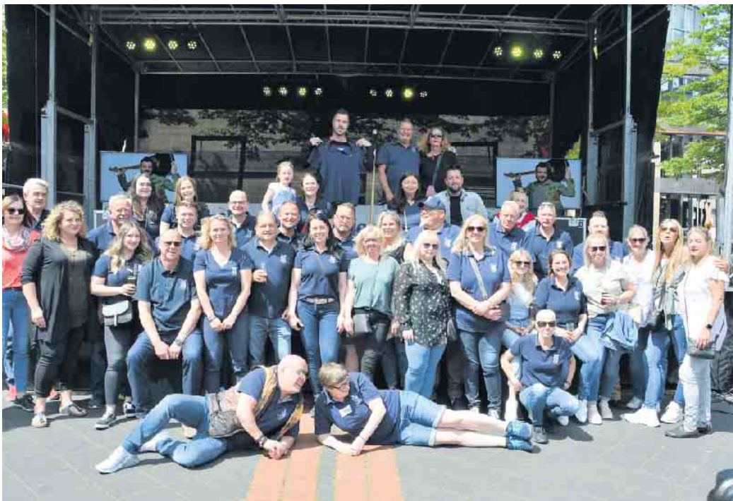
Verstehen richtig was vom Feiern: Duisdorfer Funken

Mit der perfekten Auswahl der Titel treffen die Musiker den Nerv der Zeit und freuen sich über die stimmkräftige Unterstützung ihres Publikums. CologneUnplugged aus dem Raum Köln covern bekannte Titel in ihrer eigenen besonderen „unplugged“ Version. CSH