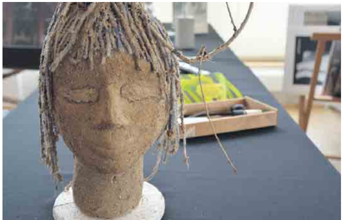
Geheimnisvoll: Kopf aus selbstgemachten Pappmachée