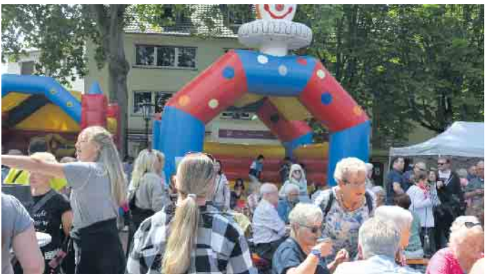
Ein Fest für die ganze Familie: Vatertag mit den Duisdorfer Funken.

Duisdorf. Auch in diesem Jahr gibt es wieder ein großes Vatertags- und Familienfest auf dem Duisdorfer Schickshof. Es findet statt am 18. Mai, Beginn ist um 12 Uhr. Organisiert wird diese Veranstaltung von den Duisdorfer Funken. Und die ist keineswegs nur für Väter, sondern für die ganze Familie gedacht. Ein bunt gemixtes Programm wird dafür sorgen, dass für jeden etwas dabei ist. So können sich die kleinen Gäste auf einer Hüpfburg austoben und sich beim Kinderschminken kunstvoll verzieren lassen. Hungrig und durstig wird keiner bleiben dank Getränkeständen, Deftigem vom Grill und einer Kuchen-Waffel-Theke für Süßschnäbel.