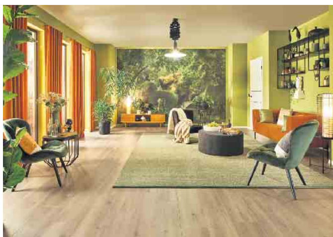
Perfekte Harmonie von Material und Farbe