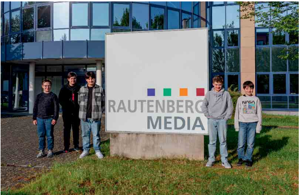
Boys' Day bei Rautenberg Media