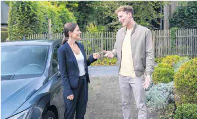
Beim Autokauf ist für mehr als Dreiviertel der Deutschen der Preis das wichtigste Kriterium.