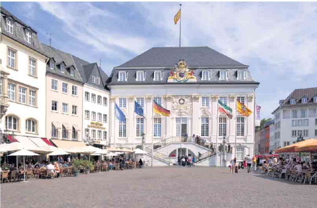
Für Sanierungsarbeiten an der Fassade des Alten Rathauses wird das Gebäude ab 2. Mai 2025 eingerüstet.

Aus diesem Grund wird das repräsentative Gebäude aus dem Jahr 1738 ab Freitag, 2. Mai, eingerüstet. Die Instandhaltungs- und Sanierungsmaßnahmen werden voraussichtlich sechs Monate dauern und sollen bis Anfang November abgeschlossen sein, wobei das Gerüst bereits Ende Juli wieder abgebaut werden soll. Zum einen werden die Fenster sowohl innen als auch außen instandgesetzt. Zum anderen wird die Freitreppe saniert, die Taubenabwehr erneuert, und die Fassade zur Marktseite erhält einen neuen Anstrich. Die Arbeiten sind notwendig, um weitere Schäden zu vermeiden. Die jüngste Sanierung des Alten Rathauses war im Jahr 2010. Sie liegt mittlerweile 15 Jahre zurück, so dass diese Instandhaltungsarbeiten