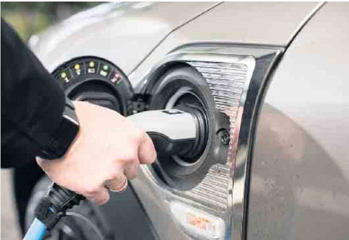
Die Lademöglichkeiten für E-Autos sind in Deutschland inzwischen gut. Laut Bundesverband der Energie- und Wasserwirtschaft gibt es mehr als 100.000 öffentliche Ladepunkte.

Auch beim Versicherungsschutz für E-Autos lässt sich sparen. Wer sein neu erworbenes Elektroauto etwa bei der DEVK versichert, zahlt 15 Prozent weniger für die Kfz-Haftpflichtversicherung - Informationen hierzu gibt es unter www.devk.de/auto . Verbraucherinnen und Verbraucher, die ein gebrauchtes Auto kaufen oder verkaufen möchten, finden hier wertvolle Tipps und können einen Mustervertrag herunterladen. Egal, für welche Antriebsart man sich entscheidet: Beim Kauf von Gebrauchtwagen heißt es: „Augen auf und nie ohne Probefahrt“. (DJD)