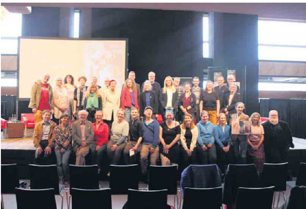
Pressekonferenz der 18. Theaternacht am 8. April im Bonner Opernhaus