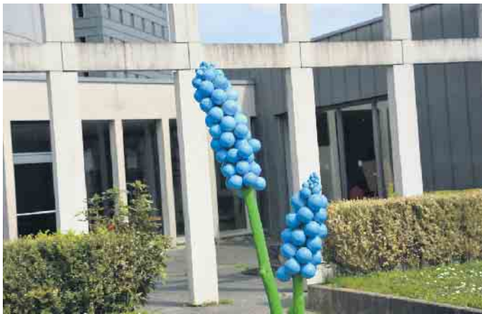
Die gibt es nur auf dem Brüser Berg: Riesenhyazinthen, nachhaltig produziert und dauerblühend.

Harfenklänge und ein wunderbarer Fliederduft. Frühling für alle Sinne! Die Stadteilkultur Brüser Berg ist eine Initiative von derzeit 17 bildenden Künstlerinnen und Künstlern. Sie besteht schon seit 1998. Die meisten Mitglieder wohnen auf dem Brüser Berg. Manche haben eine künstlerische Ausbildung. Zu den Tätigkeiten der Initiative gehören die Ausrichtung eines 3-