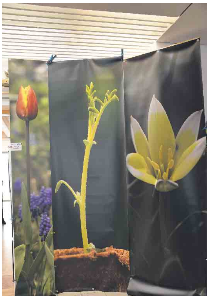
Kleine Pflanzen, mal ganz groß.

Und auch die Besucher durften kreativ werden. Ein zunächst kahler Baum sollte mit von ihnen gestalteten Blüten aus buntem Krepppapier geschmückt werden. Material und Anleitungen lagen bereit, das Angebot wurde von vielen gerne angenommen. Und so erwachte auch dieser Baum aus der Winterstarre und zeigte sich