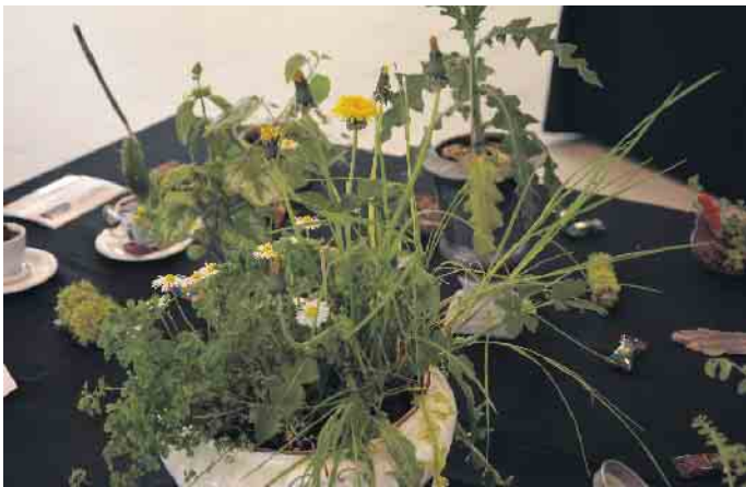
Kräuter vom Wegesrand, kunstvoll arrangiert.

in blühender Pracht. Doch zurück von dem Frühlingsgedicht von Eduard Mörike. Das hatte Eingang gefunden in einer mehrdimensionalen Installation von Anne Hensgen, der treibenden Kraft der Initiative. Da flatterte auf einem Ölgemälde das blaue Band, gedruckte Texte der berühmtesten Frühlingsgedichte großer Schriftsteller lagen zum Lesen bereit. Und aus kleinen Kästen drangen beim Öffnen leise