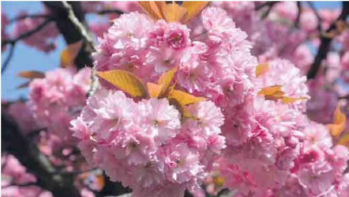
Kirschblüte, auch im Detail wunderschön.