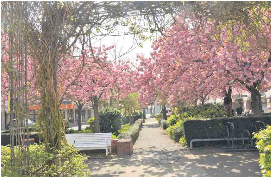
Ein rosa Baldachin spannt sich über die Borsigallee.

Brüser Berg. Die Tradition stammt aus Japan: dort ist es schon sehr lange Brauch, den Frühling festlich zu begrüßen und seine prachtvolle Schönheit am O-Hanami (Kirschblütenfest) zu bewundern. Seit über tausend Jahren feiert man in Japan Hanami, was eigentlich nichts anderes bedeutet als „Blüten beobachten“. Auch in Deutschland etablierten sich im Laufe der Jahre mehr und mehr Kirschblütenfeste. Zu einem besonderen Hotspot wurde dabei die Heerstraße in der Bonner Altstadt. Schnell erhielt sie den Ruf, zur Kirschblütenzeit eine der zehn schönsten Straßen der Welt zu sein. Erklärt hatte sie dazu ein Blogger, der im September 2012 ein Foto der Heerstraße unter der Facebook-Seite „Places to see before you die“ hochlud. Das trug der Straße weltweite Berühmtheit ein. Und schwemmte eine