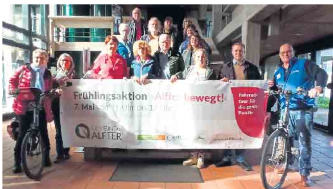
Repräsentanten der Gemeinde, der teilnehmenden Betriebe und Partner präsentierten die 14. Frühlingsaktion „Alter bewegt“ im Alfterer Rathaus.

wo neben der Präsentation der neuesten Küchen- und Wohntrends kleine frisch zubereitete mediterrane Köstlichkeiten die Radler für die folgende „Bergetappe“ stärken. „Fahrrad-Frühling-Freude“ heißt es anschließend bei der Genuss-Schule Alfter (Brunnenstraße 44), wo eine Schulspeisung mit Tradition auf dem Programm steht. Anschließend lockt die Galerie Conrad (Oberdorf14) mit einer Skulpturenausstellung im Garten und einer Kunstausstellung. Der Naturhof Wolfsberg (In der Asbach 44) lockt mit 40 selbstgebackenen Kuchen und informiert bei sachkundigen Betriebsführungen, was ein Obstbaubetrieb eigentlich macht. Beim Bio-Betrieb Burg Ramelshoven (Burgstraße 28) dreht sich alles um ökologisch erzeugte Rindfleischprodukte inklusive Stallführung mit Einblick in die Mutterkuhhaltung. Danach geht es weiter zu Fahrrad Strack in Witterschlick (Hauptstraße 232), wo „Fit in die Rad-Saison 2023 - aber sicher!“ Hauptthema ist. Auf dem dortigen Dorfplatz präsentiert der Gewerbeverein Alfter seine Aktion „Regional Alfter - Kaufen und Arbeiten vor Ort“, kurz: REGIONALF-TER, wo sich Unternehmen präsentieren, Fach- und Nachwuchskräfte akquirieren und aktiv netzwerken können. Beim Stellwerkmuseum Bahnhof Witterschlick (Seraistraße 34) ist der „Lummerland-Brun-