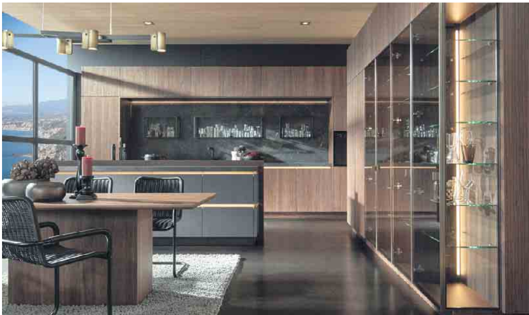
Ein einzigartiges Lichtspiel: Premiumküche mit viel Holz, Glas und gebürstetem Messing, die anhand einer patentierten Beleuchtungslösung perfekt zur Geltung kommen. Ein besonderer Blickfang sind die Vitrinenschränke.

stand - er ist sehr viel bruchfester als Echtglas - und punktet u. a. mit einem zudem geringen Gewicht. In der Küche begeistert er mit wahlweise glänzenden oder matten Fronten in einer hochwertigen Glasoptik sowie als pflegeleichte Küchenrückwand in Nischen. Die einzigartige Tiefenwirkung entsteht durch eine polymere Oberfläche mit einer darunterliegenden Farbschicht. Aufgrund ihrer hohen Kratzbeständigkeit sehen die farb- und UV-stabilen Oberflächen auch noch nach Jahren top aus. Darüber hinaus sind sie gegen Fingerabdrücke unempfindlich. Und wenn sie zusätzlich mit einer magnetischen Funktion ausgestattet sind, können sie auch noch als Memory-Board genutzt werden, um darauf kurze Botschaften für andere Haushaltsmitglieder zu hinterlassen - je nach Oberflächenausführung mit Whiteboard-Markern oder Kreide. „Wohlgefühl, Optik und Haptik spielen in der Küche