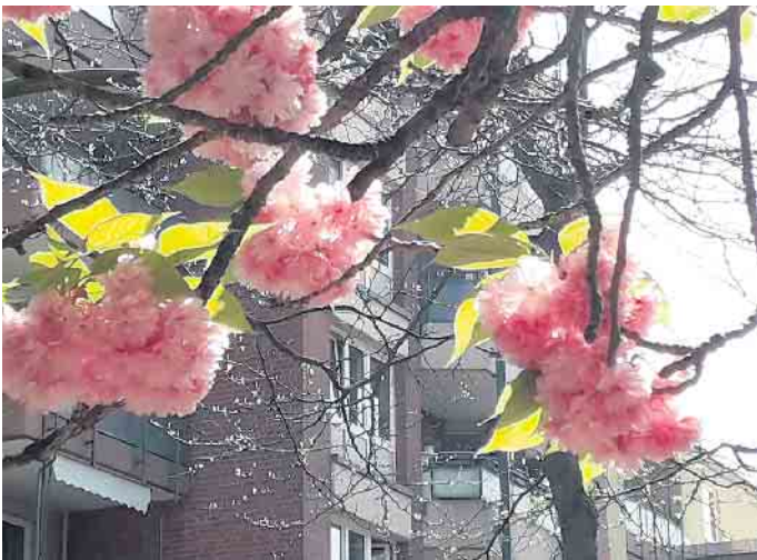
Schönes Detail: Kirschblüte ganz nah.

henden Bäume den Mittelstreifen der Fußgängerzone und bieten traumhafte An- und Ausblicke. Hier ein schöner Bogen, dort eine Parkbank, die durch die rosarote Umrahmung zum Traumplätzchen wird. Und das alles ganz ohne Besucherandrang, einfach nur zum gemächlichen Flanieren, Bewundern und Genießen. CSH