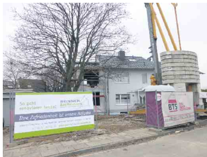
Koordinierte Abläufe sparen Zeit und Geld