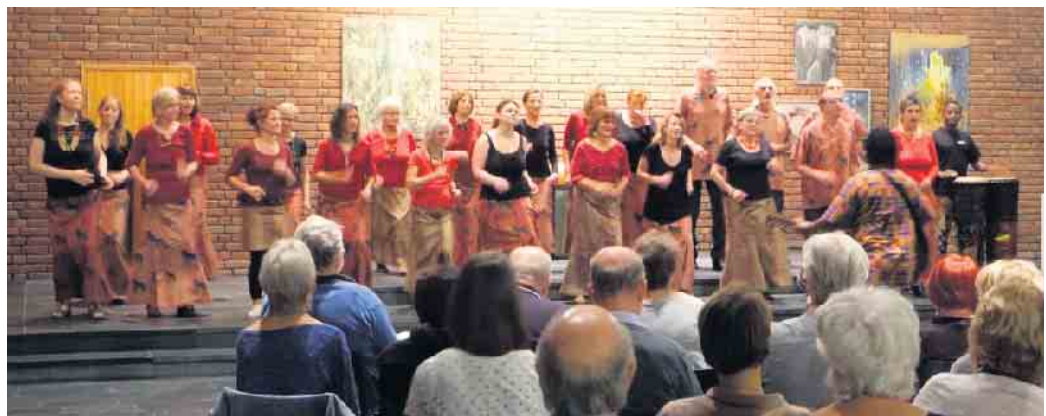
Gipsy Jazz vom Feinsten: Café gitane

Telefon 0228 - 240 30 792 • Mobil 0176 - 637 23 717