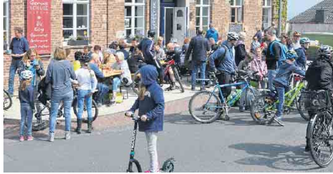
Eine Rast bei der Genuss-Schule Alfter ist immer eine willkommene Unterbrechung der Radtour.

Anbau und die dort beheimatete Gelis Kaffee Ecke Kaffee und Kuchen, gebacken nach alter Handwerkstradition. Den Abschluss bildet dieses Jahr das „Haus der Älteren Geschichte“ (Hertersplatz 19), wo sich seine Arbeitskreise mit der Ausstellung „Geschichte lebt - Vom Wasser bis zum Rebellentum“ prä-