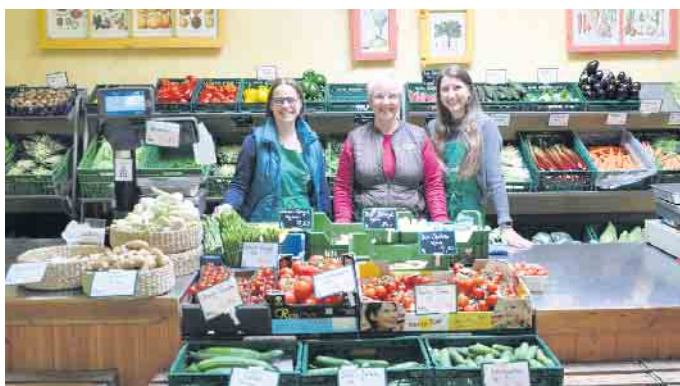
Der Hofladen Mandt verwöhnt mit frischem und schmackhaftem saisonalem Gemüse und Obst seine Kunden.

Ben ein. Dort informiert auch der RVT über die Rheinische Apfelfroute und weitere Erlebnistouren und -stationen in der Region. Anschließend geht es zurück nach Alfter-Ort. Dort bieten der Hofladen Mandt (Taubenweiherweg 4), erntefrischen Produkte aus eigenem