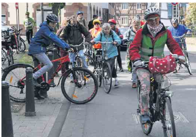
Traditionsgemäß startet die Fahrrad-Tour vor der Öffentlichen Bücherei am Hertersplatz in Alfter-Ort.

nen“, die Modellbahn, das Stellwerkmuseum und das Trauzimmer zu besichtigen. Das Alanus Café der Alanus Hochschule & Werkhaus (Campus I, Johannishof, Lohheckenweg), das am 30. April seine Sommersaison eröffnete, lädt zum Verweilen bei Kunst, Natur und Genie-