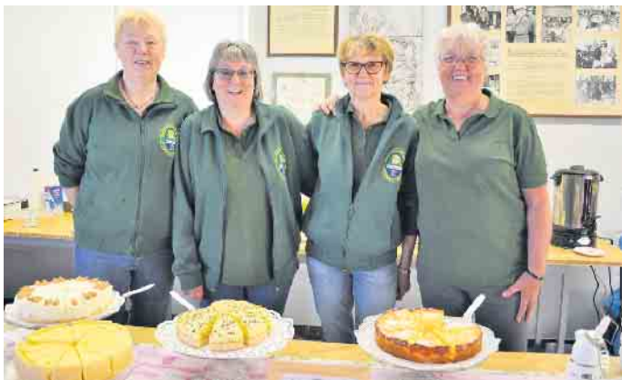
Verlockendes Kuchenbüfett, präsentiert von den Schützendamen.