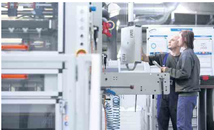
Ausbildung an hochmodernen Produktionsmaschinen in der Faltschachtel-Industrie.

Kennen Sie Unboxing-Videos? Das sind Filme, die Menschen beim Auspacken von Produkten zeigen. Auf YouTube gehören sie schon seit vielen Jahren zu den beliebtesten Formaten und werden millionenfach angeklickt. Man kann das kurios finden. Der Unboxing-Trend zeigt aber, wie inspirierend Verpackungen auf Menschen wirken können. Ob Lebensmittel, Kleidung oder Kosmetik - wir schätzen es, wenn die Dinge des täglichen Lebens in ansprechenden Faltschachteln, Beuteln, Dosen oder Flaschen angeboten werden. Wie Verpackungen erdacht und hergestellt werden, darüber denken wir in der Regel nicht nach. Dabei laufen sehr komplexe Prozesse ab, bevor ein Produkt wohlverpackt im Regal steht - vom Design über die Materialauswahl bis hin zur Herstellung. Genau das macht Jahr für Jahr Berufsanfängerinnen und -anfänger neugierig, die sich für eine Laufbahn im Bereich Verpackung entscheiden: Warum nicht kreativ an etwas mitarbeiten, das später millionenfache Verwendung findet? Interessant ist dabei vor allem eine Karriere in der Faltschachtel-Industrie. Karton wird aus nachwachsenden Rohstoffen gewonnen und lässt sich sehr gut recyceln. Karton-Verpackungen gehören die Zukunft, weil die Politik mehr Engagement für den Klimaschutz einfordert und daher nachhaltige Produktion, Recycling und Kreislaufwirtschaft fördert.