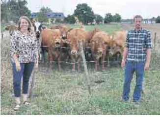
Erstmals ist die Rinderzucht Hof Frizen (Burg Ramelshoven) bei der Frühlingsaktion dabei.

Anbau und die dort beheimatete Gelis Kaffee Ecke Kaffee und Kuchen, gebacken nach alter Handwerkstradition. Den Abschluss bildet dieses Jahr das „Haus der Älteren Geschichte“ (Hertersplatz 19), wo sich seine Arbeitskreise mit der Ausstellung „Geschichte lebt - Vom Wasser bis zum Rebellentum“ prä-