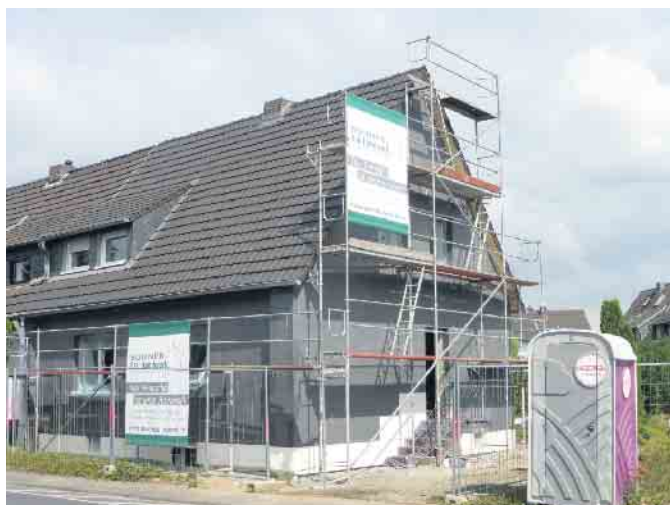
Sanieren, Renovieren aus einer Hand mit dem Bonner Bau Handwerk

Alle Infos zum Bonner Bau Handwerk unter www.bonner-bauhandwerk.de CSB