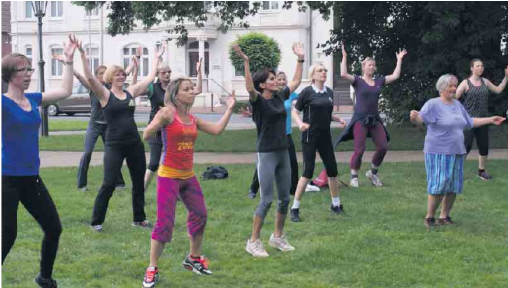
Auch in diesem Jahr: Zumba vor dem Rathaus Hardtberg