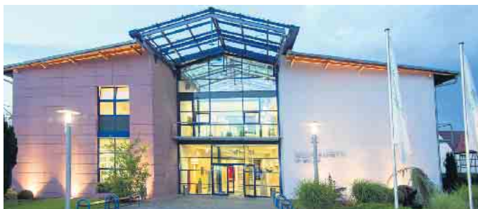
Das Bundesausbildungszentrum der Bestatter.

Wer den Bestatterberuf anstrebt, bringt idealerweise Fähigkeiten mit, die ihm bei den täglichen Herausforderungen eine wertvolle Stütze sind. Neben handwerklichem Geschick ist vor allem menschliche und trauerpsychologische Kompetenz wichtig für die Beratung und Begleitung trauernder Angehöriger. Die Ausbildung umfasst Kenntnisse spezieller Bestattungsdienstleistungen, der hygienischen Versorgung Verstorbener, der rechtlichen Rahmenbedingungen sowie kaufmännische Aspekte.