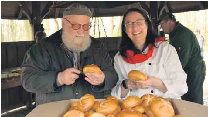
Die Aufschneider: hier werden die Brötchen für hungrige Mäuler gerichtet