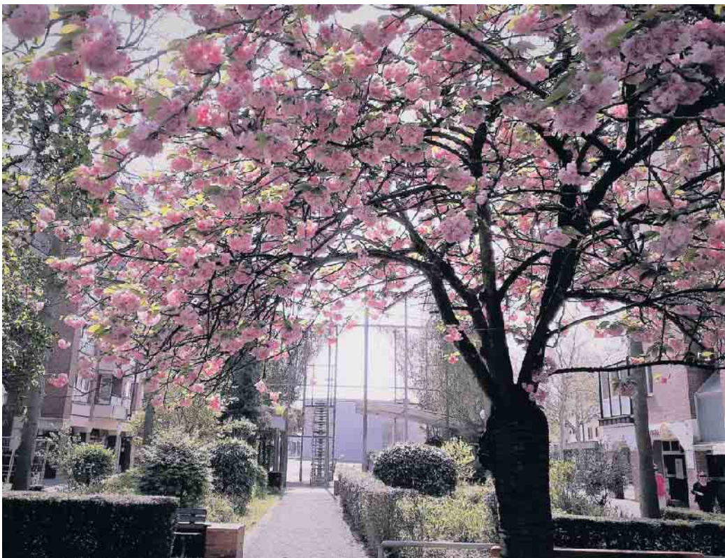
Ein Traum in Rosa: Kirschblüte auf dem Brüser Berg.

Für Kenner allerdings kein Grund, auf den Genuss der rosaroten Pracht zu verzichten. Denn auch an vielen anderen Stellen in Bonn finden sich wunderschöne Blütenalleen. Ganz besonders prächtig präsentierte sich die Borsigallee auf dem Brüser Berg. In zwei Reihen flankieren die blü-