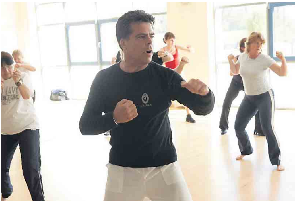
AROHA® ist inspiriert von Tai Chi, Kung FU und dem HAKA-Kriegstanz der Maori.

Fitness für alle steht nach den Osterferien wieder neu auf dem Programm des Turn- und Gymnastikvereins Bonn 1967 e. V. (TGV). Tänzerisch beschwingt geht es am Freitag bei Dance Fitness für Einsteiger*innen übers „Parkett“. Am Dienstag bietet AROHA® eine einzigartige Kombination von kraftvollen und sanften Bewegungen, die inspiriert sind von Tai Chi, Kung FU und dem HAKA-Kriegstanz der Maori. Beide Kurse vereinen Spaß und Fitnesspower, garantieren ein effektives Herz-Kreislauf-Training und sind ein optimaler Fett- und Kalorienkiller. Für Sie stehen Kraft, Ausdauer, Beweglichkeit und Koordination oben auf der Prioritätenliste? Dann ist BodyCross Functional Fitness® eine gute Wahl. Neben Übungen mit dem eigenen Kör-