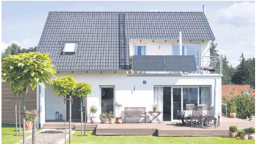
Balkonkraftwerke sind aber auch für Hauseigentümer interessant, die sich eine Photovoltaik-Anlage auf dem Dach nicht leisten können oder wollen.

Zudem dürfen alte, rückwärtslaufende Zähler übergangsweise weiterhin verwendet wer-