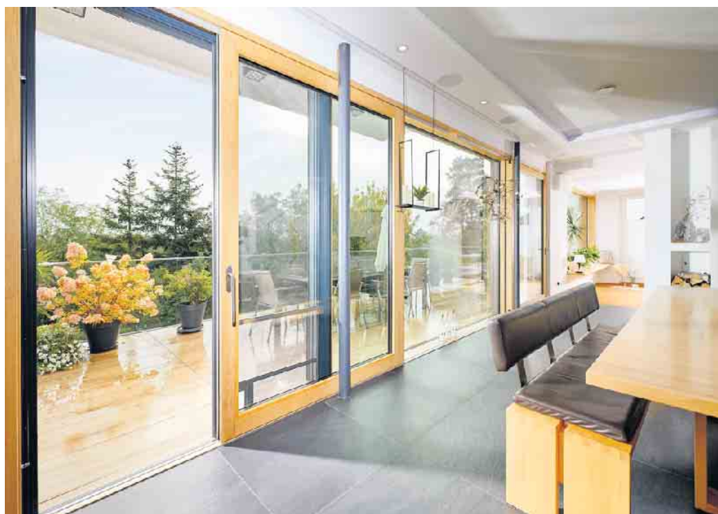
Holzfenster: der nachhaltige Klassiker.