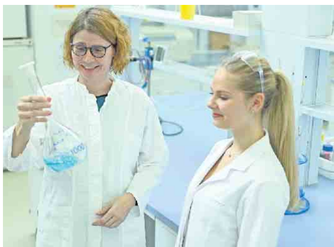
Prof. Funke (l.) verbringt viel Zeit im Labor ihrer Hochschule.

Seit gut 15 Jahren forscht Funke mit molekularbiologischen Methoden zu Diagnosen und zu mög-