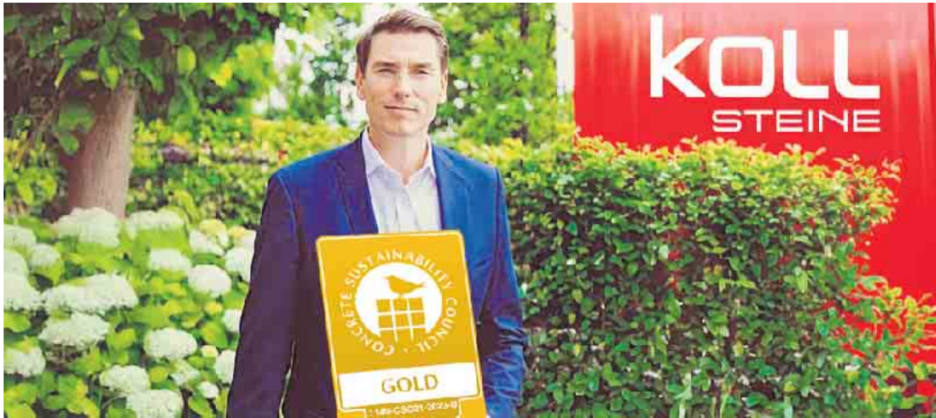
Ausgezeichnet für verantwortungsbewusste Produktion: KOLL Steine erhält Gold-Zertifikat

KOLL Steine setzt Maßstäbe in nachhaltiger Betonsteinherstellung: Das Werk in Bonn wurde mit dem Gold-Zertifikat des Concrete Sustainability Councils (CSC) ausgezeichnet - ein Beleg für verantwortungsbewusste Produktion. Durch den Einsatz von Sekundärmaterialien, erneuerbare Energien wie Solarstrom und gezielte Energieeinsparmaßnahmen senkt das Unternehmen seinen CO 2 -Fußabdruck nachhaltig. Verbleibende Emissionen werden kompensiert - ein wichtiger Schritt Richtung Klimaneutralität.