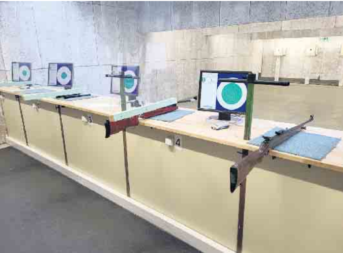
10-Meter-Stand mit elektr. Trefferanzeige

Für den Ostermontag, 21. April, lädt die St. Hubertus Schützenbruderschaft Duisdorf wieder die Duisdorfer und Hardtberger Öffentlichkeit zum jährlichen Ostereierschießen ins Schützenhaus