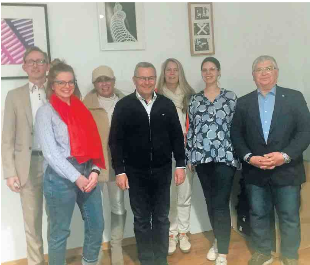
Der neue Vorstand nach seiner Wahl