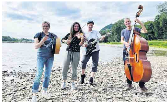
Präsentieren Irish Folk: Old Sheep Streetband“ zu Gast im Kulturzentrum

Sie lieben Irland und die irische Musik, was man in der Mischung aus gefühlvollen Songs und mitreißenden Tune-Sets spürt. Mit