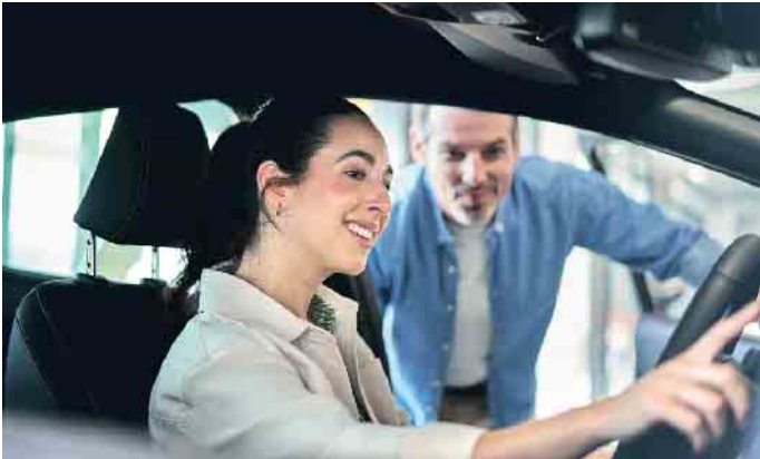
Der persönliche Kontakt im Autohaus genießt großes Vertrauen - auch wenn die Suche meist im Internet beginnt.