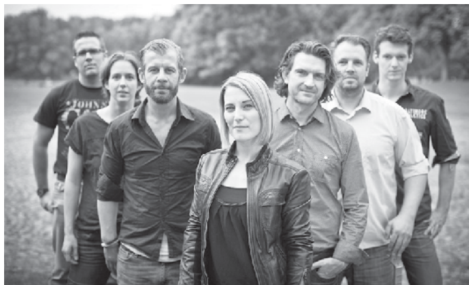
Bekannte Bonner Rockband: „Coldstack“ bei Hardtberger Frühling

„Coldstack“ und „Old Sheep Streetband“ beim Hardtberger Frühling