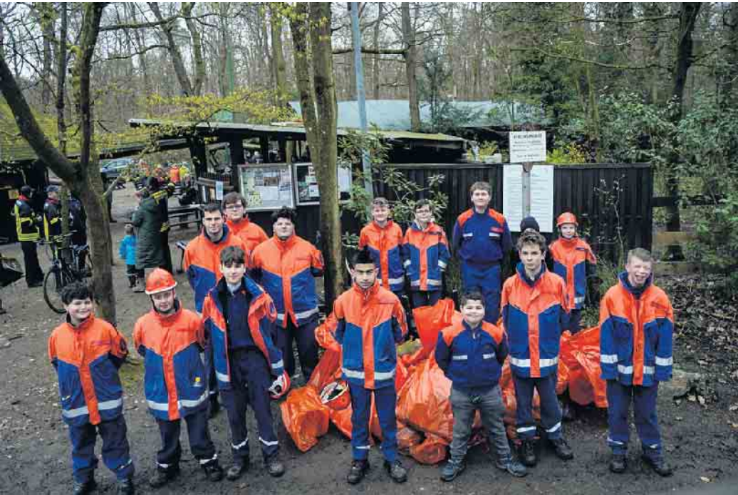
Einsatz bei der Waldreinigung: Jugendfeuerwehr Duisdorf