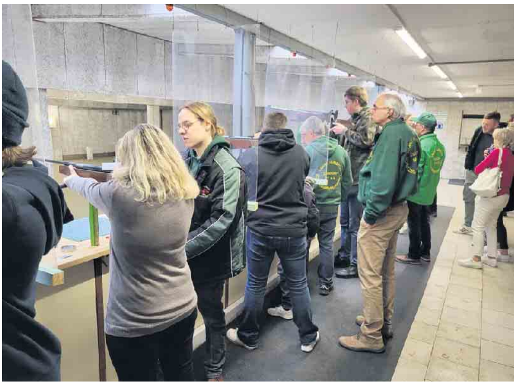
Regel Betrieb auf dem Schießstand beim Ostereierschießen

Duisdorf. Ihre Ostereierbilanz konnten viele Duisdorfer erheblich verbessern. Viele bunt gefärbte Eier und Schokoladenhasen konnten sie sich erschießen beim traditionellen Ostereierschießen der St. Hubertus Schützenbruderschaft in Duisdorf. Das erfreut sich wie in jedem Jahr nach wie vor großer Beliebtheit. Im Vereinshaus im Derletal herrschte insbesondere ab mittags trotz des etwas usseligen Wetters einiger Betrieb. Das Ostereierschießen findet traditionell immer am Ostermontag statt. Das harmoniert gut mit dem Ostereiersuchen, das von den Waldfreunden am nahe gelegenen Grillplatz veranstaltet wird. Viele Besucher schauen auf ihrem Heimweg bei den Schützen vorbei. Ab 12 Jahren kann man hier mit dem Luftgewehr seine Treffsicherheit unter Beweis stellen. Natürlich unter sachkundiger Aufsicht und Hilfe der Duisdorfer Schützen. Denn was so leicht aussieht, ist in Wirk-