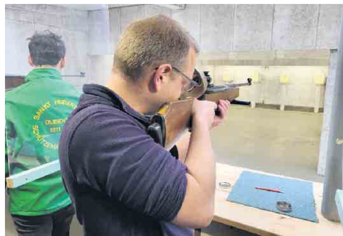
Ruhige Hand und scharfes Auge: darauf kommt's an