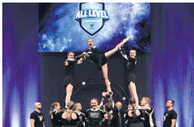
Erfolgreich bei der GALC: die Cheerleader des TKSv

Am Sonntag, 10. März, fand die German All Level Championship West in Düsseldorf statt. Hier