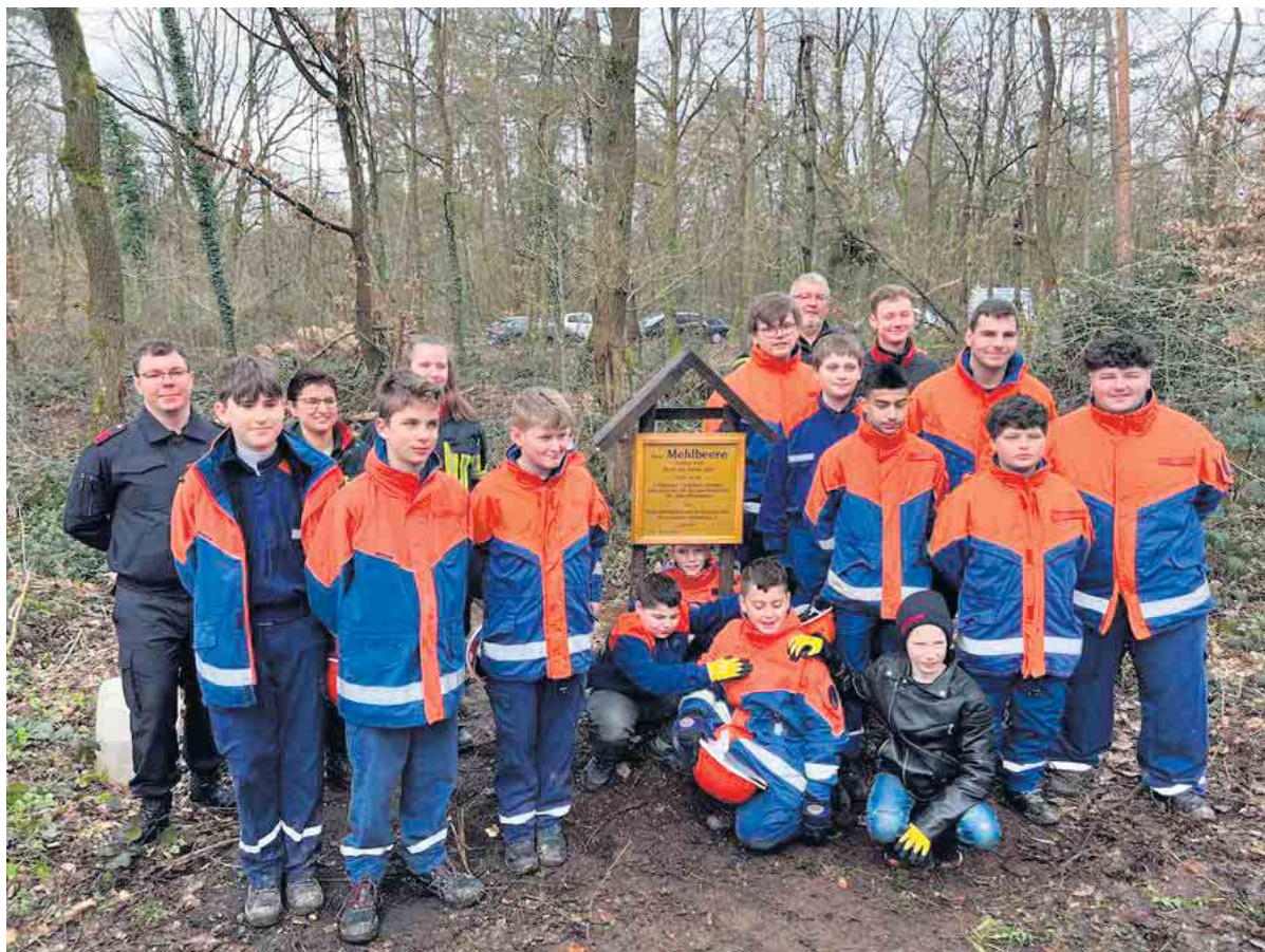
Pflanzen den Baum des Jahres 2024: Jugendfeuerwehr Duisdorf

Haben Sie auch Preis- Schmerz? Das ist bei uns kein Thema!