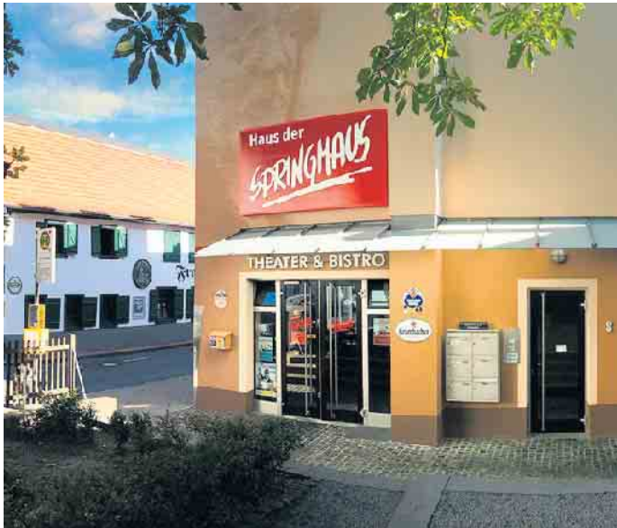
Außenansicht des Theaters Haus der Springmaus