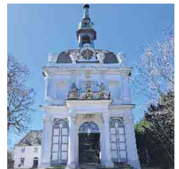
Ort der Stille: die Kreuzbergkirche.