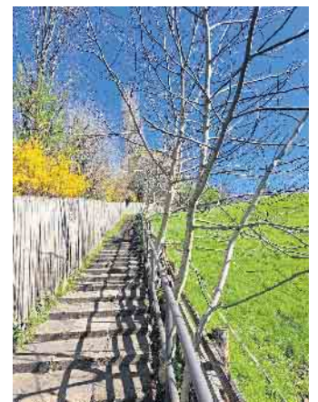
Himmelsleiter: Aufgang zum Kreuzberg von Lengsdorf.