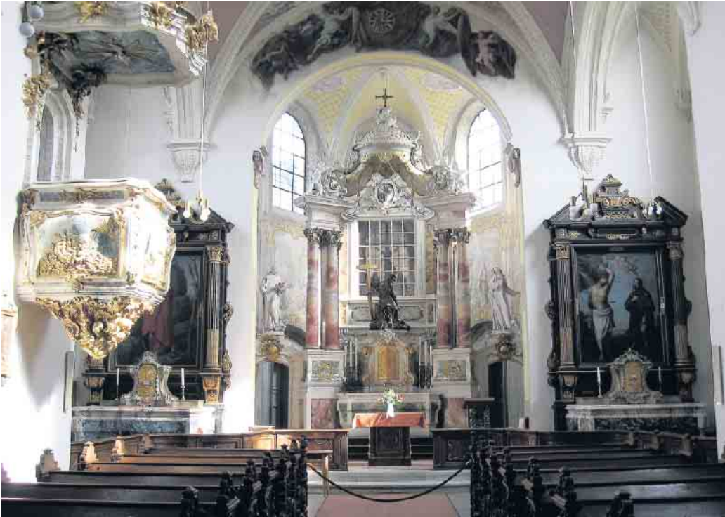
Barocke Pracht: Altar der Kreuzbergkirche