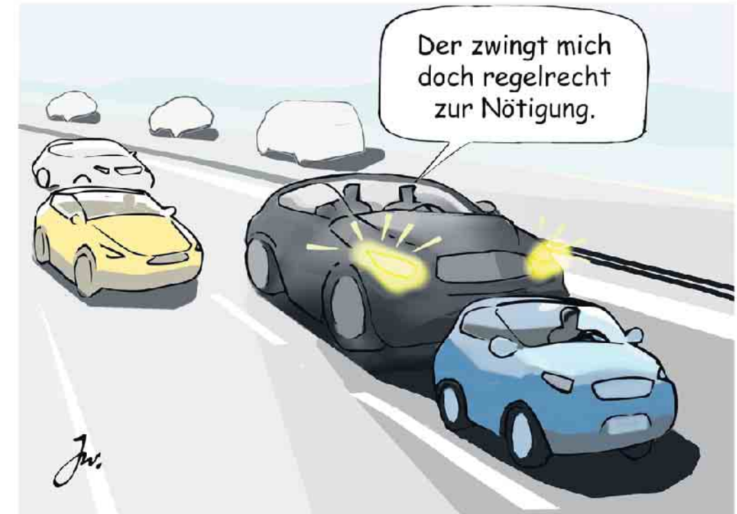
Falsche Reaktion auf Drängler: Demonstratives Langsamfahren auf dem linken Fahrstreifen trägt zur Eskalation bei.

Zur Vermeidung solcher Situationen ist es ebenfalls ratsam, bei einem eigenen Überholvorgang