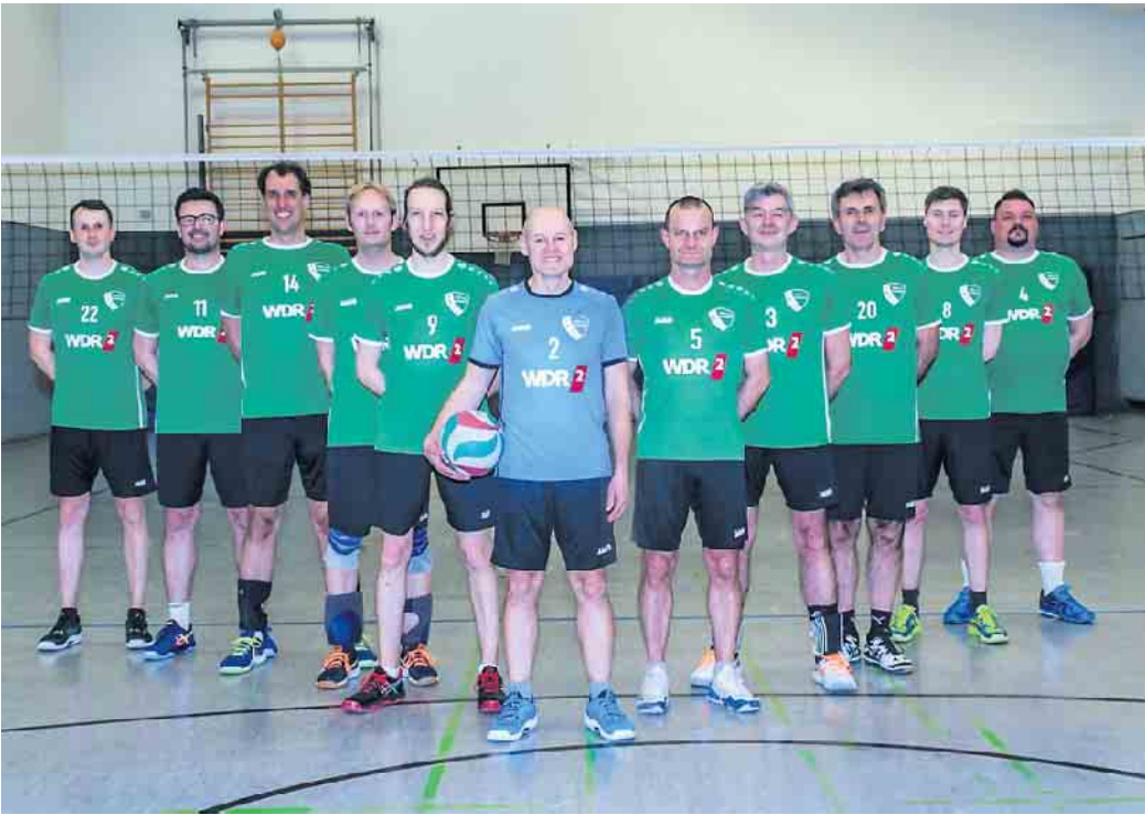
Chic in Schale: Die Volleyballer des TKS im neuen Outfit

Duisdorf. Chic sehen sie aus in ihren brandneuen Trikots, die Volleyballer des TKS. Gestaltet sind sie in den Farben des Vereins, leuchtendes Grün mit weißem Schriftzug, dazu, im Kontrast dazu die Hosen in dunkelblau. Und das Beste: das neue Outfit hat den Verein keinen Cent gekostet. Denn die Trikots mussten nicht eigens gekauft werden, der Verein hat sie gewonnen. Und zwar bei der Trikottauschaktion des WDR. Die veranstaltete der Radiosender im Zeitraum Ende Januar bis Mitte Februar. Mitmachen konnten alle Sporthelden im Westen: Vereinsmannschaften aller Altersklassen und Freizeitteams. Pro Gewinnerteam gab es je nach Sportart entweder Trikots oder Trainingsanzüge. Um eine Gewinnchance zu erhalten, mussten sich die Mannschaften beim WDR registrieren und dabei ein frei wählbares Code-