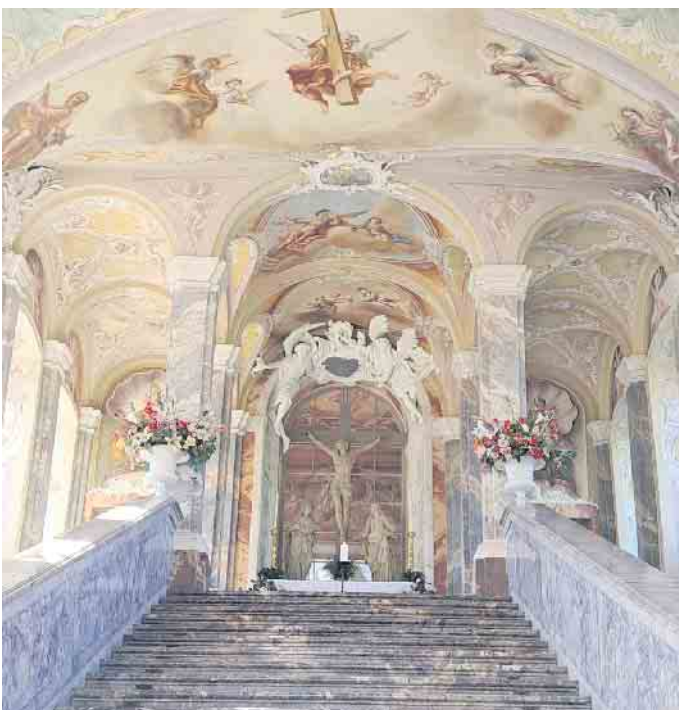
Heilige Stiege von Balthasar Neumann

Der Rundweg um die gesamte Anlage eröffnet viele schöne Blicke in das gesamte Umland, bei klarem Wetter sogar bis hin zum Kölner Dom. CSH