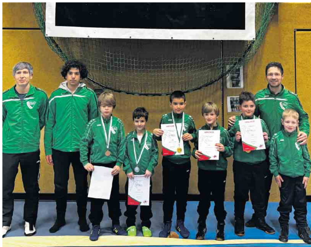
Erfolgreich bei der Landesmeisterschaft. die jungen Ringer des TKSv