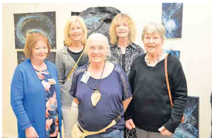
KünstlerInnen der Initiative Stadtteilkultur präsentieren auch in diesem Jahr den Kunst- und Kreativmarkt.

tag, 13. April (14 bis 18 Uhr) und Sonntag, 14. April (11.30 bis 16 Uhr). Am Freitag wird er um 16 Uhr mit einem Grußwort des Bezirksbürgermeisters und Musik (Querflöte und Klavier) eröffnet. Der Eintritt ist frei. An allen drei Tagen ist nachmittags auch die Cafeteria geöffnet und bietet heiße und kalte Getränke sowie selbstgebackenen Kuchen an.