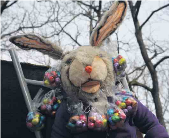
Bringt wieder viele bunte Ostereier: der Osterhase der Waldfreunde.