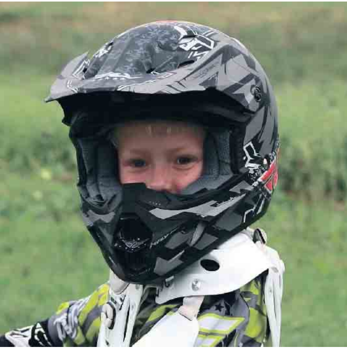
Wer leidenschaftlich gerne Motorrad fährt, steckt mit seiner Begeisterung oft auch den Nachwuchs an.

Kinder sicher auf dem Motorrad mitnehmen