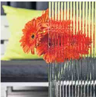
Auch Ornamentglas ist für Vögel sichtbar. Es hilft ihnen, Kollisionen zu vermeiden.

Der Begriff „Vogelschutzglas“ ist übrigens nicht rechtlich definiert oder geschützt, und es gibt keine