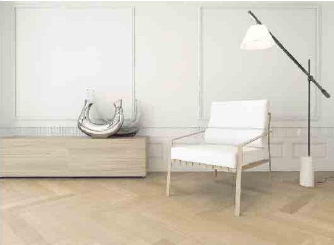
Beim feuchten Wischen gilt es, immer ein zur Oberfläche passendes Reinigungsmittel zu verwenden.