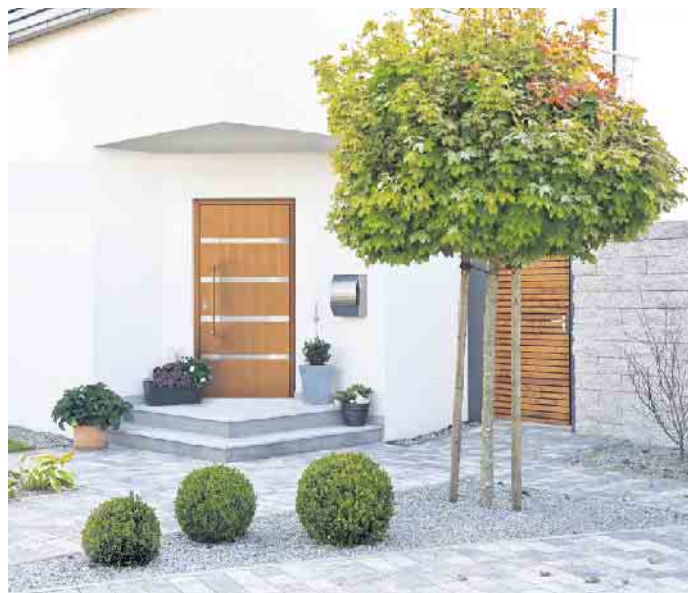
Natürlich anmutende Tür in modernem Design.

Weitere Informationen unter fenster-können-mehr.de (VFF)