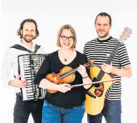
Palm, bay, frost

Wir möchten auch auf 2 Konzerte im Februar hinweisen; dazu kommen 3 Konzerte im März und als Special Tipp unser Comedy Event mit den beiden „Traummännern“.