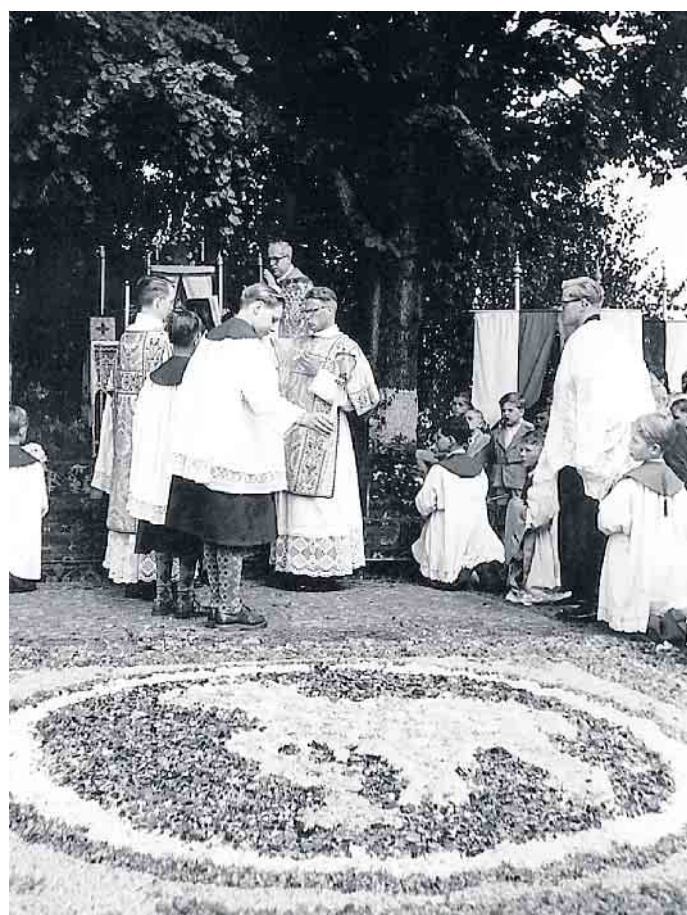
Kunstvoller Blumenteppeich zu Fronleichnam 1954