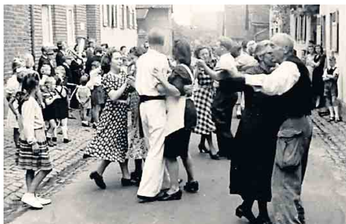
Früher ein ganz großes Fest: Kirmes im Dorf