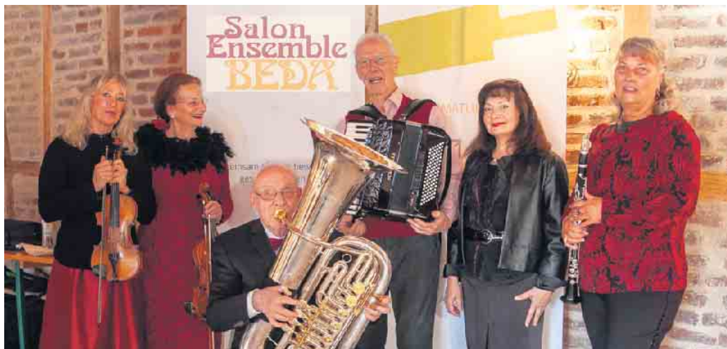
Präsentiert Evergreens der 20er: Salon-Ensemble Beda

Das Konzert findet statt am Sonntag, 5. März, Beginn 11 Uhr, Einlass ab 10.30.