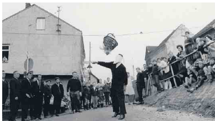
Hahneköppen 1950 im Roisdorfer Weg