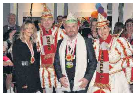
Gastgeber und Prinzenpaar standen im Mittelpunkt des karnevalistischen Abends im „Trend & Style“.