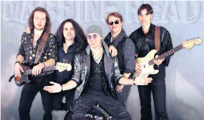
Demon's Eye.