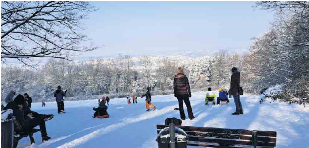
Wie ein Bild von Breughel: Kreuzberghang im Schneekleid.

Das ist ein eher seltener Anblick geworden: Eine dicke Schneedecke lag über dem Stadtbezirk. Und sie hielt sich mehrere Tage. Eine solche Schneemenge, die zudem noch über mehrere Tage hält gibt es in unserer Region nicht oft, etwa alle zehn Jahre oder noch seltener ist damit zu rechnen. Das letztemal gab es Ähnliches im Dezember 2012, als rund 15 Zentimeter Neuschnee gemessen wurden. Die gab es in diesem Jahr auch, nach einem ganzen Tag ergiebigen Schneefalls. Die glitzernde weiße Pracht aus feinstem Pulverschnee sorgte auch im Stadtbezirk Hardtberg für ideale Wintersportbedingungen.