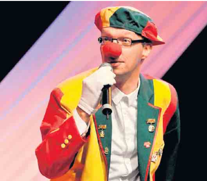
Gefragter Redner: der Tuppess vom Land kommt zum Närrischen Äsel

Schada von Borzyskowski. Der Eintritt für diese Veranstaltung ist frei, aber für das Programm werden in der Veranstaltung Spenden gesammelt. Für diese Veranstaltung sind aber Eintrittskarten notwendig. Diese liegen seit Mittwoch, 24. Januar, bei Anjas Teestübchen, in Duisdorf, Rochusstraße 216 bereit. Der „Närrische Äsel“ ist eine gefragte Veranstaltung und der Hardtberger Beitrag zum Start in die drei tollen Tage. Der Närrische Äsel findet als ständige Einrichtung in jedem Jahr am Karnevalssamstag statt. Für Getränke und Snacks ist gesorgt. CSH