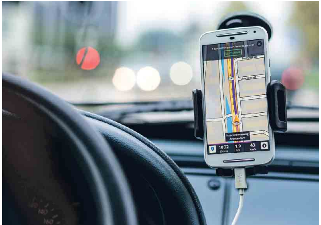
Immer mehr Menschen fühlen sich mit der Bedienung der Navigation überfordert.

Der ACE rät daher allen Autofahrenden, sich gründlich mit den Funktionen und Einstellungsmöglichkeiten des Fahrzeugs vertraut zu machen. Das gilt insbesondere für geliehene Fahrzeuge. Teilweise können bestimmte Funktionen auf „Kurzwahl“ gelegt werden oder einzelne Tasten oder Knöpfe individuell belegt werden. Damit die