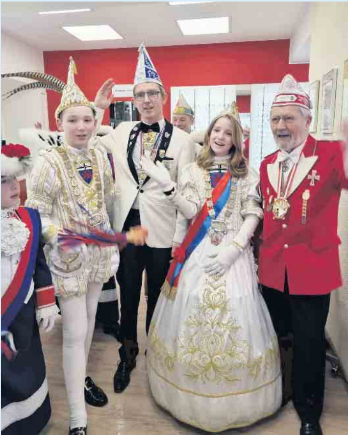
Stelldichein der Tollitäten bei Optik Kafarnik

gestellt, mit viel Tanz, Musik und jeder Menge karnevalistischer Prominenz. So gab sich natürlich das Bonner Prinzenpaar ebenso die Ehre wie das Kinderprinzenpaar, als Überraschungsgast war die Wäscherprinzessin von der Schää Sick angereist. Die Witterschlicker Tonmöhnen und die Volmershovener Herzblättchen waren anwesend. Es tanzten die Minis des TSV Legends of Dance. Die musikalische Komponente zum karnevalistischen Treiben steuerten „die Angeschwemmten“ bei. Insgesamt eine bunte Mischung aus Party, Karneval und jeder Menge jecke Tön, die für jeden etwas bot und großen Zuspruch erfuhr. OFA-Vorsitzender Bernd Schmidt zog ein rundum zufriedenes Resümée: „Auch diese Shopping-Tour war ein voller Erfolg, wie jedes Jahr ein Highlight für den Duisdorfer Karneval. Wo gibt es in Bonn eine Shoppingtour mit so viel Begleitung inklusive zwei Musikzügen für Prinz und Bonna - nur bei uns in Duisdorf! Es war mir eine Freude, ein so sympathisches Prinzenpaar den Duisdorfer Geschäftsleuten und den Duisdorfer Bürgerinnen und Bürger präsentieren zu dürfen.“ CSH