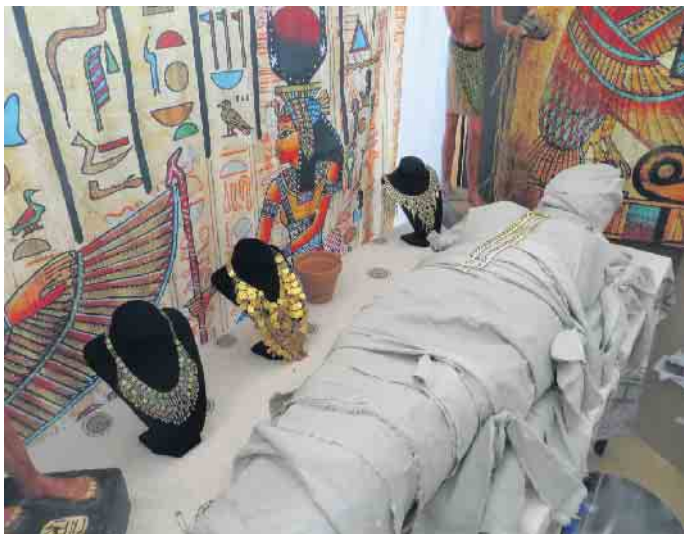
Noch ist die Mumie nicht fertig

im Flur des Museums nach geheimen Zeichen. Dies ist nur ein kleiner Ausschnitt aus unserem Programm. Dauer ca. 5 Stunden. Kostenanteil 40 Euro pro Teilnehmer