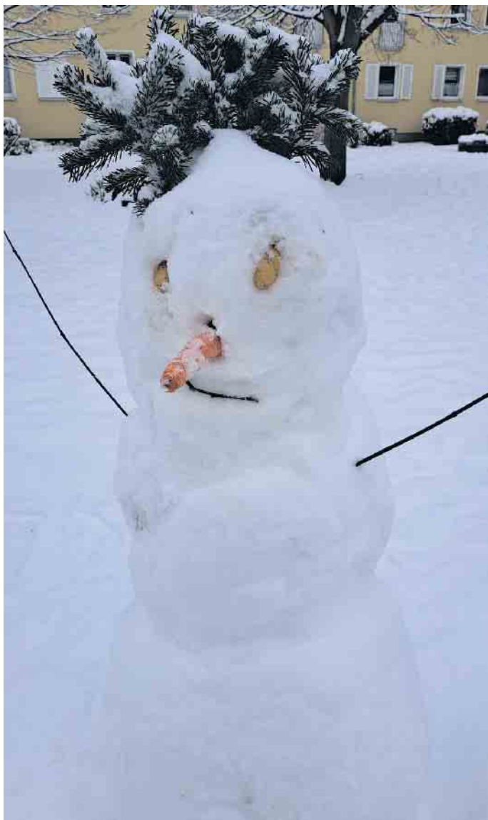
Schneemann mit Tannenhut