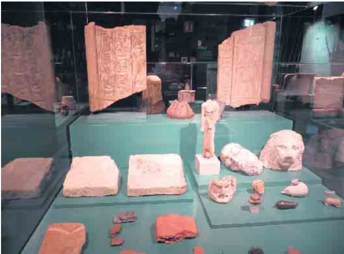
Bild aus dem neuen Museum

dann einen Hieroglyphen Text, der entschlüsselt werden soll. Danach wird bei einem Rundgang durch das Museum die Schrift an Original Objekten gezeigt Für eine kleine Pause bitte etwas zu essen oder trinken mitbringen. Über eine Spende von 15 Euro als Kostenbeitrag für Material, Führung und Gebühren würden wir uns freuen (bitte bar an Kasse im Museum entrichten, Kartenzahlung nicht möglich). Der zweite Kurs beginnt mit einem kleinen Rundgang durch das Museum dabei wird besonders auf die Bedeutung der Keramik hingewiesen und die Originale gezeigt. Es wird ein leider zer-