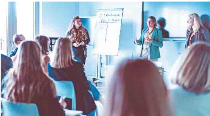
Auch einige Präsenzveranstaltungen sind während des Fernlehrgangs vorgesehen.

Selbstlernphasen, die sich zeitlich flexibel in den Alltag integrieren lassen. Im Unterschied zu klassischen Fernlehrgängen findet zudem eine intensive Betreuung durch Tutorinnen und Tutoren in Foren und Online-Seminaren statt. Ergänzt wird dies durch Präsenzveranstaltungen vor Ort in Koblenz. Die Teilnehmenden erwerben wirtschaftsbezogene Qualifikationen aus den Bereichen Volks- und Betriebswirtschaft, Rechnungswesen, Recht und Steuern sowie Unternehmensführung. Dazu kommen handlungsspezifische Qualifikationen aus den Sparten Betriebsmanagement, Investition und Controlling, Logistik, Marketing und Vertrieb sowie Führung und Zusammenarbeit. Nach bestandener IHK-Prüfung können die Teilnehmenden sowohl betriebswirtschaftliche Sachverhalte und Problemstellungen eines Unternehmens