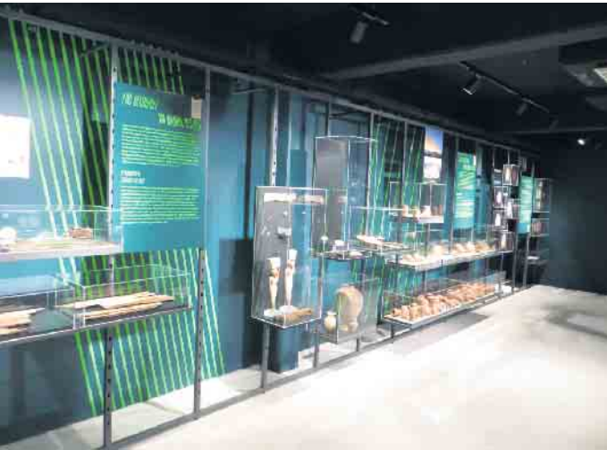
Weiteres Bild aus der aktuellen Ausstellung

Auch im neuen Jahr finden spannende Kurse für Kinder statt.