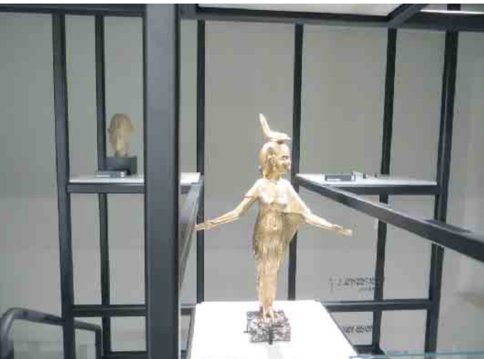
Schon im Treppenaufgang sieht man tolle Objekte.

Führung und Gebühren würden wir uns freuen (bitte bar an Kasse im Museum entrichten, Kartenzahlung nicht möglich). Veranstaltungsort: Ägyptisches Museum der Universität Bonn (P26), Poststr. 26 in 53111 Bonn. Bitte frühzeitig anmelden unter FVEgyptmuseum@gmx.de , damit ein Platz reserviert werden kann