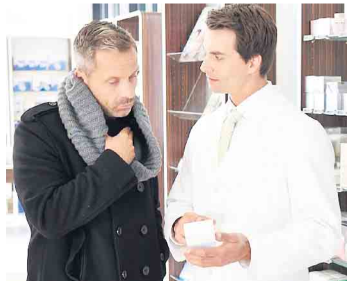
Apotheker müssen sich mit Heilmitteln und Nebenwirkungen gut auskennen.