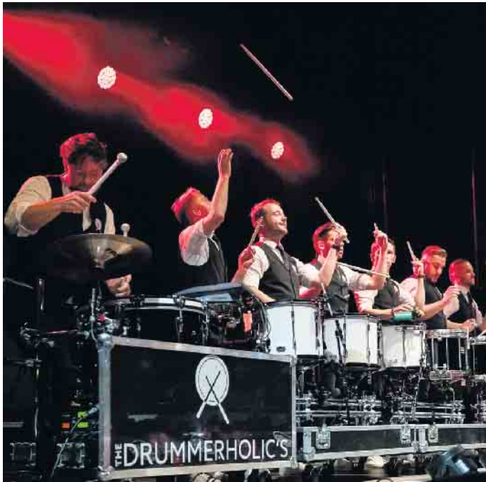
Kölsche Tön mit richtig viel Wumms: die Drummerholics

Duisdorf. Zu seiner traditionellen Weiberfastnachtssitzung in der Duisdorfer Schmitthalle lädt auch in diesem Jahr das D.K. „Blau-Weiss“ Duisdorf von 1935 ein.