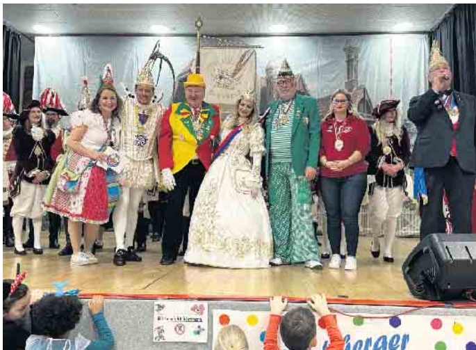
Hoher Besuch: Prinz und Bonna beim Kinderkostümfest.