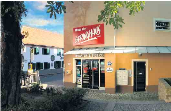
Theater Haus der Springmaus in Bonn-Endenich

Die Belohnung in Form von Abholung der Preise ist seit dem 20. Januar möglich. Bis zum 7. Mai können die Preise im Haus der Springmaus zu den üblichen Öffnungszeiten abgeholt werden. Dank Ihrer großartigen Unterstützung stärken Sie die Kultur in Bonn in ihrer Vielfalt und speziell unser schönes Theater Haus der Springmaus hier in Endenich.