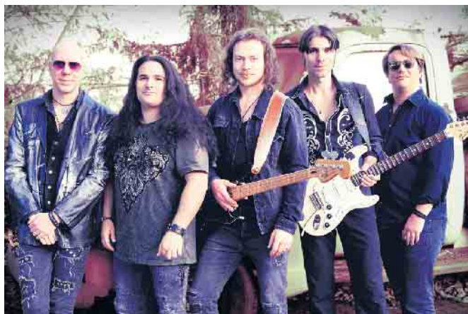
Demon's Eye.

Und noch ein besonderer Special Tipp: 2.4. „Zwei Traumänner-Eine Show“ AUSBILDER SCHMIDT „Guten Morgen Ihr Luschen, Luschienen Und Lurche“ + HEINZ GRÖNNING alias DER UNGLAUBLICHE HEINZ „Der Perfekte Mann-Eine Laugh Story“ Bonn, Harmonie (Beginn: 19.00 Uhr Bestuhlt) Für den Preis von