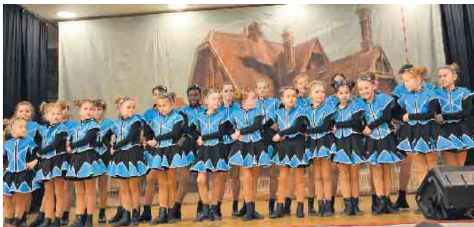
Lessenicher Sterne beim Kinderkostümfest.