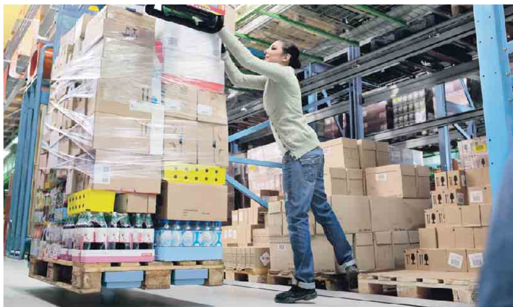
Erkrankungen des Muskel-Skelett-Systems machen den größten Anteil an den Arbeitsunfähigkeits-Tagen aus.