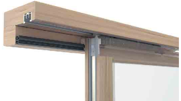
Durchdachte Konstruktionen machen Schiebetüren sicher, dicht und langlebig.

Die Soft-Close-Technik ist in vielen Lebensbereichen fest etabliert, man denke an Küchenschubladen oder Heckklappen von Autos. Bei den ungleich größeren Fasadenelementen ist das Prinzip das gleiche: Es geht darum, Elemente ohne großen Kraftaufwand und Zuschlaggeräusche schließen zu können. „Auch bei Hebe-Schiebe-Türen gilt: Eine Soft-Close-Lösung bremst schwere Flügel kurz vor der Endstellung ab und zieht sie anschließend sanft in die Verschlussposition“, erläutert VFF-Geschäftsführer Lange. Verstärken lässt sich die leichtgängige Bedienung durch den Einsatz von Kompaktaufwagen, auf denen sich die Hebe-Schiebe-Türen be-