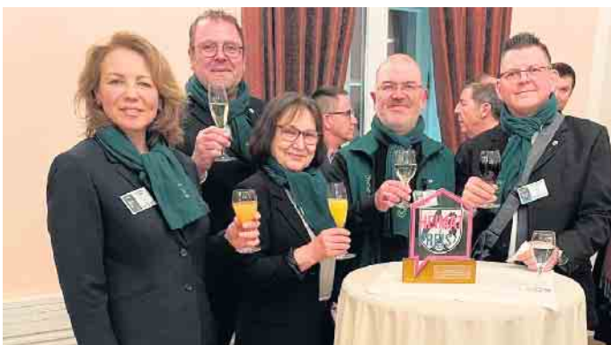
In Feierlaune: Der Vorstand der Waldfreunde nach der Preisverleihung