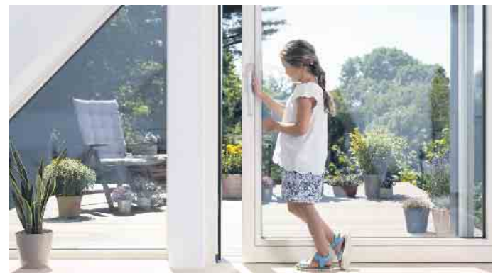
Der Trend bei modernen Schiebetüren geht hin zu großen Öffnungsweiten mit hohem Lichteinfall, einem anspruchsvollen Design und einer einfachen Bedienung.

Birkenweg 9 · 53347 Alfter fon 02 28 / 3 69 58 03 www.tobiasgregor.de