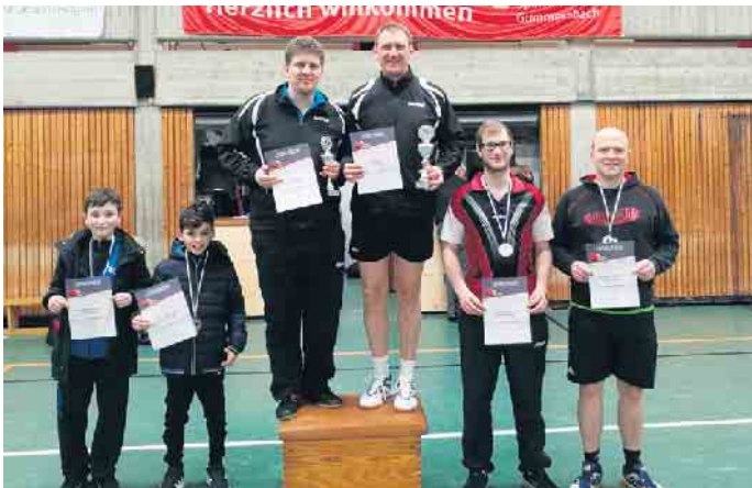
Siegerehrung Zweiermannschaft beim 20. Neujahrsturnier