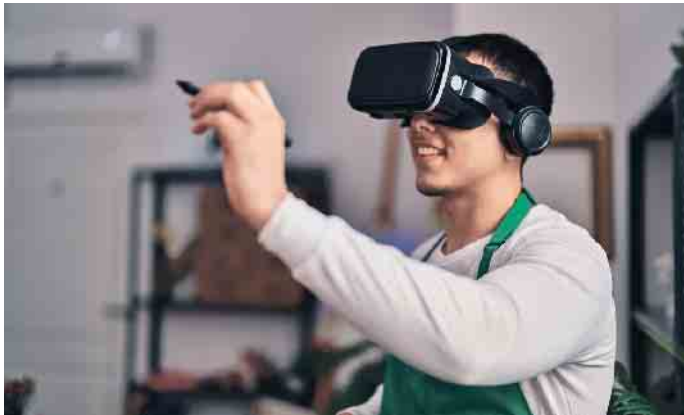
Bei der Gewinnung von Azubis setzt die Glasindustrie modernste Technologien ein. Mittels VR-Brille können Interessierte virtuell in den Beruf hineinschnuppern.