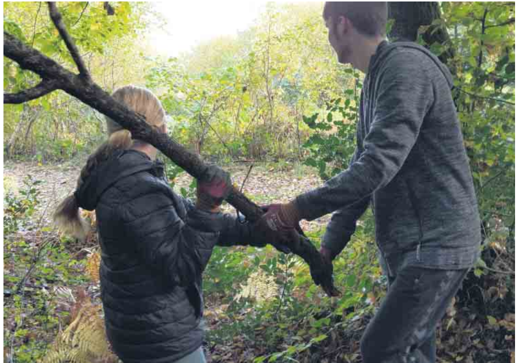
TeilnehmerInnen der Kindergruppe, die sich der Pflege der Streuobstwiese widmen

Mehr Infos unter www.klosterbauer.de und per Mail zu erfragen an freundeskreis@klosterbauer.de