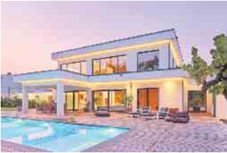
„Die Bauhausarchitektur ist Ausdruck von Individualität und Stilsicherheit.“

Fertighäuser zeigen Merkmale der Bauhausarchitektur