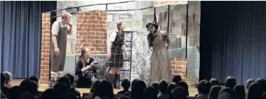
Theaterszene bei der Aufführung für die Klasse 5 und 6.

Am Freitag, 21. Oktober, wurden an der Gesamtschule Marienheide drei englische Theaterstücke von der Gruppe „White Horse Theatre“ aufgeführt, jeweils für die Jahrgänge 5/6, 7/8 und die Q2. Im Stück „BDS and The Faceless Ghost“ sahen die 5/6er-Schüler*innen, wie die Detektive Billy, Deidre und der Hund Snuffles (BDS) wegen des plötzlichen Sterbens unterschiedlicher Tiere einer Deponie von Atommüll auf die Spur kommen und wie sie es mit Hilfe der Polizei schaffen, dass diese Deponie geschlossen wird. Im darauffolgenden Stück „Missing Maths“ erlebten die 7/8er-Schüler*innen, wie sich vier Schüler*innen, nämlich Lee, Penny, Dave und Sandra überlegten, was sie aktiv tun können, um die Umwelt zu schonen und die globale Erderwärmung zu minimieren. Die Q2 sah schließlich das Stück „The Taming of the Shrew“ von William