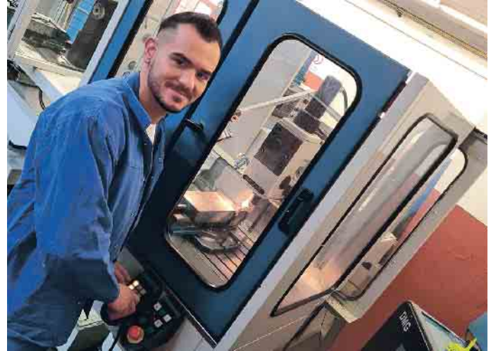
Die Kupferindustrie bietet ein breites Spektrum interessanter Ausbildungsberufe ( Abb.: Zerspanungsmechaniker Frästechnik (m/w/d) mit sicherer Zukunftsperspektive und guten Aufstiegschancen.

Unverzichtbares Funktionsmetall Kupfer ist mit seinen über 400 Legierungen wichtiger Bestandteil innovativer Entwicklungen - ob in der industriellen Anwendung, der Energietechnik, der Architektur oder in der Informations- und Kommunikationstechnologie. Kupfer ist ein relativ weiches und dehnbares, aber auch widerstandsfähiges Metall, das sich gut verarbeiten und formen lässt. Legiert mit anderen Metallen kann es weitere Eigenschaften entfalten, darunter Härte, Festigkeit, Relaxationsverhalten und vieles mehr. Zu den bekanntesten Kupferlegierungen zählen Messing und Bronze. (akz-o)