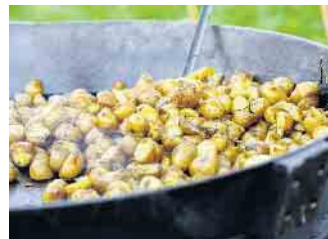
Kartoffelspezialitäten beim Kartoffelfest im LVR-Freilichtmuseum Lindlar.

toffeln auch Gemüse kaufen. Auch beim Museumsbäcker gibt es frisch gebackenes Kartoffel-