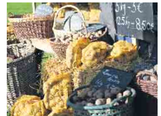
Beim Kartoffelfest werden auch Kartoffeln zum Kauf angeboten.

brot direkt aus dem Holzofen. Die alten Handwerke werden vorgeführt und auch die Hauswirtschafterin lässt sich über die Schulter schauen. Nordkasse und Nordparkplatz des Museums sind geöffnet.