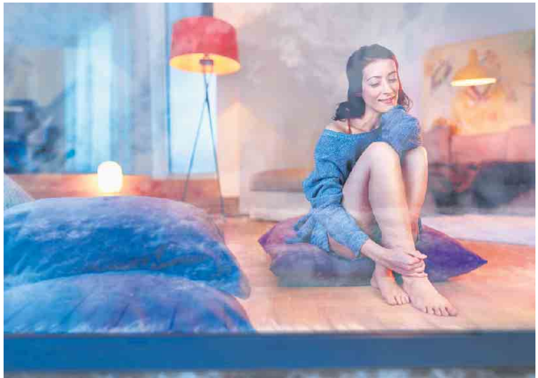
Wohlfühlen in den eigenen vier Wänden: Eine nachträgliche Dämmung von Dachboden und Kellerdecke senkt den Energieverbrauch und trägt zu einem angenehmen Raumklima bei.

mung profitieren die Bewohner noch in weiterer Hinsicht: Denn ein ganzjährig angenehmes und gesundes Raumklima trägt zu mehr Wohlbefinden bei. (djd)