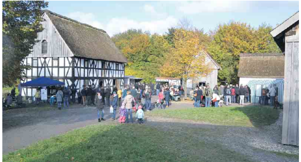
Herbststimmung beim Kartoffelfest im LVR-Freilichtmuseum Lindlar.

Für Familien sind besonders die Mitmachaktionen für Kinder interessant: „Kartoffel-Mitmach-Küche“, „Kartoffelkönig und -königin basteln“ und „Kreatives aus der Kartoffelkleister“ sind nur einige der vielen Angebote. Wer sich für die Erntetechnik interessiert, kann sich historische Geräte aus der Landwirtschaft anschauen und bei der Ackerarbeit mit Pferden zuschauen. Passend zur Jahreszeit präsentiert der Verein Drachenfreunde e.V. Köln seine Aktivitäten. Reibekuchen, Pommes und andere Leckereien sowie Getränke werden an verschiedenen Ständen gereicht. Die Museumsgaststätte Lingenbacher Hof bewirbt mit Kartoffelgerichten. Der historische Kiosk aus Wermelskirchen bietet allerlei Süßigkeiten und Spielzeug an. Am Stand des Kartoffelbauern kann man neben Kar-