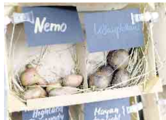
Kartoffelsortenschau beim Kartoffelfest im LVR-Freilichtmuseum Lindlar.

toffeln auch Gemüse kaufen. Auch beim Museumsbäcker gibt es frisch gebackenes Kartoffel-