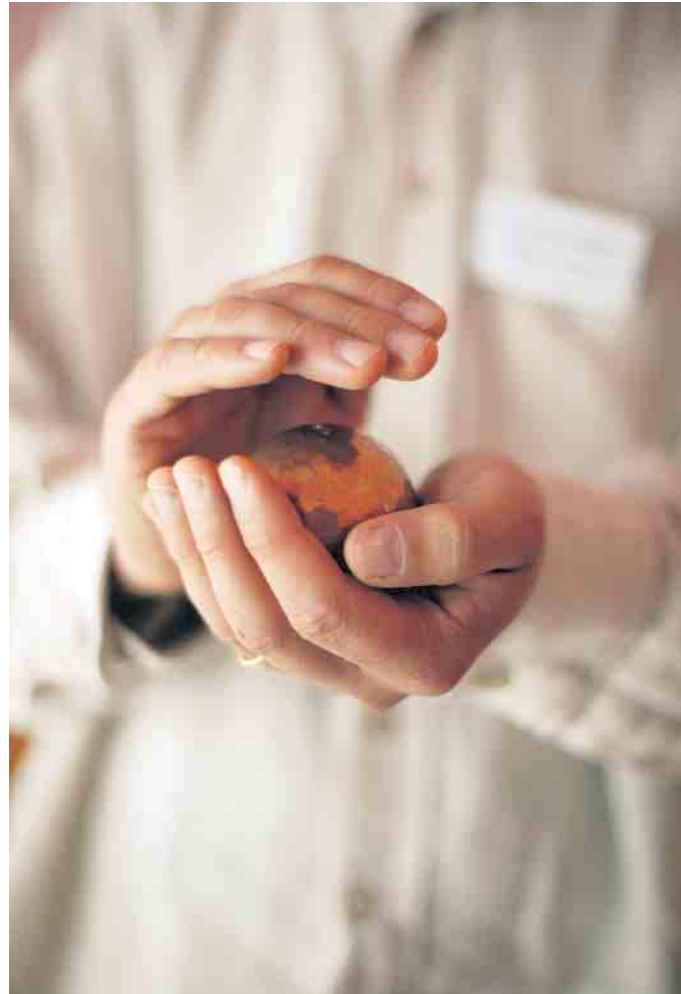
Die eigenen Bedürfnisse wahrnehmen - das unterstützt den Heilprozess.

nische Behandlung, die auf ärztliche Verordnung durchgeführt und von zertifizierten Therapeuten angeboten wird. Teilweise übernehmen die Kassen die Kosten. Astrid Andersen ist Eurythmietherapeutin und Vorstandsmitglied im Berufsverband Heileurythmie. Sie beschreibt ihren therapeutischen Ansatz so: „Wir entwickeln für die Patienten und Patientinnen eine individuelle Behandlung, in der blockierte Gefühle gelöst und geschwächte Organfunktionen gestärkt werden.“