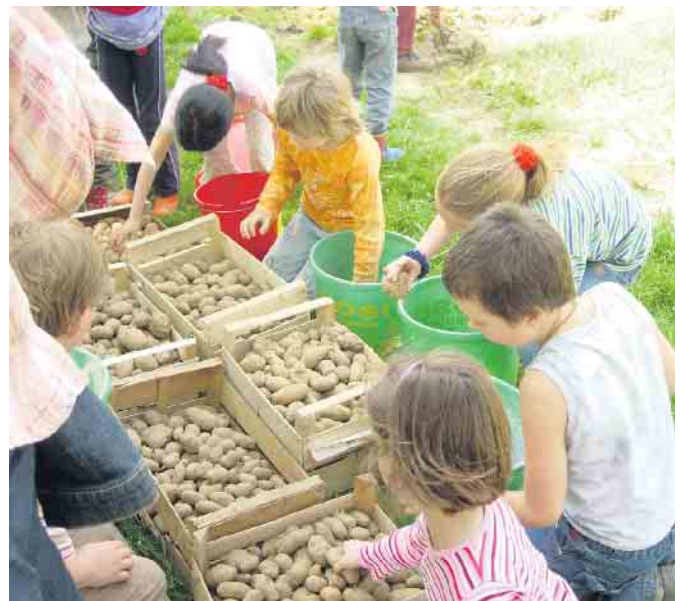
Kinder beim Sortieren der Kartoffeln im LVR-Freilichtmuseum Lindlar.