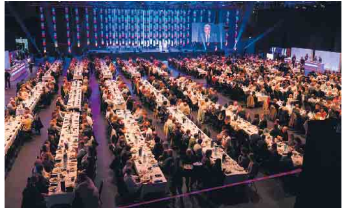
Rund 1.000 Gäste füllten die Schwalbe Arena in Gummersbach

Am Abend bat das global tätige Unternehmen dann in die Schwalbe Arena, zur „Familienfeier“, wie es in der Einladung hieß. Dort er-