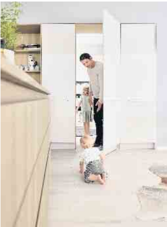
Ganz kurze Wege und 1A versteckt: Mit dieser zwischen zwei Hochschränke geplanten und integrierten Durchgangstür kann die junge Familie schnell zwischen ihrer Wohnküche und dem angrenzenden praktischen Hauswirtschafts- sowie Vorratsbereich hin- und herwechseln.

Wohnküche sind plus einem farblich angepassten Sockel. Bei grifflosen Planungen öffnen und schließen sie sich geräuschlos mithilfe einer Öffnungsunterstützung und integrierten Dämpfung. Schiebetür- bzw. Gleittürsysteme bieten interessante Alternativen. Beim Öffnen verschwinden sie entweder platzsparend in der Wand oder gleiten dank eines dezenten Schienensystems schwebelicht daran entlang. Insbesondere kleine Räume profitieren von solchen Lösungen, da keine Grundfläche für aufschwingende Türen freigehalten werden muss. Oder wenn z. B. ein separater Homeoffice- oder Laundry-Bereich in einer Ecke oder Nische in die Wohnküche integriert werden soll. In Kombination mit Hochschränken und/oder Regalsystemen ergeben sich weitere schicke, architektonische Lösungen: wenn beispielsweise ein paar imposante, großformatige Gleittüren so flexibel ver- und übereinander geschoben werden, dass bestimmte Schrank- & Regalbereiche offen, andere dagegen geschlossen oder nur zum Teil einsehbar sind. Raffinierte Gestaltungs- und Ausstattungsmöglichkeiten ergeben sich auch mit Pocketsystemen, versenkbare Einschubtüren (Pocketdoors) mit integrierter Technik - alles verpackt in einem eigenen schmalen Korpus, der sich nahtlos zwischen andere Korpusse einfügt. Hinter diesen Einschubtüren lassen sich einzel-