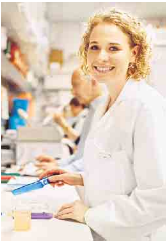
PTAs können Arzneimittel herstellen, im Labor arbeiten und sind oft auch in die Warenkontrolle eingebunden.

Die Ausbildung als PTA bietet viele Möglichkeiten und Abwechslung