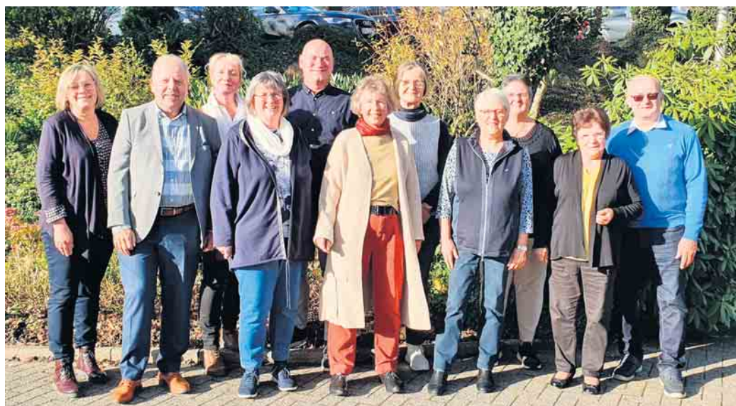
Diakonie Reisebegleiter.