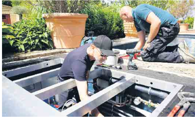
Arbeiten am Technischacht.

Immer wichtiger wird zudem, sich mit Energieeffizienz im Pool auszukennen. Schließlich will der Kunde von heute so ressourcenschonend wie möglich schwimmen. Und Poolbauer wissen, wie