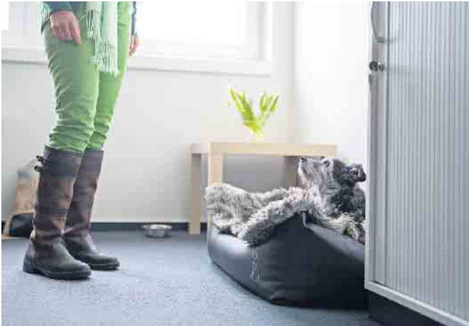
Kollege auf vier Pfoten: Hunde im Büro werden von vielen Unternehmen akzeptiert. Wichtig sind jedoch klare Regeln.

Tipps und nützliche Regeln für den Umgang mit Bürohunden