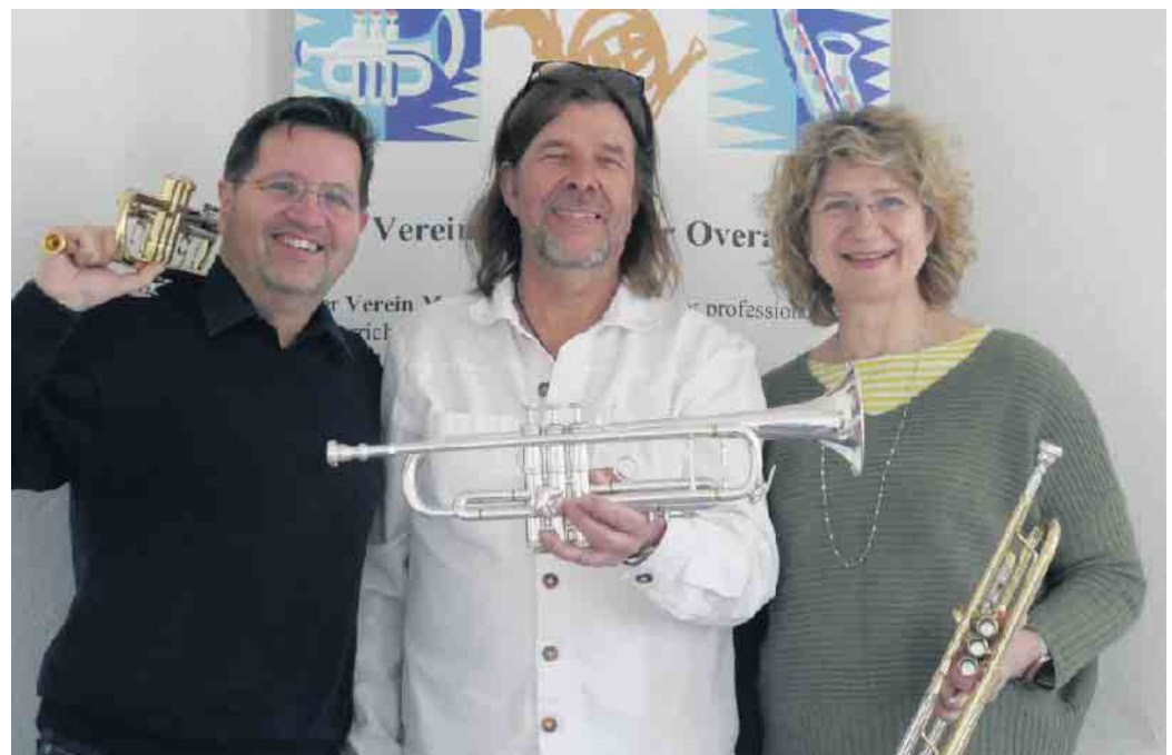
Star-Trompeter Rüdiger Baldauf (Mitte) mit Teilnehmern der letzten Veranstaltung

Im Rahmen des Trompetenchoachings wird er bei allen Teilnehmern, vom Anfänger bis zum weit Fortgeschrittenen, einen individuellen Check vornehmen und somit einen vertiefenden Einblick in die wesentlichen Elemente der Trompetenspielkunst eröffnen. Dabei geht es um die richtige Körper-