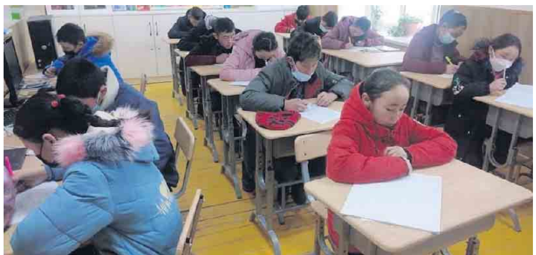
In der Grundschule lernen die Kinder der tuwinischen Minderheit zunächst in ihrer eigenen Sprache