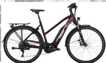
Victoria eTrekking 10.8