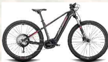
Conway Cairon S 5.0