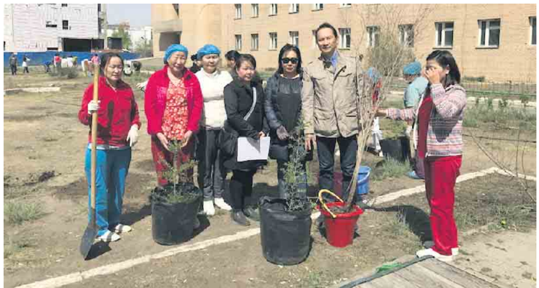
Das Baumprojekt ist in der Mongolei zu einer Volksinitiative geworden