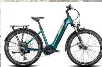
Conway Cairon SUV 3.0