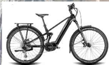
Conway Xyron SUV 6.9