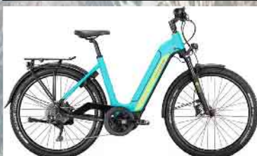
Victoria eAdventure 12.8