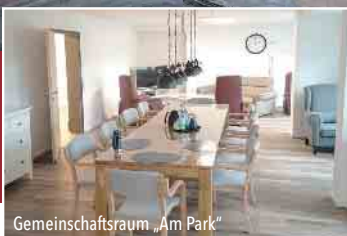
Gemeinschaftsraum „Am Park“