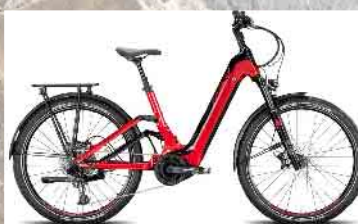
Conway Cairon SUV FS 4.7