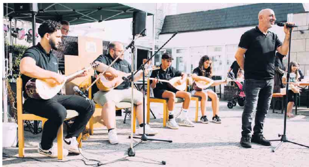
Lesen Sie den Bericht auf Seite 2