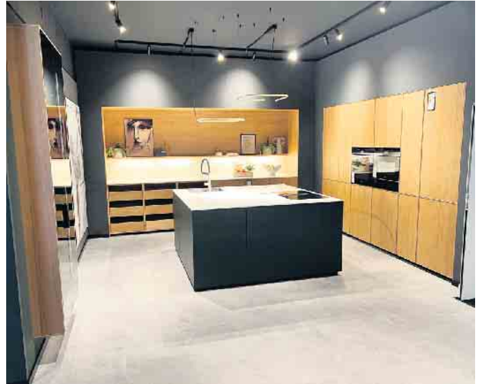
Eine der neuen next125-Küchen im Küchenstudio inklusive Beleuchtungskonzept der Firma DELTA LIGHT.

Die beiden Eventtage waren vielversprechend: von kulinarischen Köstlichkeiten über leckere Cocktails an der Bar, Kaffeespezialitäten am Coffee-Bike und natürlich die Kombination aus Wein und