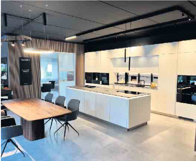
Die neue Showküche mit BORA- und Miele-Geräten, die an beiden Eventtagen zum Einsatz kam.