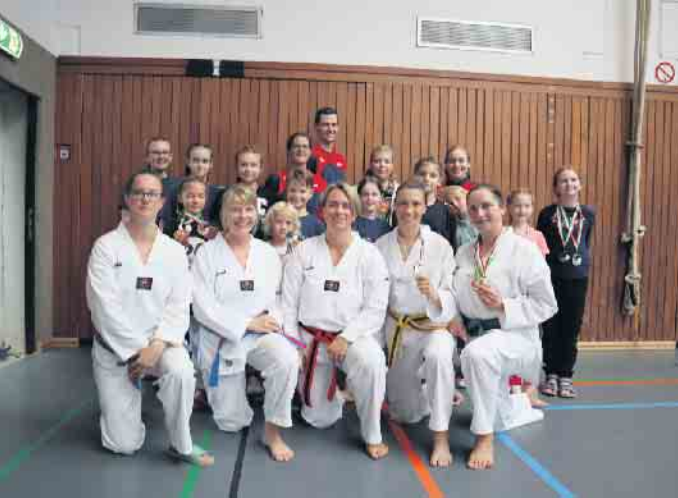
Das erfolgreiche Team