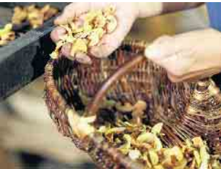
Getrocknete Äpfel frisch aus dem Dörröfen beim Obstwiesenfest im LVR-Freilichtmuseum Lindlar.

Obstwiesenfest im LVR-Freilichtmuseum Lindlar