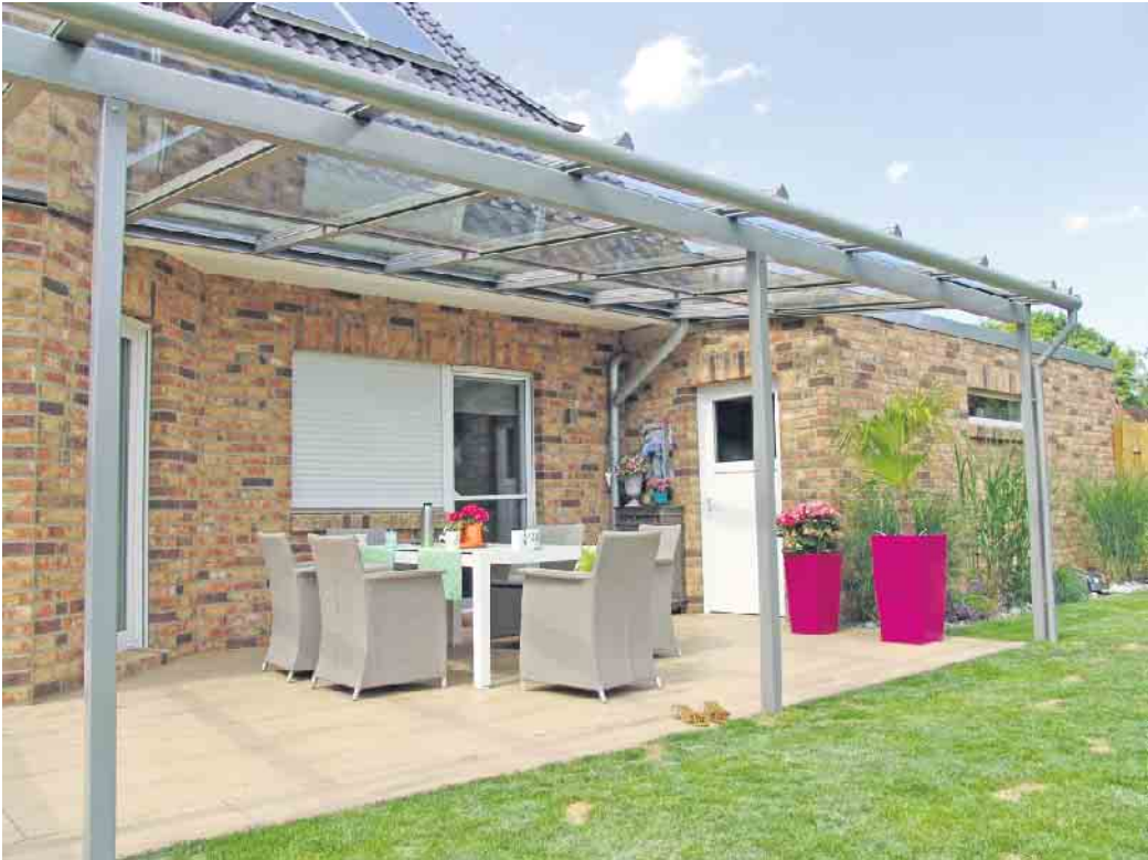
Das Pultdach ist eine einfache und beliebte Lösung für die Überdachung einer Terrasse.

Wohnkomfort erhöhen. Ein Wintergarten in Wohnraumqualität etwa ist ganzjährig nutzbar - auch während frostiger Tage im Winter oder einer Hitzewelle im Sommer. Dafür muss er aber alle erforderlichen Funktionen erfüllen: Wärme- und Sonnenschutz, Beschattung, Belüftung und Beheizung. „Die Auslotung des Nutzungswunsches, die mögliche Ausrichtung des Anbaus sowie das vorhandene Budget und die damit verbundene Auswahl der Materialien sind die Hauptachsen für einen gelungenen Wintergarten. Dies kann nur ein Fachbetrieb mit einschlägiger Erfahrung leisten“, so Peter Ertelt, Vorsitzender des