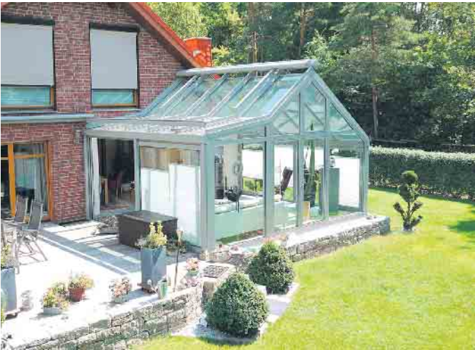
Ein Wintergarten in Wohnraumqualität erfordert sorgfältige Planung und muss auf die Nutzungswünsche der Bauherrenfamilie abgestimmt sein.

und für die Montage vor Ort. Für die Bereiche Planung und Montage müssen Fachseminare besucht und nach spätestens fünf Jahren wiederholt werden. (DJD)