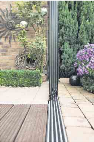
Ganzglas-Schiebeanlagen zeichnen sich durch eine besonders schlanke Konstruktion aus. Sie werden auf Laufschienen geführt.

Wohnkomfort erhöhen. Ein Wintergarten in Wohnraumqualität etwa ist ganzjährig nutzbar - auch während frostiger Tage im Winter oder einer Hitzewelle im Sommer. Dafür muss er aber alle erforderlichen Funktionen erfüllen: Wärme- und Sonnenschutz, Beschattung, Belüftung und Beheizung. „Die Auslotung des Nutzungswunsches, die mögliche Ausrichtung des Anbaus sowie das vorhandene Budget und die damit verbundene Auswahl der Materialien sind die Hauptachsen für einen gelungenen Wintergarten. Dies kann nur ein Fachbetrieb mit einschlägiger Erfahrung leisten“, so Peter Ertelt, Vorsitzender des