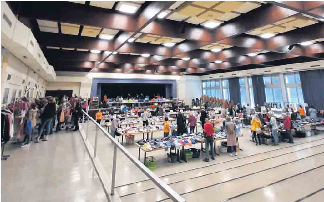
Viel Platz zum Stöbern beim Kinderbasar des TVO in der Aula des Schulzentrums Bielstein