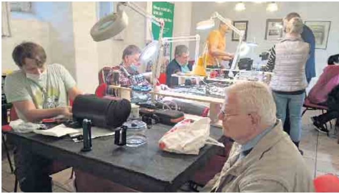
Die ehrenamtlichen Helferinnen und Helfer sind zuverlässig in den Repair Cafés der Ehrenamtsinitiative Weitblick aktiv, um defekte Gegenstände wieder instand zu setzen.