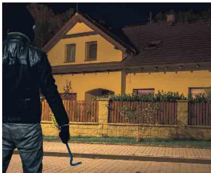
Einbrecher werden auf unbeleuchtete Häuser schnell aufmerksam. Licht täuscht Anwesenheit vor.

Doch Vorsicht: Einbrecher haben immer Saison. Über kurz oder lang werden die Maßnahmen gelockert, die Mobilität nimmt wieder zu. Das belegen auch aktuelle ADAC-Statistiken, schon jetzt erreichen die täglichen Staus wieder das Vor-Corona-Niveau. Somit sind die Menschen weniger zu Hause. Das gibt auch Dieben wieder mehr Gelegenheit, aktiv zu werden. Vor allem zum Start in das Wochenende schlagen Einbre-