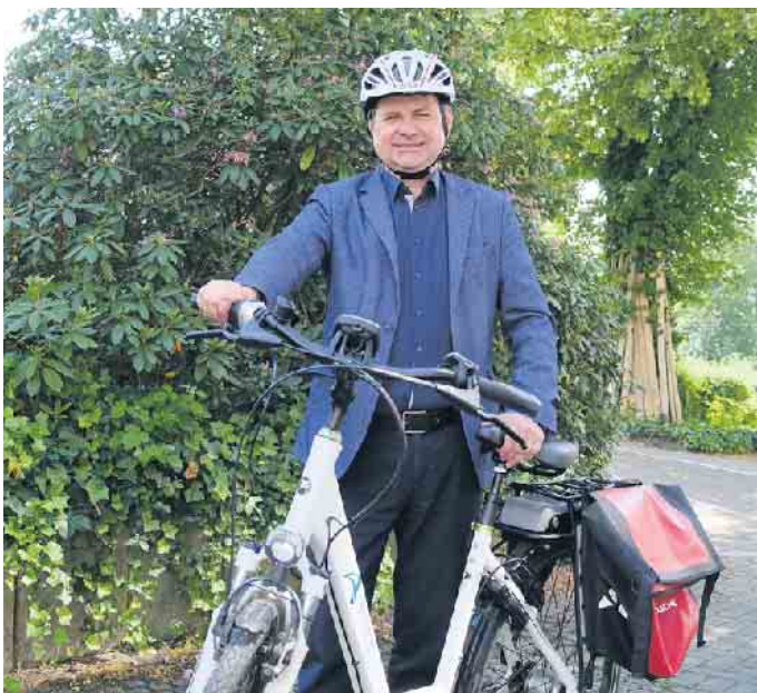
Ulrich Stücker, Bürgermeister der Stadt Wiehl.

Am Pfingstmontag, 29. Mai, startet das Stadtradeln im Oberbergischen Kreis zum fünften Mal. Die internationale Klima-Bündnis-Kampagne Stadtradeln ist als Wettbewerb konzipiert. Es geht um den Spaß am Fahrradfahren, um die Auszeichnung der aktivsten Teams und vor allem darum, möglichst viele Menschen für