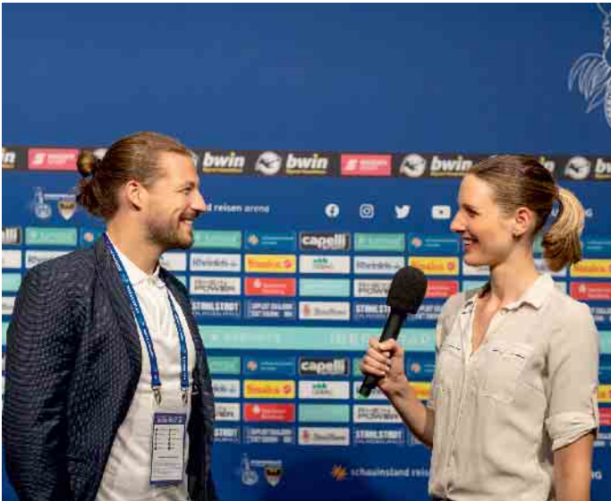
Reporter und Journalisten sind ganz nah dran an den wichtigen Leuten des Sportbusiness. Hier ist die richtige Kommunikation ausschlaggebend.

Wer in dem Bereich der Sportkommunikation Fuß fassen