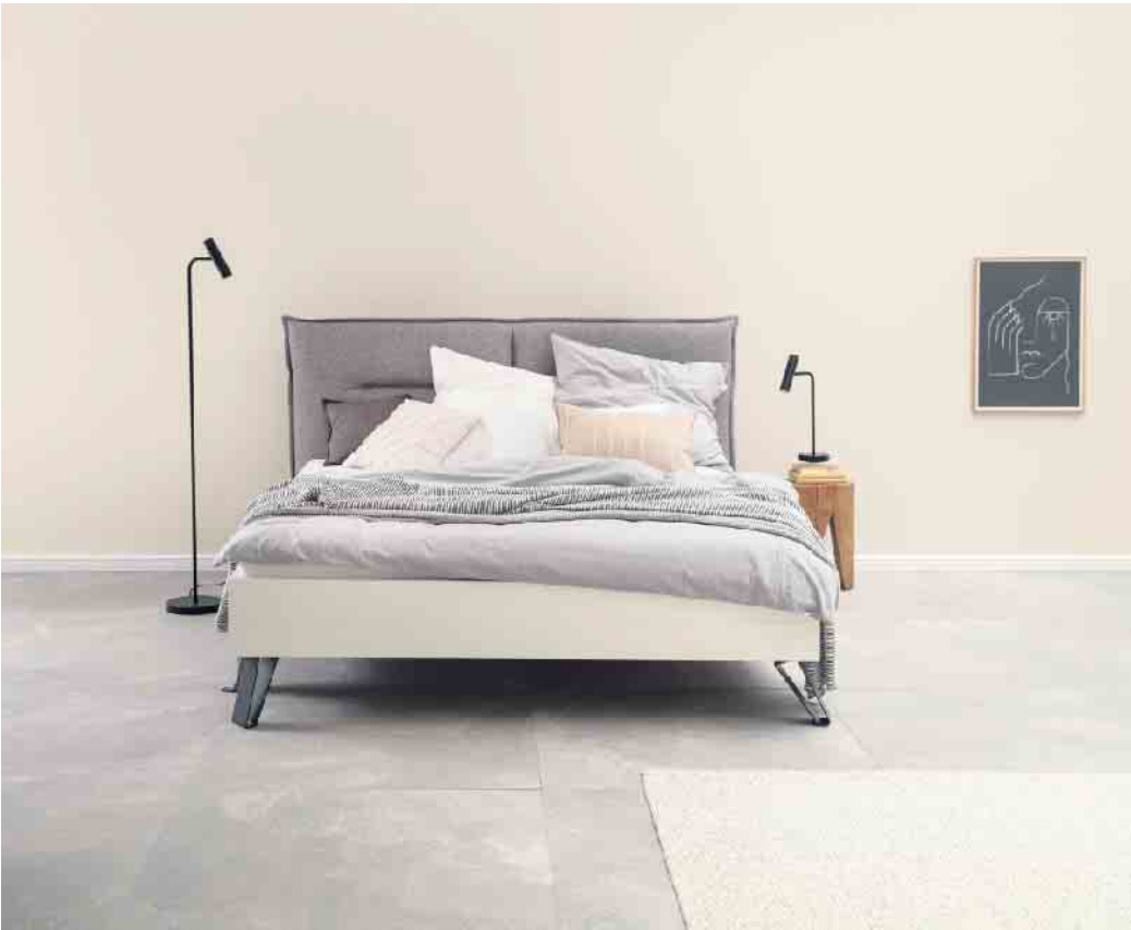
Eine Alternative zu immer nur weißen Wänden: Die Trendfarbe Cosy steht für entspannte Gelassenheit.

Mit überschaubarem Aufwand bringen Farben mehr Individualität und Behaglichkeit in die Wohnung. Sie wirkt im Handumdrehen so, als wäre man gerade erst frisch eingezogen. Den angesagten Dschungellook beispielsweise kann man mit einem Dunkelgrün für die Wände kreieren. Dazu dunkle Holzmöbel und viele üppig wuchernde Zimmerpflanzen - komplett ist die wildromantische Atmosphäre in den eigenen vier Wänden. Bei der