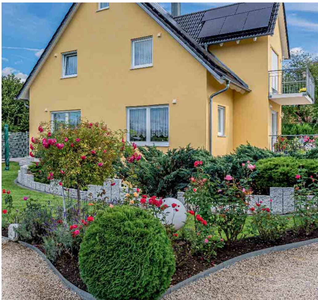
Ob Farben, Putz oder Klinker: Für die Fassadengestaltung können Hausbesitzer aus verschiedenen Möglichkeiten wählen.

Sand, Wasser und Bindemittel ermöglichen die Fassadengestaltung mit Putz in individuellen Optiken. Bei Mineralputz handelt es sich um Trockenmörtel, der mit Kalk oder Zement verbunden wird. Organischer Außenputz basiert auf Bindemitteln wie Silikon, Silikat oder Kunstharz. Durch die wasserabweisende Qualität bieten organische Putze einen hohen Schutz. Zudem lassen sich verschiedenste Gestaltungsformen verwirklichen. Besenputz, Buntstein- und Reibeputz gehören zu Fachbegriffen für die Optik der Oberfläche, die auch vielen Laien geläufig sind. Unter