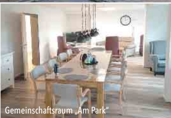
Gemeinschaftsraum „Am Park“