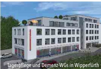
Tagespflege und Demenz-WGs in Wipperfürth