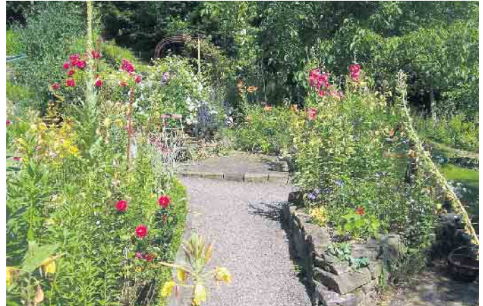
Eine Oase für Mensch und Tier - der naturnahe Garten mit seiner Wildpflanzenvielfalt und seinen spannenden Lebensräumen.

Juni und September gehören der 1.000 Quadratmeter große öffentliche Naturerlebnissgarten in Reichshof-Brüchermühle, der Künstlergarten Fahl in Gummersbach-Bünghausen, der Garten am Steinbruch der Familie Wopfner in Lindlar, der Naturgarten Budde-Hielscher in Bergneustadt sowie der naturnahe Garten mit Fernblick der Familie Ingwersen in Waldbröl-Wilkenroth. Herzlich willkommen. Termine, Adressen und Öffnungszeiten naturnaher Gärten (Teilnehmer der Offenen Gartenpforte 2023) auf unserer Website: www.diegaertenderanderen.de