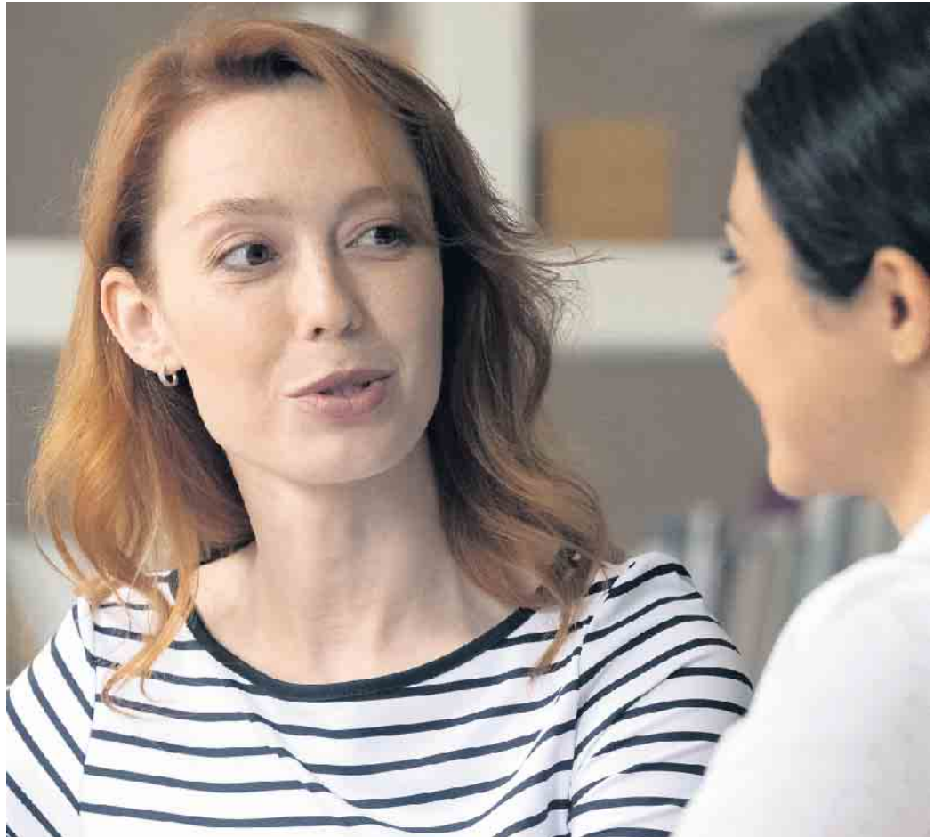
Im Erstgespräch verschafft sich die Beraterin einen Überblick über Situation, Ziele und Kompetenzen der Person.

den jeweiligen Menschen zugeschnittene Unterstützung“, berichtet Gaby Holz. „So können wir für jeden Kunden die optimalen Bedingungen für seinen beruflichen Neustart schaffen. (djd)