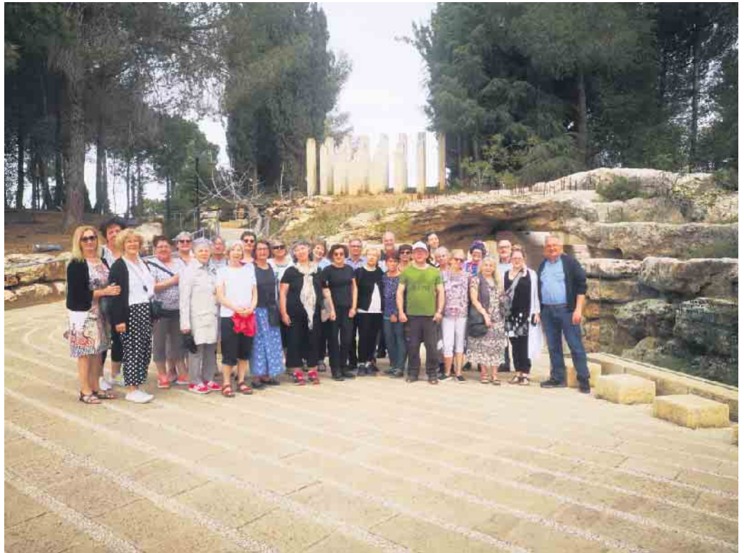
Reisegruppe vor dem „Denkmal für die Kinder in Yad Vashem“.

Weitere Höhepunkte waren zwei Wanderungen durch Wadis mit