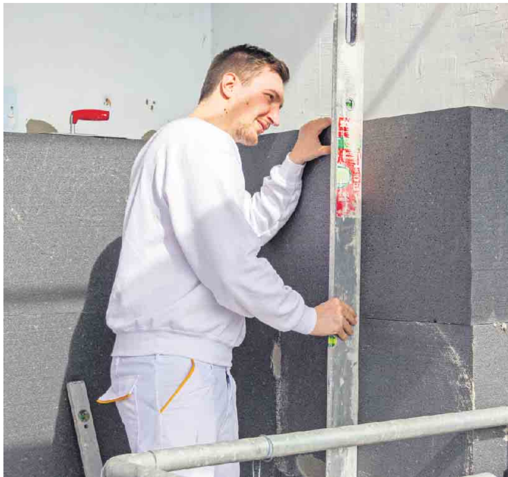
Dämmen durch den Profi: Die fachgerechte Ausführung stellt Langlebigkeit und Wirksamkeit des Wärmeschutzes sicher.

Als Voraussetzung für eine dauerhaft wirksame Dämmung gilt, dass