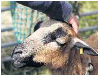
Das besondere Highlight bei der Veranstaltung „Tierkinder“ sind die Jungtiere der alten Haustierrassen.

Tierkinder & Bergischer Schäfertag im LVR-Freilichtmuseum Lindlar Sonntag, 14. Mai 2023, 10 bis 18 Uhr Information: 02234 9921-555, www.freilichtmuseum-lindlar.lvr.de