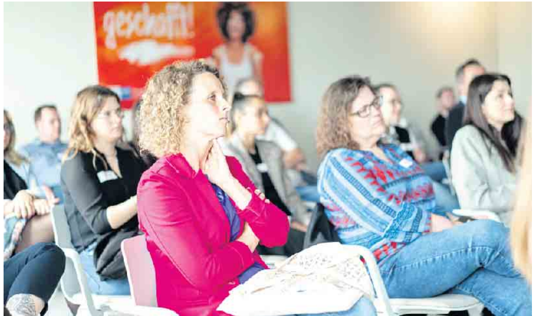
Das kompakte Blended-Learning-Konzept der Weiterbildung erfordert Eigenverantwortlichkeit und Disziplin. Dafür wird man mit Wissen belohnt.

Als Kursvoraussetzung müssen die Teilnehmenden eine einschlägige Berufspraxis nachweisen, deren Dauer von der Art ihres Aus-