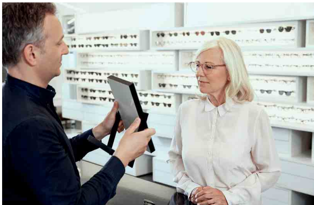
Für Gleitsichtgläser eignen sich alle Brillenfassungen, die auch für Einstärkengläser infrage kommen. Die unterschiedlichen Sehzonen im Glas sind unsichtbar.

Eine Gleitsichtbrille erlaubt stufenlos scharfes Sehen in allen Entfernungen. Oben im Glas liegt der Bereich für die Fernsicht, unten der Nahsichtbereich und in der Mitte ein Übergangsbereich, um zum Beispiel den Schreibtisch zu überblicken. Besonders Personen ab Mitte 40 profitieren von der vielseitigen Brille, denn dann setzt naturgemäß die sogenannte Altersichtigkeit (Presbyopie) ein. Je ausgeprägter sie ist, desto weiter müssen Zeitung, Buch, Tablet oder Smartphone für eine scharfe Sicht vom Auge weggehalten werden. Wer bisher keine Brille benötigte, kann auf eine Lesebrille zurückgreifen. Wenn man vorher bereits fehlsichtig war, häufig zwischen verschiedenen Sehabständen wechselt oder nicht ständig die Lesebrille auf- und absetzen möchte, ist die Gleitsichtbrille die optimale Lösung.