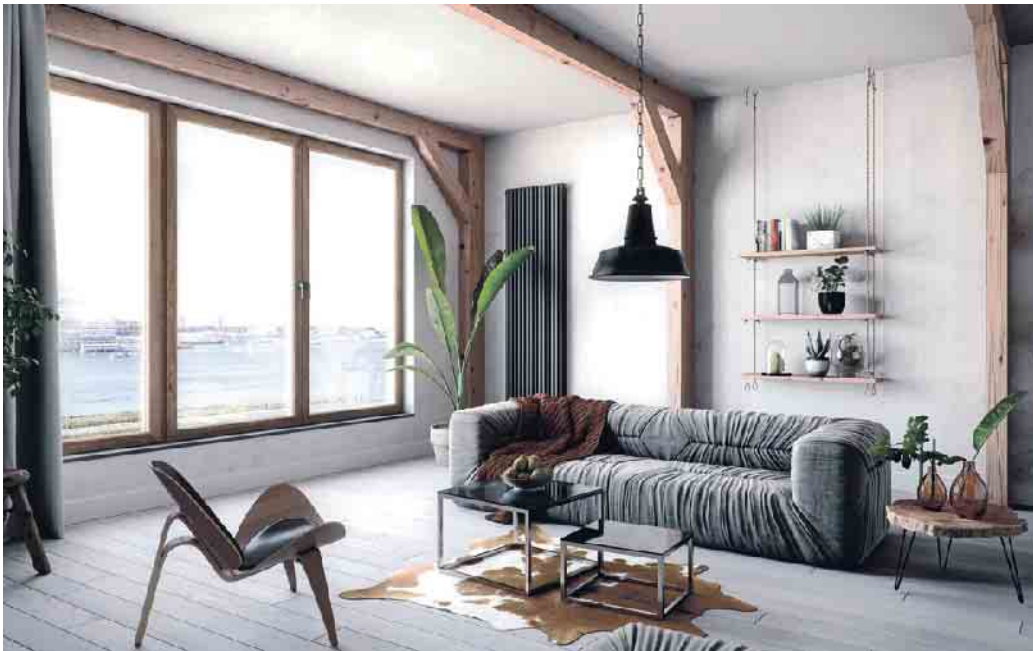
Eine energetisch optimierte Gebäudehülle mit Wärmedämmglas reduziert den Heizbedarf und auch die sommerliche Kühllast jedes Gebäudes.

Wer plant, sein Gebäude mit einer Wärmepumpe und Fotovoltaik nachhaltig mit Wärme, Kühlung und Strom zu versorgen, denkt umweltbewusst und wirtschaftlich. Vor der Wahl der passenden Wärmepumpe sollte jedoch die Dämmung der Gebäudehülle überprüft und optimiert werden, insbeson-