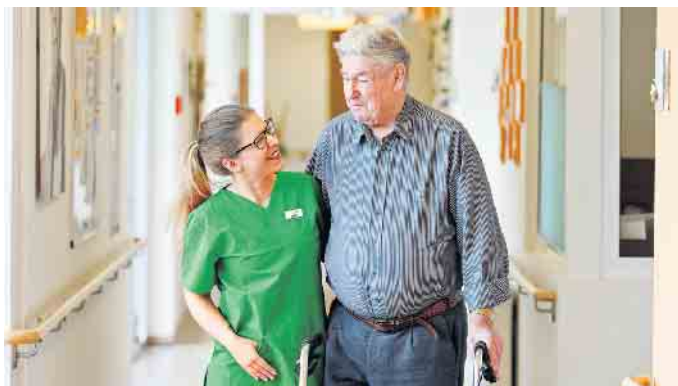
Altenpflege ist ein Beruf mit viel zwischenmenschlichem Kontakt, der sich auch familienfreundlich gestalten lässt.

denz. Sie verbringt weiterhin viel Zeit auf der Station, um den Kontakt zu den Senioren zu halten, während sie gleichzeitig die familiäre Atmosphäre fördert, die sie einst in die Pflege brachte. Denn letztlich entscheidend für die Berufswahl war für sie der Kontakt mit den Seniorinnen und Senioren. „Wichtig und extrem motivierend ist für mich der ständige Austausch mit den Bewohnern. Viele sind wegen ihrer Lebenserfahrung ein Vorbild für mich und geben mir täglich sehr viel.“ (DJD)