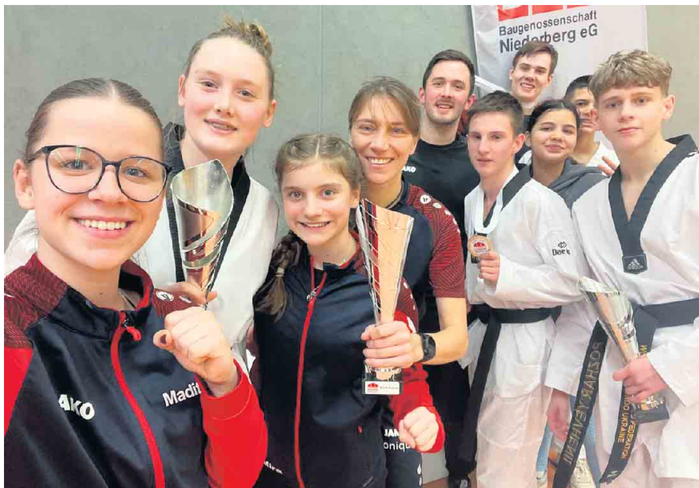
Teambild Bericht auf Seite 2