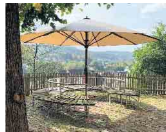
Großschirme für das Heimatmuseum Bergneustadt.

(Dieser Projektaufruf startet unter dem Vorbehalt der Zurverfügungstellung von Fördermitteln durch das Ministerium MLV.)