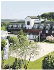
Beispiel DZ Comfort