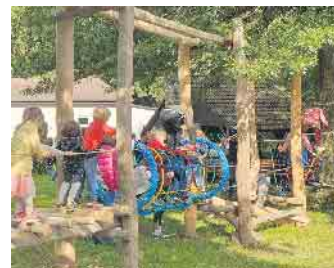
Kletterlandschaft Wallefeld, Ausschnitt.

Für sämtliche Fragen rund um die Kleinprojekte steht das Regionalmanagement gerne zur Verfügung.