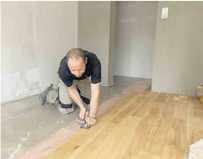
Ein Profi klebt die Eichendielen vollflächig auf den Untergrund. Das sichert eine gute Wärmeübertragung durch die Fußbodenheizung und sorgt für einen niedrigen Trittschall. Der eingesetzte Klebstoff trägt das Emissioncode-Zeichen EC 1. Dieses Siegel gewährleistet geringste Emissionen und schont die Gesundheit der Verarbeiter und Bewohner.

Parkett aus heimischen Hölzern kann als Massivparkett oder Mehr- schichtparkett verlegt werden. In letzterem Fall besteht die Deck- schicht aus Holz, darunter befin- den sich Holz oder Holzwerkstof- fe. Die einzelnen Schichten wer- den verleimt. Ein Vorteil von Mehr- schichtenparkett kommt bei der Verbindung mit einer Fußboden- heizung zum Tragen. Dank der geringen Aufbauhöhe leitet die- ser Boden die Wärme rascher wei- ter als Massivparkett, das sich jedoch grundsätzlich ebenfalls für eine Fußbodenheizung gut eignet. Die Vorzüge der Kombination Par- kett und Fußbodenheizung kom- men dann zur Geltung, wenn der Bodenbelag vollflächig auf den Untergrund geklebt ist. Diese Ar- beit sollte ein Profi erledigen. Er prüft zunächst den Untergrund und bereitet ihn bei Bedarf fach- gerecht auf, bevor er das Parkett vollflächig klebt und verlegt. Die feste Verbindung zwischen Unter- grund und Bodenbelag hat noch einen weiteren wichtigen Vorteil: Sie verhindert die Bildung von Luft- polstern und sorgt so für deutlich geringeren Raum- und Trittschall. Wichtig für die Bewohnerinnen und Bewohner: Sie sollten darauf achten, dass der von Ihnen beauf- tragte Fachmann einen Klebstoff benutzt, der das Emissioncode-Zeichen