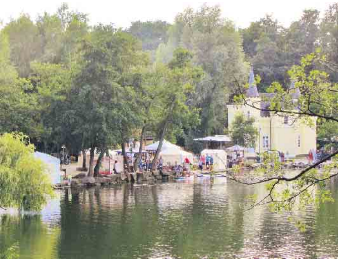
Eindrücke vom Handwerkermarkt beim Seefest zur Blauen Stunde am Ufer des Hariksees zwischen Inselschlösschen und Golfanlage.

Schwalmtal (fjc). Ein Seefest zur „Blauen Stunde“ war schon seit zwei Jahren am Hariksee vorgesehen, nun konnte es endlich stattfinden. Corona hatte hier bisher die Planung über den Haufen geworfen. Die Rahmenbedingungen stimmten, das Wetter spielte bestens mit, und so strömten denn am Sonntag, 21. August, tausende Menschen von allen Seiten zum Hariksee. Viele folgten auch dem Rat der Veranstalter und waren mit dem Fahrrad oder zu Fuß gekommen. Der Bereich entlang des Seeweges vom Schlösschen bis zur Minigolfanlage war mit Buden dicht besetzt. Gut 50 Aussteller boten ihre Waren an, wobei Wert auf handwerkliche Kreativität und regionale Anbieter gelegt wurde. Das breit