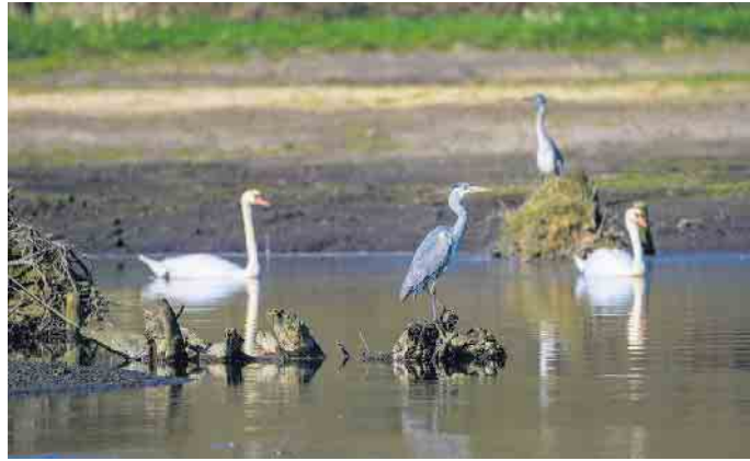
Viele Vögel haben sich angesiedelt wie die Graureiher und Schwäne

Insgesamt hat der Niersverband den ursprünglich geradlinig und kanalartig verlaufenden 700 Meter langen Flussabschnitt in den letzten drei Jahren zu einem rund 1,6 Kilometer langen, geschwungenen und mehrfach verzweigten Flusslauf umgebaut. Der Kreis Viersen stellte dem Wasserverband für diese Renaturierungsmaßnahme einen Teil der Flächen zur Verfügung. Der Niersverband übernimmt