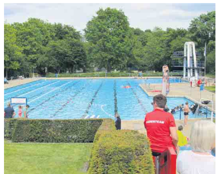
Die Mehrheit der Niederkrüchter sprach sich für die Sanierung des Freibades aus, hier ein Archivbild aus dem Jahr 2017.