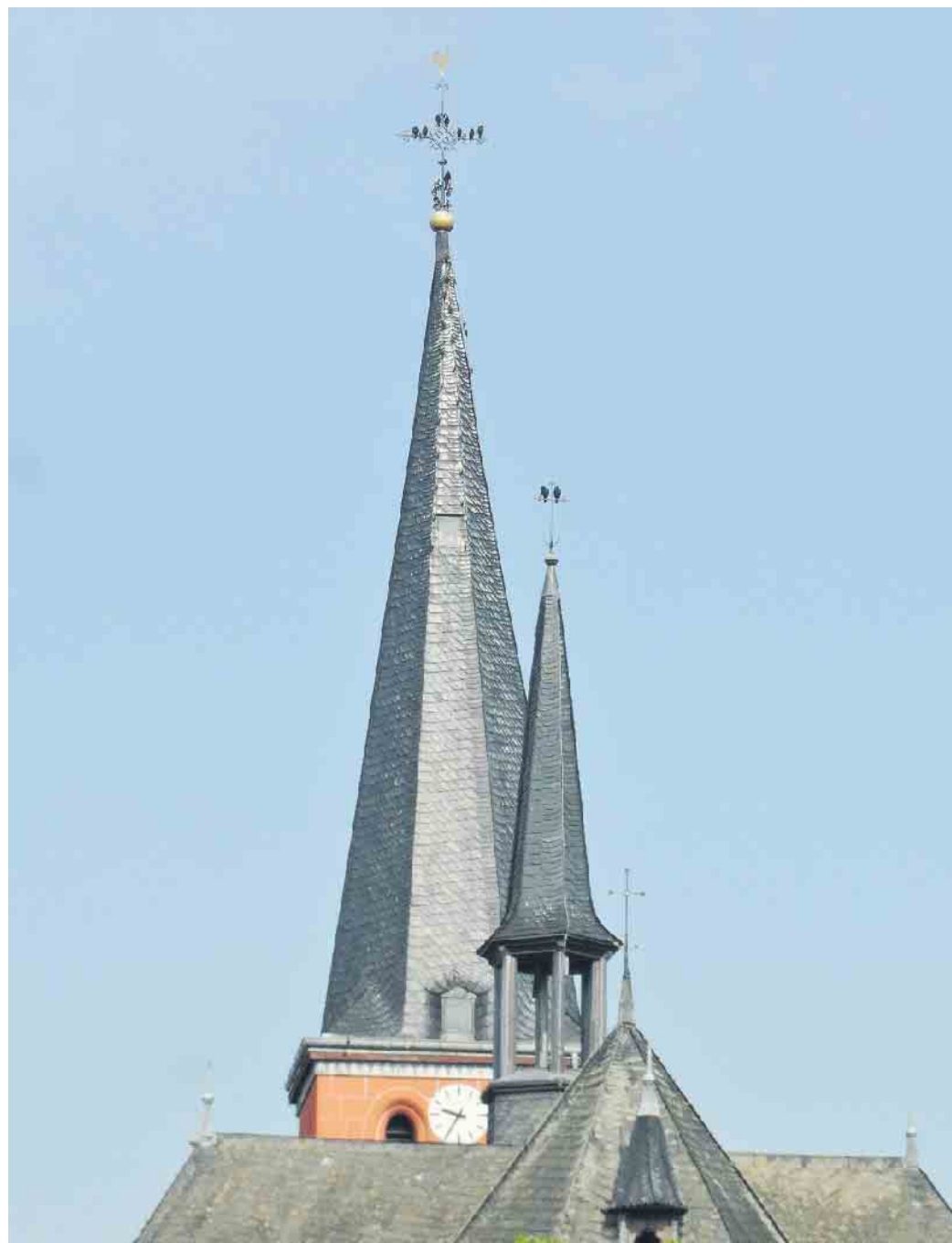
Spitzengespräche auf hohem Niveau, beobachtet an der Kirche Dilkraht.