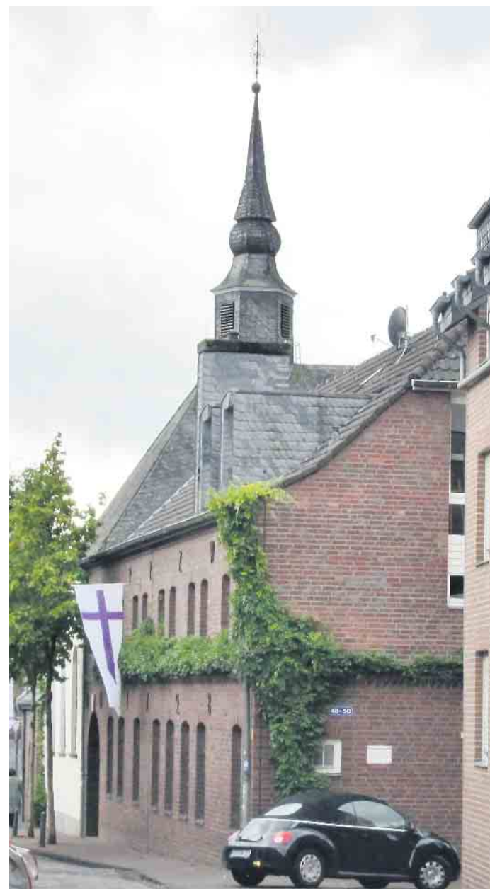
Die evangelische Gemeinde Waldniel lädt zum Sommerfest an die Lange Straße ein.

Sollte es wider Erwarten regnen, ist man auch darauf