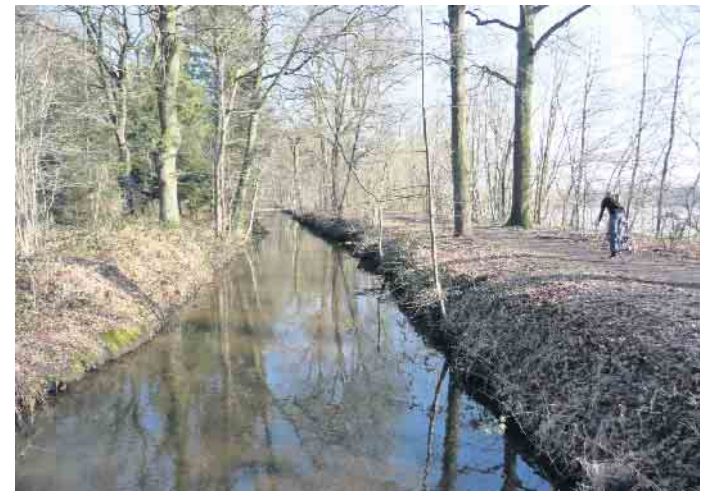
Beliebt: Wanderrwege entlang von Seen und Flüssen

raum. Die deutsch-niederländische Kooperation klappe gut, sagt Claassen, der auf einen Erfahrungsaustausch verweist, den es zum Beispiel in gemeinsamen Seminaren gibt. Dabei werden Kenntnisse ausgetauscht, wie man Natur und Landschaft schützen und weiter entwickeln kann. Er macht als Beispiel der Quelljungfer, einer seltenen Libellenart, deutlich, deren Fortpflanzungshabitat von Experten aus beiden Ländern untersucht und erforscht wird. Man plant dabei auch, die Gebiete beiderseits der Grenze so zu vernetzen, dass seltene Arten wie die Libellen noch besseren und größeren Lebensraum finden können. Nur ein Beispiel für viele, was man alles tun kann, um Fauna und Flora zu verbessern. Besucher schätzen Wasserwanderwege: Der Internationale Naturpark