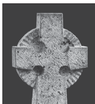
MANFRED MANGOLD Steinmetz und Bildhauer

vorbereitet, das Sommerfest soll dennoch stattfinden und für alle frohe Tage der Begegnung bieten.