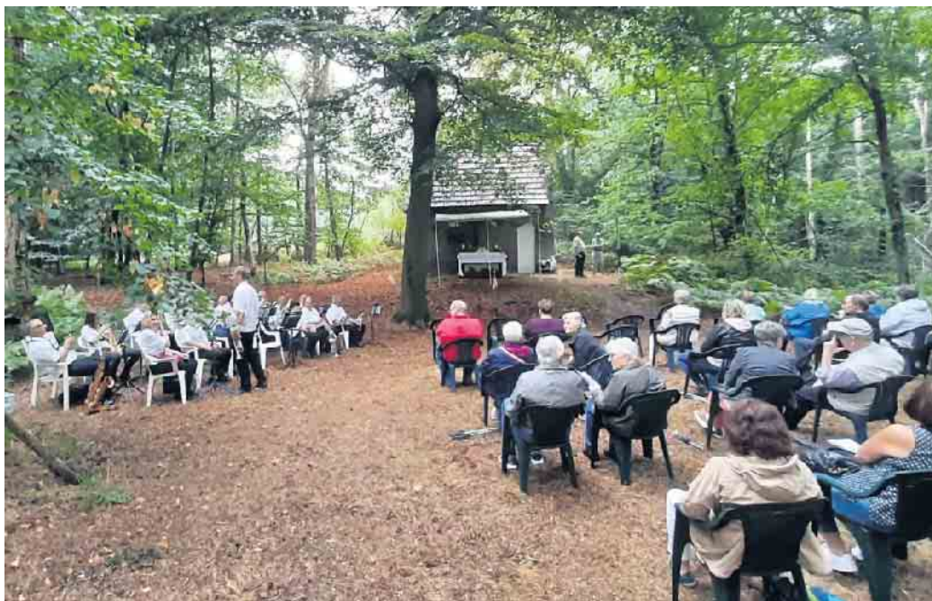
Mit starker musikalischer Unterstützung wurde am Samstag eine humorvolle Rochusmesse gefeiert.

Hinsbeck (hk). Auch in diesem Jahr war die beliebte Rochusmesse in der Nähe von Schloss Krickenbeck, die jeweils am Samstag nach dem Rochusfest, dem 16. August, gefeiert wird, wieder gut besucht. Die romantische Lage mitten im Wald spricht alle Christen, ob Katholisch oder Evangelisch, an. Die auf einer Anhöhe stehende, erstmals 1688 erwähnte Kapelle mit dem davor unter einem Lichtsegel stehenden Altar und der rund 300 Jahre alten Statue des Hl. Rochus, davor in einer Vertiefung die Besucher, alles umgeben von großen, alten Bäumen, ist einfach bezaubernd. Mehr