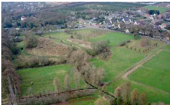
Die Fläche, die der Niersverband nutzen möchte, befindet sich am rechten Bildrand

Grundlage für diese Maßnahme ist eine Vorgabe der Bezirksregierung in Düsseldorf. Die Planung sieht den Bau eines Retentionsbodenfilters in der Nähe der Niersverbands-Betriebsstelle am Quellensee, östlich der Lindenallee im Stadtteil Breyell vor. Zur Errichtung eines derartigen Bodenfilters wird in der Regel der bestehende Boden beckenartig abgetragen und