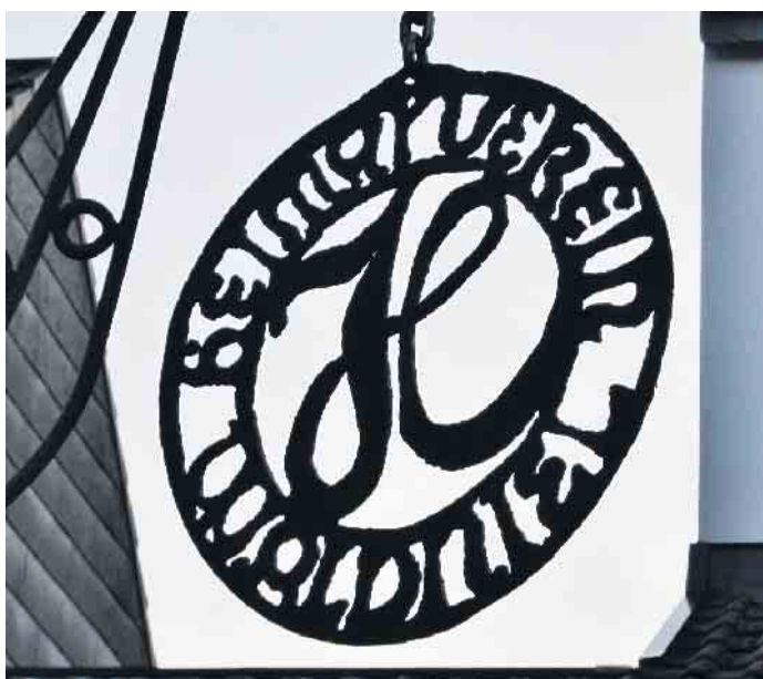
Der Heimatverein lädt zum Mundartnachmittag in „Neller Plott“ ein.

Der Besuch dieser Veranstaltung ist kostenlos. Bei Regenwetter muss die