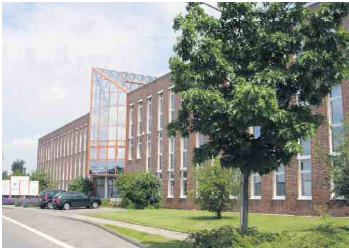
Technologiezentrum: Aktuelle Veranstaltungen und Förderung von Gründungen