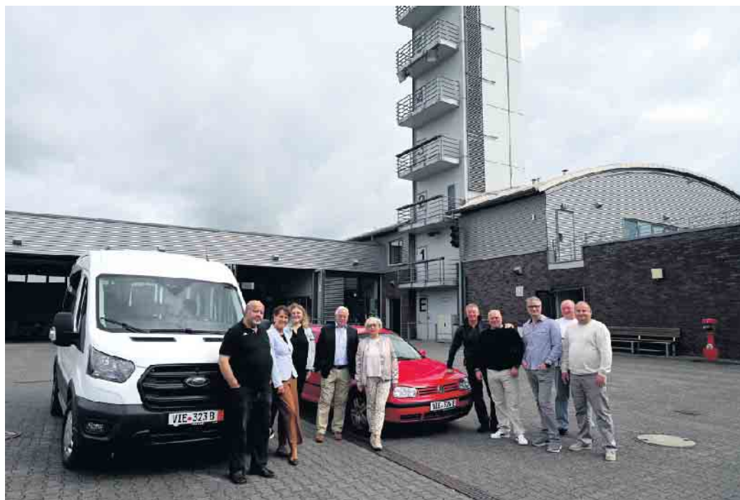
Es zeigt Vertreterinnen und Vertreter der Stadt Viersen, des Vereins „Freunde von Kanew“ und der Stadt Kanew bei der Fahrzeugübergabe in der Hauptfeuerwache Viersen.