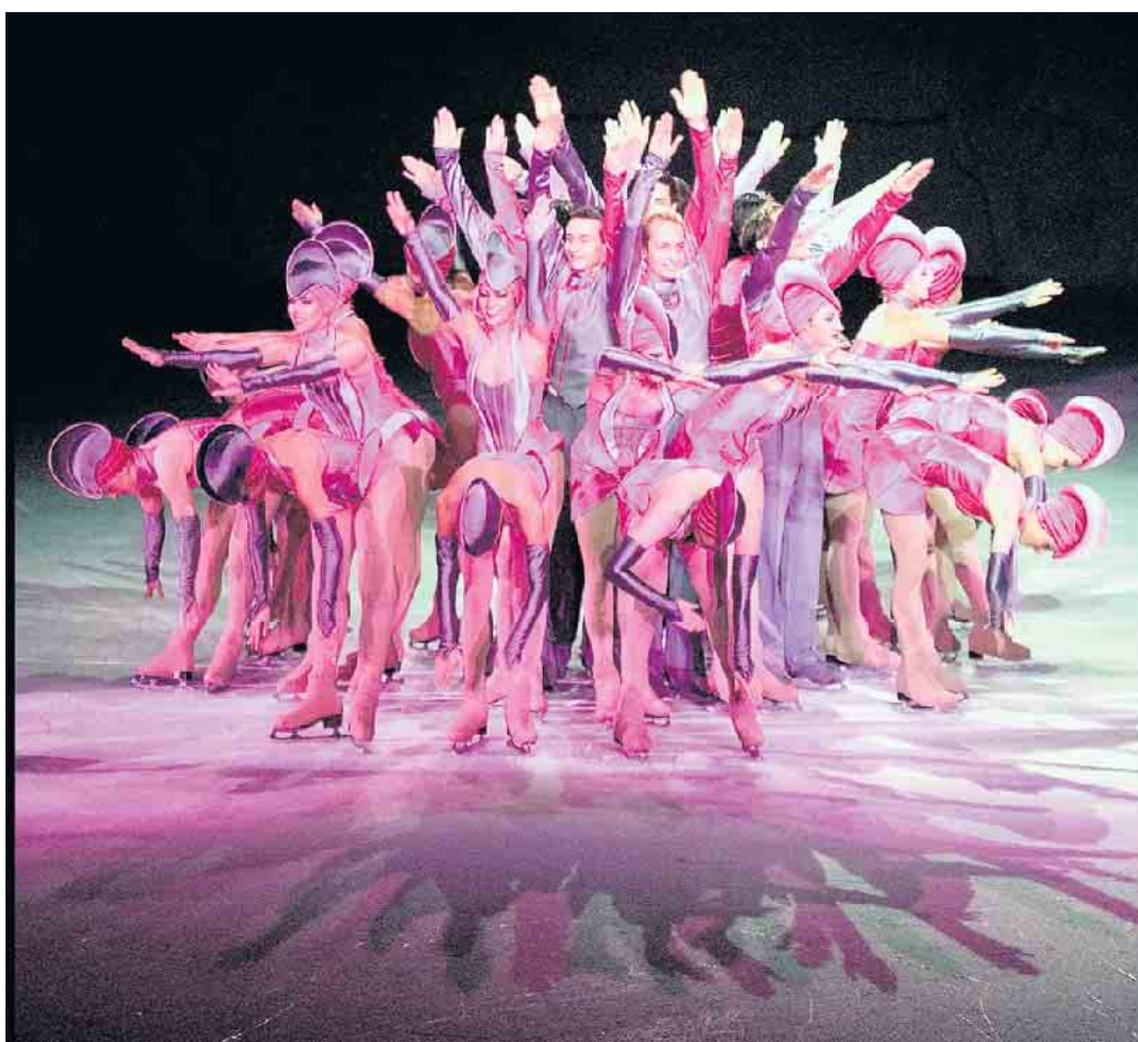
So bunt sind die Shows von Holiday on Ice

Limits vom 15. bis 19. November in Grefrath, Karten gibt es ab sofort für 31,90 Euro an den bekannten Vorverkaufsstellen und im Grefrather Eis-