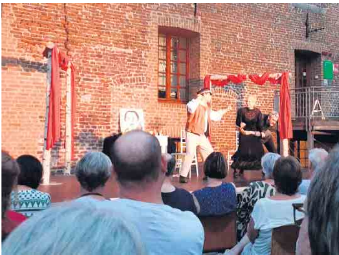
Das Niederrheintheater Brüggen freut sich nach einer gelungenen Saison auf die Vorstellungen im nächsten Jahr 2024.

Brüggen (fjc). Überglücklich zeigen sich die Verantwortlichen der 13. Niederrheinischen Theaterfestspiele in Brüggen. Die Aufführungen waren ein voller Erfolg! Bei einer beeindruckenden Auslastung von 100 Prozent und sechs erfolgreichen Vorstellungen vor der imposanten Kulisse der Burg Brüggen war das Publikum begeistert. Anton Tschechow und seine drei Komödien haben die Besucher in eine Welt voller Lachen und Emotionen entführt. Das ermutigt für die Zukunft: