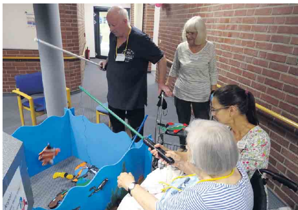
Konzentriert und erfreut beim Gewinn waren die Bewohner*innen bei den Spielen, hier das Angelspiel.