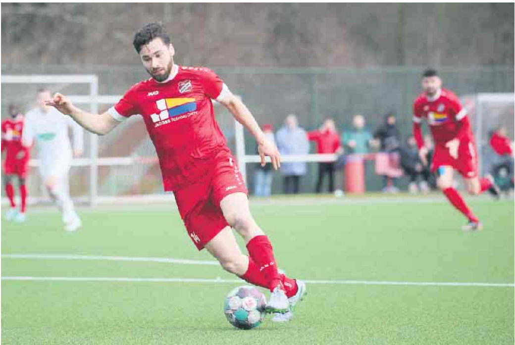
Auch die VSF Amern konnten keine Punkte einfahren.