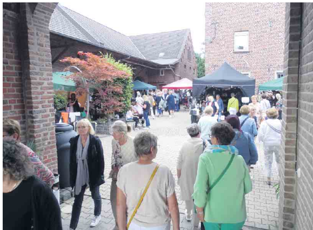
Einen riesigen Zulauf erlebt Haus Milbeck am vergangenen Freitag beim vierten Ladies Day.

Haare stylen oder eine Fuß-Reflexmassage durchführen lassen. „Erfrischend und belebend“, meinte eine Dame nach der Massage. „Das sollte man sich öfter gönnen.“ Auch der große Schmuck- sowie der Modebereich waren stets umlagert. Mit diesem Event hat das Duo Pickers/Köhnen anscheinend eine Marktlücke getroffen. Die Zahl der männlichen Besucher war an den Händen abzählbar. „Der Mann tut mir leid“, hörten diese des Öfteren, wenn sie sich durch die Menge der Damen drängelten. Die meisten schienen sich dabei auch nicht besonders wohlzufühlen. Dass es auch ein anderes Leben mit großen Problemen gibt, auch daran denken die beiden Organisatoren. Daher wird neben den Verkaufsständen auch stets eine Tombola zur Unterstützung sozialer Gruppen