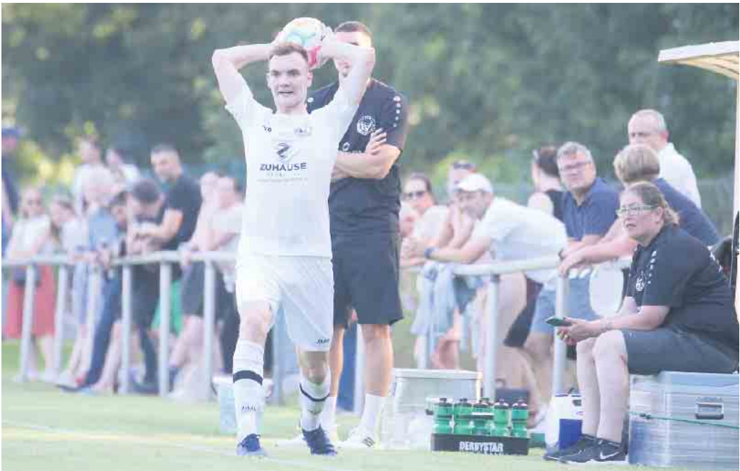
Keine Punkte gab es für DJK Fortuna Dilkcrath im ersten Spiel der Saison.

zum 1:2-Anschluss traf, stellte Amin Azdouffal (75.) postwendend nach einer Standardsituation den alten Abstand wieder her und erzielte das 1:3. Im Schlussabschnitt hatten die Dilkcrather gleich mehrfach die Möglichkeit den erneuten Anschlusstreffer zu erzielen. Doch es blieb am Ende beim 1:3 für die Mannschaft aus Holzheim. „Wir haben heute ein richtig gutes Spiel gemacht. Ich bin mit der ersten Halbzeit nicht zufrieden. Die zweite Halbzeit war aber deutlich besser. Auf die Leistung können wir aufbauen“, resümiert Wiegers.