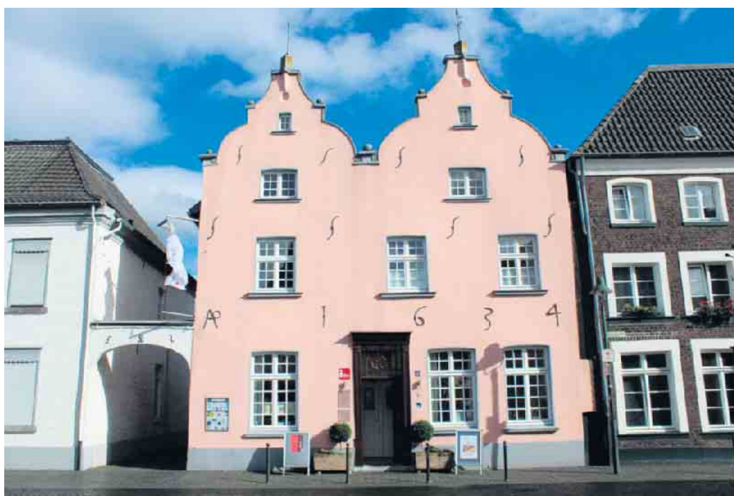
Haus Püllen: Hier ist viel Wissenswertes zu erfahren

Erlernte außerdem noch spielerisch zu festigen. Der weitergehende Service des Naturparks in seinem nördlichsten Informationszentrum des Naturparkgebietes umfasst zudem noch die Beratung und Vorbereitung von Unterrichtsgängen und Klassenfahrten, wertvolle Tipps für Wanderungen, Rad- und Kanutouren, Karten- und Informationsmaterial und einen Naturparkfilm. Der schöne Bauerngarten im Gelände von Haus Püllen und die Obstwiese bieten mit ihrer Tier- und Pflanzenvielfalt ein Erlebnis für alle Sinne und können während der Öffnungszeiten auf eigene Faust oder im Rahmen einer Führung erkundet werden. Die Öffnungszeiten kann man erfahren unter www.npsn.de . Der Bienenstock nebst Modellen, Lehrtafeln und Schaukasten lädt dazu ein, das geheime Leben der Bienen zu entdecken, nach