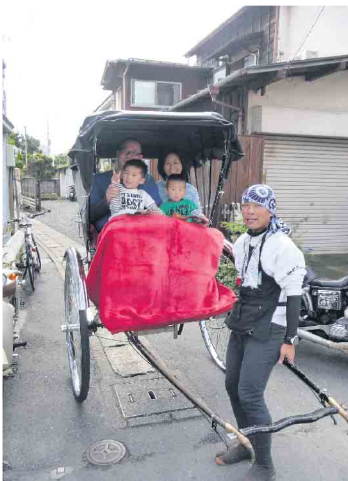
Die Idee der Rikschas kennt man aus Asien, wie hier in Japan

Realisiert wurde das Projekt von der Diakonie in Kooperation mit der Evangelischen Kirchengemeinde Dülken. Der Dienst kann kostenlos in Anspruch genommen werden. Auch die Stiftung Theresenheim für Bürger in Dülken, die Matthias Schmitz Stiftung Dülken und der Rotary Club