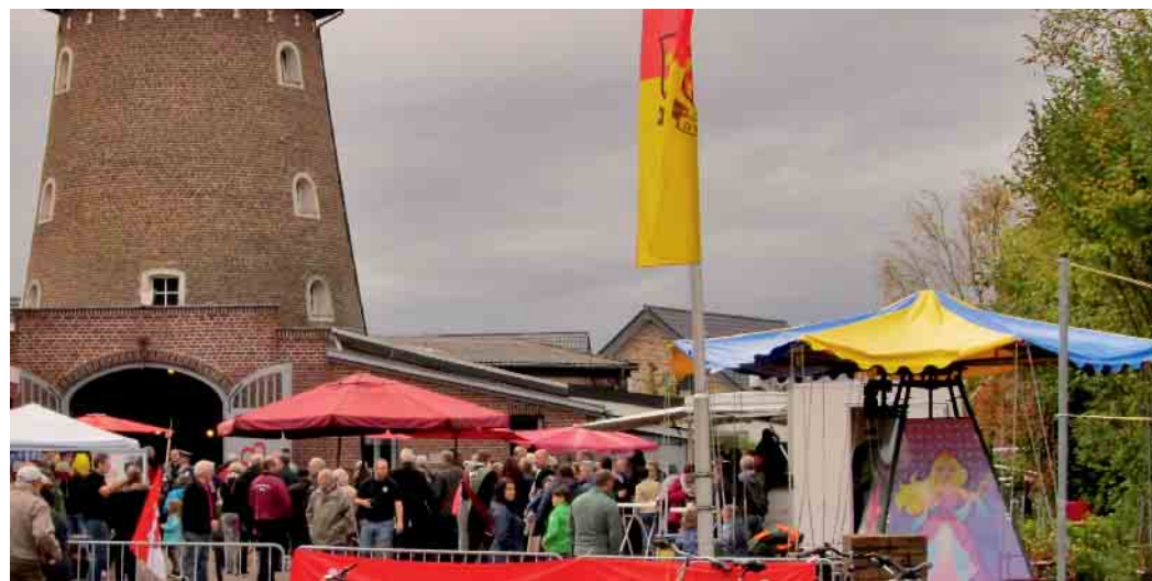
An der Brachter Mühle steigt am Freitag die Ferienabschlussparty.