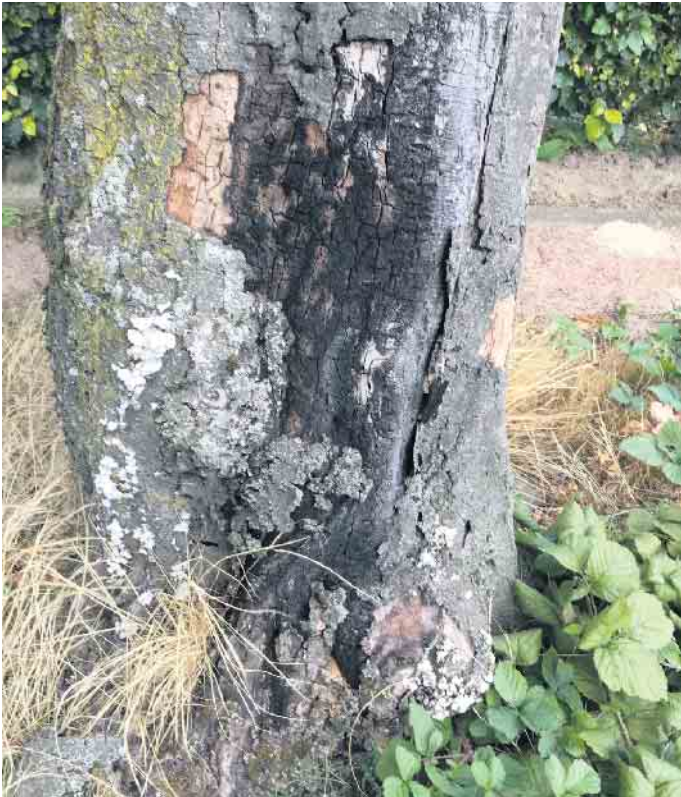
Hainbuche auf der Johann-Finken-Straße.

Nettetal. An der Johann-Finken-Straße in Leuth ist eine ältere Hainbuche weitgehend abgestorben. Die Krone des Baumes ist eingetrocknet. Am Stammfuß liegen weitreichende Holzschädigungen vor. Eine Fällung soll zeitnah erfolgen, um die Verkehrssicherheit sicherzustellen. Eine Nachpflanzung ist an Ort und Stelle aufgrund der beengten räumlichen Verhältnisse im Bürgersteig leider nicht möglich. Auf der gegenüberliegenden Straßenseite gibt es allerdings umfangreiche andere städtische Begrünungen mit Bäumen. Die Stadt Nettetal wird ab November in diesem Jahr noch mehr als 225 Bäume im gesamten Stadtgebiet neu- und nachpflanzen. Damit soll ein deutliches Zeichen zur Klimaanpassung und CO2-Bindung gesetzt werden. Berücksichtigt werden aber auch