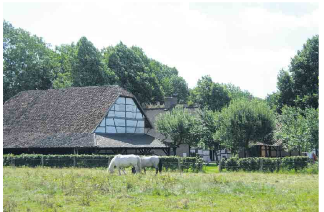
Die Hofanlage Waldniel im Museumsgelände

September mehrere hundert historische Traktoren das Niederrheinische Freilichtmuseum besuchen und zum beliebten „Treckertreff“ zusammenkommen. Ab 11 Uhr rollen die Gefährte durch den Ort bei einem sehenswerten Corso. Treffpunkt dafür ist der Parkplatz am Eissport & EventPark in Grefrath. Anschließend ziehen die stählernen Oldtimer ins Museumsgelände ein und präsentieren sich dem Publikum. Dabei ist dann auch für das kulinarische Wohl gesorgt. Und leckere Pfannkuchen gibt es in der alten Posthalterei aus Willich, dem „Pannekookehuus“, ja auch noch.