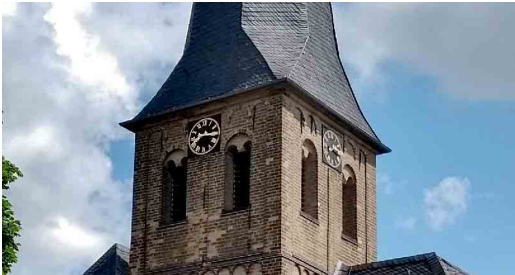
Glockenstube des romanischen Kirchturms von St.Laurentius, Grefrath.

Schlusssegen dort. Die Gemeinde St. Gertrud Dilkraht pilgert vom 22. bis 24. September nach Kevelaer. Anmeldungen bei Henning Anstötz, Telefon 0162/6942085. In den Sommerferien bleibt das Pfarrbüro an den Nachmittagen geschlossen. Geöffnet ist Montag, Dienstag, Donnerstag und Freitag von 9.30 Uhr bis 12 Uhr. Sprechzeiten mit Pfarrer Johannes Quadflieg können vereinbart werden unter Telefon 94540. Das gemeinsame Pfarrfest von und für ganz St. Matthias Schwalmtal findet am Sonntag, 13. August, statt, beginnend mit einer gemeinsamen Messfeier um 11 Uhr an St. Anton Amern. Weitere Informationen und Angebote findet man unter www.sankt-matthias-schwalmtal.de .