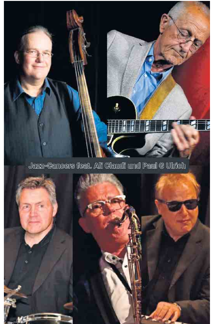
Der „Brüggener Sommer“ präsentiert am 13. August ein Jazz-Konzert im Innenhof der Brüggener Burg.