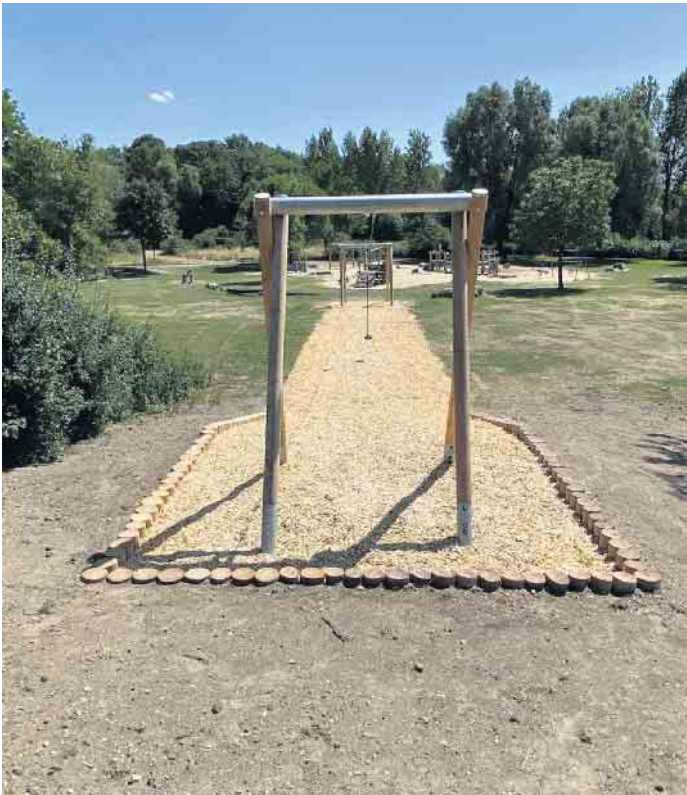
Seilbahn Spielplatz Windmühlenbruch.

werden. Mittlerweile bietet das neue Gerät schon wieder Kletterspaß für Klein und Groß. Die Arbeiten wurden durch den städtischen Baubetriebshof in Kooperation mit den Lieferfirmen der Spielgeräte ausgeführt. insgesamt 60 Kinderspielplätze im Stadtgebiet sowie die Spielanlagen an Schulen, Kindergärten und im Außenbereich der offenen Ganztagschulen.