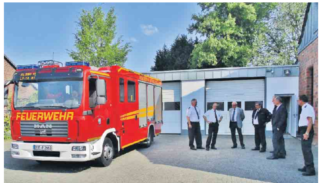
Der Löschzug Hehler feiert das 100-jährige Bestehen, hier ein Archivbild von 2018 vor dem dortigen Gerätehaus.