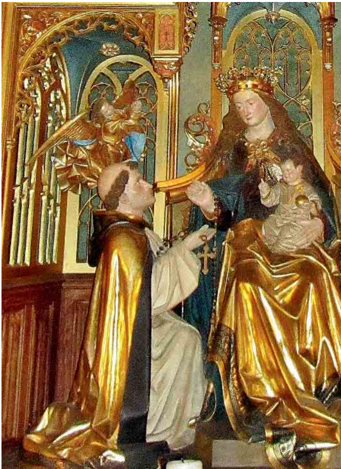
Der heilige Dominikus (Fest am 8. August) empfängt den Rosenkranz. Detail aus dem Marienaltar in St. Michael, Waldniel (Werkstatt Langenberg 1898).

18.30 Uhr - hl. Messe St. Gertrud Dilkraht. Sonntag, 6. August 9.30 Uhr - Gottesdienst in englischer Sprache in St. Mariä Himmelfahrt, Waldnieler Heide 11 Uhr - hl. Messe in St. Michael Waldniel, 12.15 Uhr - Tauffeier St. Georg Amern 18 Uhr - Schlusssegen der Kevelaerpilger in St. Georg Amern 19 Uhr - Wortgottesdienst in St. Anton Amern (Grabeskirche). Montag, 7. August 8 Uhr - Einschulungsgottesdienst Realschule St. Michael 10 Uhr - Einschulungsgottesdienst Gymnasium St. Michael