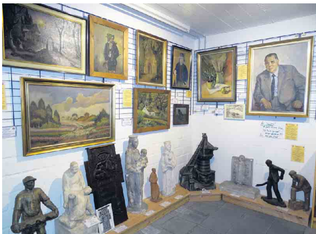
Einen Kunstbereich mit Werken fast aller in Hinsbeck tätig gewesenen Künstler zeigt das Dorfmuseum des VVV Hinsbeck.

Hinsbeck (hk). Am ersten Sonntag im Monat, jetzt der 6. August, öffnet das Dorfmuseum des VVV Hinsbeck (unter der Hinsbecker Turnhalle) wieder von 11 bis 17 Uhr seine Türen. Interessierte können sich über die Geschichte des Ortes, der Hinsbecker Vereine, der Kirche und der Gemeinde informieren. Daneben gibt es eine Künstlerecke mit Werken von (fast allen) Hinsbecker Künstlern. Einen großen Bereich nimmt das Wohnen in den 30iger Jahren ein, zu dem nun auch die Feuchtbereiche wie Badezimmer und Waschküche gehören. In einer Sonderausstellung werden daneben alle Hinsbecker Karnevalsvereine sowie Vereine und Nachbarschaften, die über viele Jahre