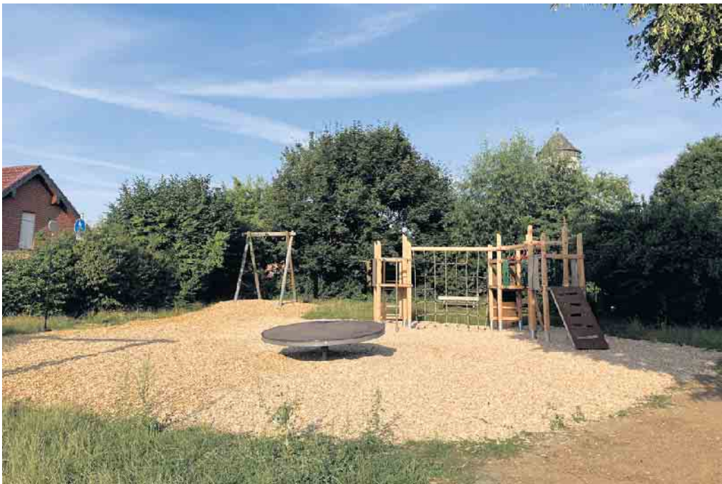
Klettergerät Spielplatz Wasserturm.

bruch musste Anfang des Jahres außer Betrieb genommen werden, da das ca. 20 Jahre alte Gerät abgängig war. Nun wurde eine neue Seilbahn installiert. Auch das neue Gerät besteht wieder aus Holz, um den natürlichen Charakter der Anlage in unmittelbarer Seenähe zu erhalten. Die Oberbalken sind jedoch aus Stahl gefertigt, sodass die Seilbahn den Kindern über einen längeren Zeitraum Spiel und Spaß ermöglichen soll. Im Zuge der Arbeiten wurde auch der Fallschutz erneuert sowie der anfallende Aushub zur Geländegestaltung harmonisch eingearbeitet. Am Kinderspielplatz am Wasserturm war die Ausgangslage ähnlich. Auch hier musste das ursprünglich vorhandenen Gerät wegen Fäulnisschäden nach ca. 20 Jahren ersetzt