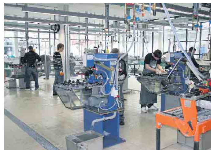
Ausbildung in der Flachglasindustrie.

Als dualer Studiengang angelegt, bietet die Ausbildung zum Wirtschaftsingenieur