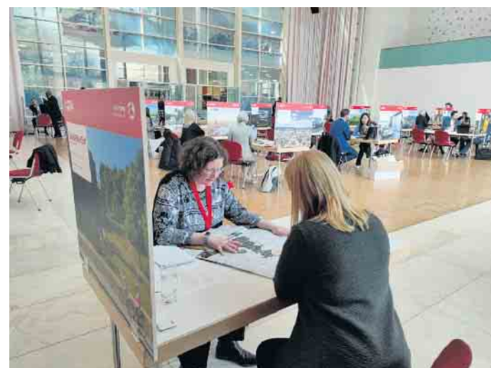
Internationale Kontakte wurden auf der Messe geknüpft