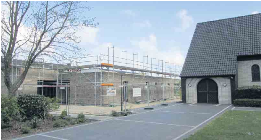
Der Neubau der Begegnungsstätte - die Gerüste dürften inzwischen gefallen sein - neben der Kirche in Lüttelbracht-Genholt wird am Sonntag eingeweiht.