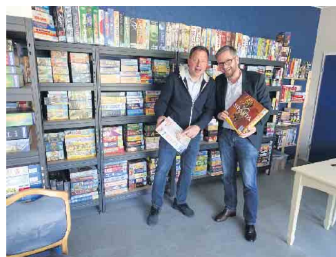
Regale voller Brett-, Würfel- und Kartenspiele warten auf interessierte Besucher*innen.

In Hinsbeck wird der VVV Hinsbeck am 14. Juni im Spielecafé als Nachfolger des eingestellten Mundartkreises „Hänsbäcker Jüüte vertälle“ einen Abend unter dem Namen „Jüüte slamen“ starten, eine Mischung aus Gedichtabend und Poetry Slam. Poetry Slam wurde in den 1980er Jahren in den USA entwickelt und kann als Dichterwettbewerb übersetzt werden. Es werden bekannte Texte und Gedichte zum Tragen kommen, zum Beispiel von Wilhelm Busch über Heinz Erhard bis Ernst Jandl, aber auch eigene Texte werden vorgestellt. Im Sinne der Vorgänger-Veranstaltung sollen auch Texte auf „Hänsbäcker Plott“ und von Hinsbecker Künstlern vorgetragen werden. Neben