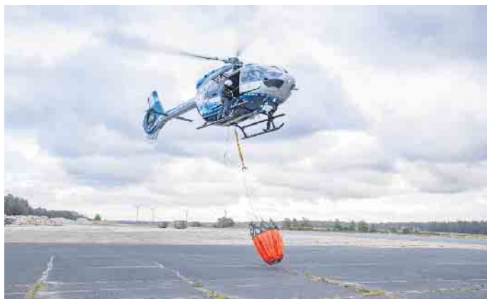
Mit den „Bumbi Buckets“ gegen den Waldbrand.

Resultat sind zwei mobile Löschwasserbehälter als wasserdichter Container, der rund 36 Kubikmeter Löschwasser aufnehmen kann und so konzipiert ist, dass die Polizeihubschrauber hindernisfrei mit den „Bumbi Buckets“ eintauchen können, um Löschwasser zu entnehmen. „Die Löschwasserbehälter sind mobil mit Standard-Wechseladerfahrzeugen nah an Brandstellen abzusetzen. Befüllt werden sie entweder mit Feuerwehrfahrzeugen oder mit Transportbehältern von Landwirten, Lohnunternehmern oder Expeditionen aus dem Kreisgebiet, die mit den