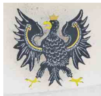
In Hehler kann auf den Vogel geschossen werden.

der Rickelrather Straße einiges los sein. Wer möchte, kann versuchen, hier „König für einen Tag“ zu werden. Für die Kinder stehen verschiedene Attraktionen bereit, für Speis und Trank ist bestens gesorgt.