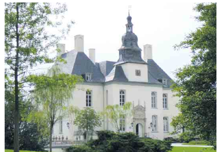
Schönes Radelziel: Schloss Gartrop

einer ganz anderen wieder zurückgegeben werden. Das erleichtert die Tourenplanung am Niederrhein ganz erheblich. Man kann die Räder sowohl telefonisch wie auch online mieten. Das Familienunternehmen der Teppers ist vom