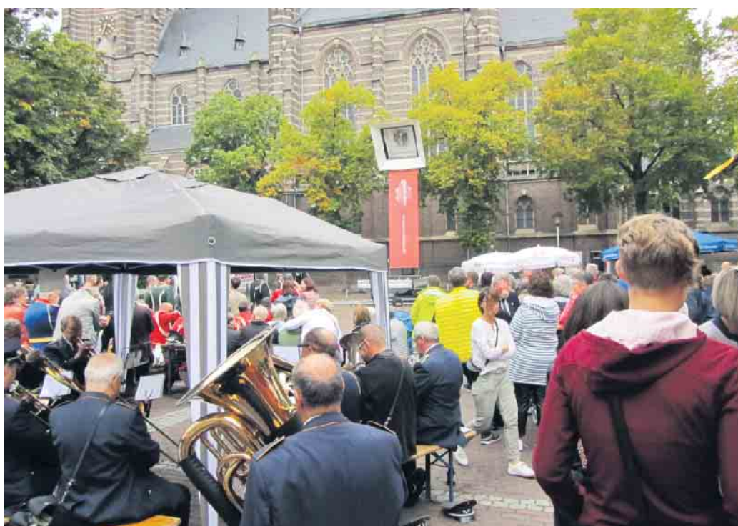
Zum Bezirksschützenfest wird am 13. Mai nach Waldniel eingeladen, wo vor der Kulisse des Schwalmthaldomes die neuen Majestäten ausgeschossen werden.

schwenkermeisterschaften in der Turnhalle Dülkener Straße. Zeitgleich wird das Bezirks-Pokalschießen auf dem Schießstand der Vereinigten Bruderschaften Waldniel ausgetragen (St. Michael-Straße). Um 11 Uhr startet auf dem Parkplatz neben dem Schwalmthaldom das Bezirks-Bambiniprinzenschießen. Um 12.45 Uhr gibt auf dem Parkplatz eine kurze Andacht, danach um 13 Uhr folgt das Bezirks-Schülerprinzenschießen und um 14.30 Uhr wird der Bezirksprinz ausgeschossen. Den Abschluss bildet dann um 15.30 Uhr auf dem Parkplatz das Ausschießen des Bezirkskönigs. Gegen 16.30 Uhr gibt es