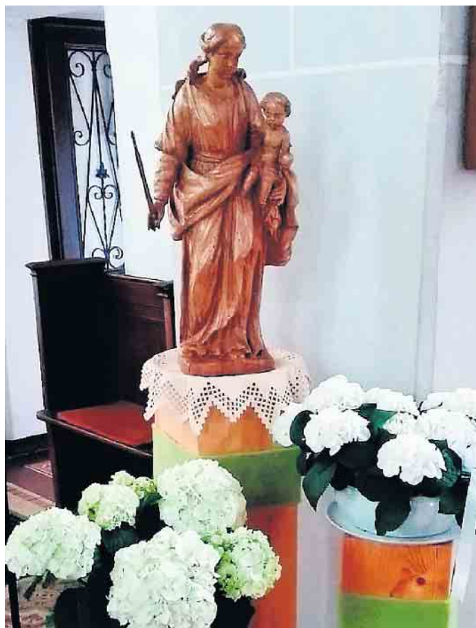
Maialtar in St. Gertrud Dilkraht.

Donnerstag, 18. Mai (Fest Christi Himmelfahrt),