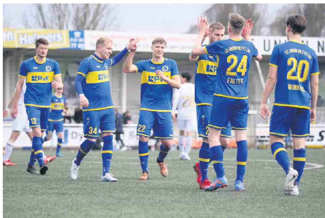
Der SC Union Nettetal feierte einen wichtigen Auswärtssieg.