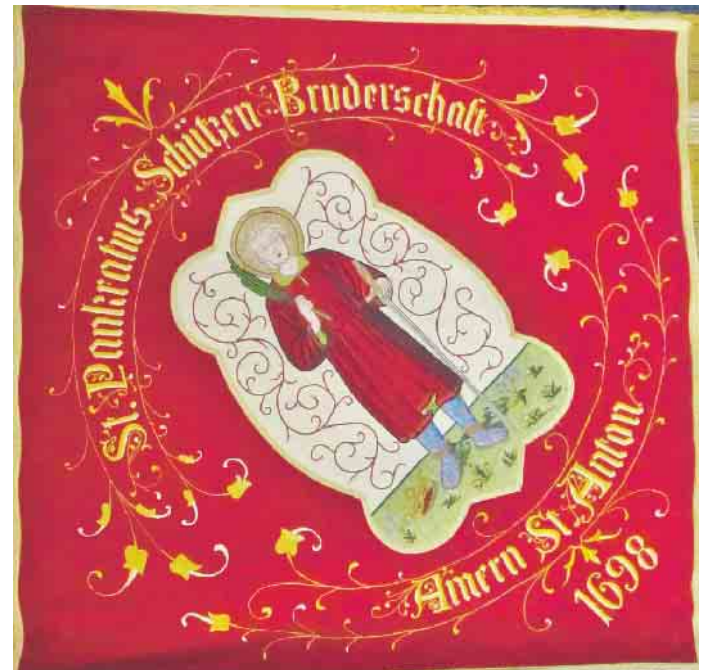
Schützenfahne mit dem Bild des heiligen Pankratius in Unteramern, geweiht 2008 in Rom.

Schwalmtal (fjc). Von den insgesamt zwölf Schützenbruderschaften in Schwalmtal können zwei in diesen Tagen ihren „Namenstag“ feiern. Am 12. Mai ist der Gedenktag des heiligen Pankratius, am 16. Mai der des heiligen Johannes von Nepomuk. Den heiligen Pankratius haben sich die Schützen aus Unteramern zum Patron gewählt. Er starb als Märtyrer für den Glauben im jugendlichen Alter von 14 Jahren 304 in Rom. Die 1698