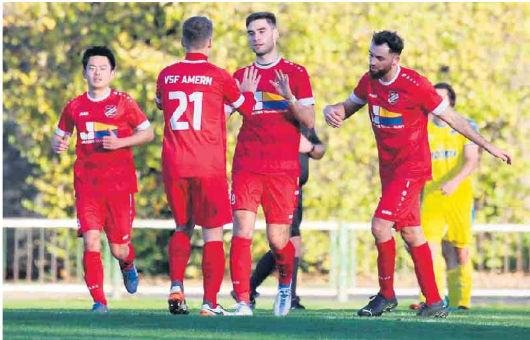
Die VSF Amern gewinnen gegen den 1. FC Mönchengladbach mit 3:0.

Nach dem Seitenwechsel war es dann Luca Dorsch (57.) der nach einem Pass über das Zentrum durch Kuznik den Ball mit links in die obere kurze Ecke zum