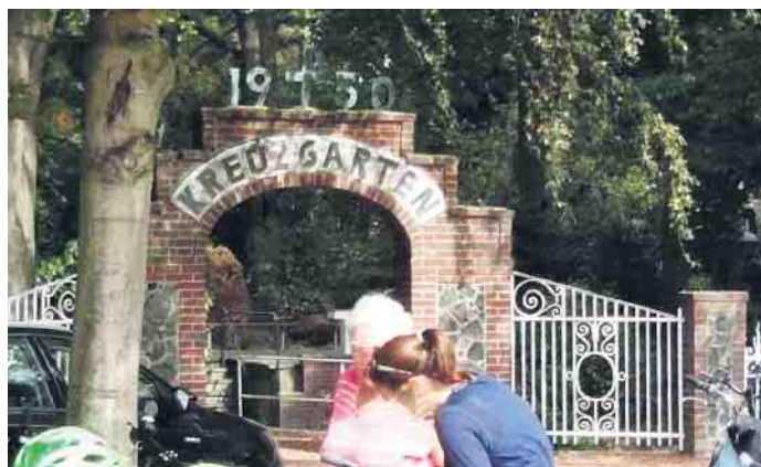
Im Kreuzgarten Schaag wird am Himmelfahrtstag ein Taufgottesdienst angeboten.

Grenzland (fjc). Einen besonderen Gottesdienst bietet die evangelische Gemeinde Waldniel am Christi Himmelfahrtstag, 18. Mai, an. Zusammen mit den evangelischen Gemeinden aus Brüggeln und Hardt feiert man um 10.30 Uhr im Kreuzgarten Schaag einen Open-Air-Gottesdienst, bei dem die Möglichkeit der Taufe besteht (Anmeldung bitte bei Pfarrer Horst-Ulrich