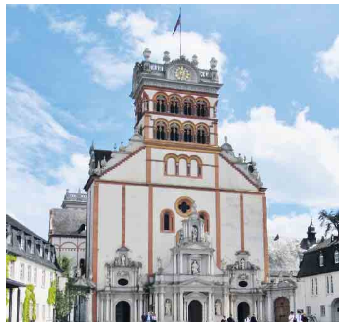
Ziel vieler Pilger vom Niederrhein ist in den Tagen um Christi Himmelfahrt die Matthiasbasilika in Trier.

Schwalmtal (fjc). Die St. Matthiasbruderschaft Waldniel hat ihre diesjährige Wallfahrt nach Trier gut vorbereitet. Am Donnerstag, 18. Mai (Christi Himmelfahrt) feiert man zunächst um 5.30 Uhr eine Pilgermesse im Schwalmtal-dom St. Michael, Waldniel, da-nach geht es los. Jeweils eine Gruppe von Fuß- wie auch von Radpilgern macht sich auf den Weg durch die Eifel zum Apostelgrab in Trier. Am Samstag, 28. Mai, treffen sich beide Gruppen dann gegen 18.15 Uhr wieder am Kreuz Zoppenberg in Waldniel, um von dort gemeinsam zum Schlusssegen nach St. Michael zu ziehen.