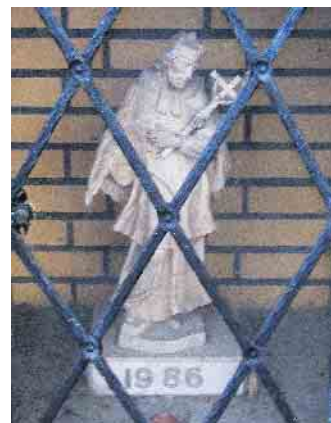
Figur des heiligen Johannes von Nepomuk im Bildstock in Ungerath.

gegründete Bruderschaft weihte 2008 ihre neue Fahne mit dem Bild des Patrons im Petersdom in Rom.