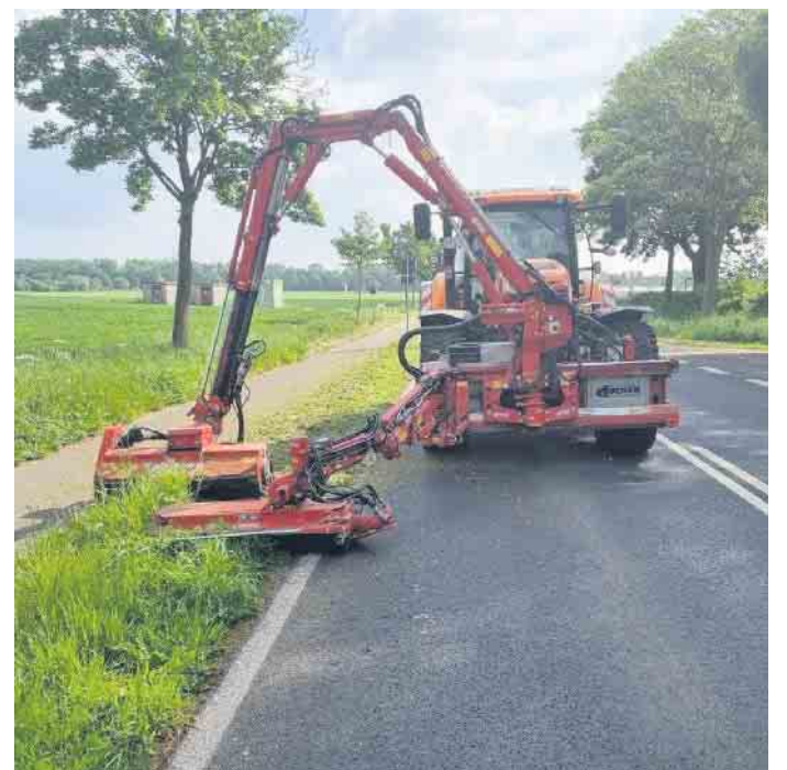
Wenn der Kreis Viersen im Frühjahr mit dem Grasschnitt an den Kreisstraßen beginnt, werden Großgeräteträger eingesetzt. Das kann zu Verkehrsbehinderungen führen.

Kreis Viersen. Ab Montag, 15. Mai, beginnt der Kreis Viersen mit dem Frühjahrsgrasschnitt der Bankette an den Kreisstraßen. Die Mäharbeiten führt der Baubetriebshof im Zweischichtbetrieb werktags in der Zeit von 6 bis 21 Uhr durch. Gemäht werden ausschließlich Intensivflächen, also die Bereiche, die zur Gewährung der Verkehrssicherheit notwendig sind. Hierzu gehören auch Sichtdreiecke an Einmündungen und Verkehrsinseln. Die Außenbereiche (sogenannte Extensivflächen), werden zum Schutz der Insekten, zur Förderung der Artenvielfalt und des Blütenwachstums dabei speziell ausgespart. Zur Vorbereitung wurden die Bankette bereits im April von Müll gesäubert. Hierbei wurden rund sieben Tonnen Müll gesammelt. Die Mäharbeiten dauern