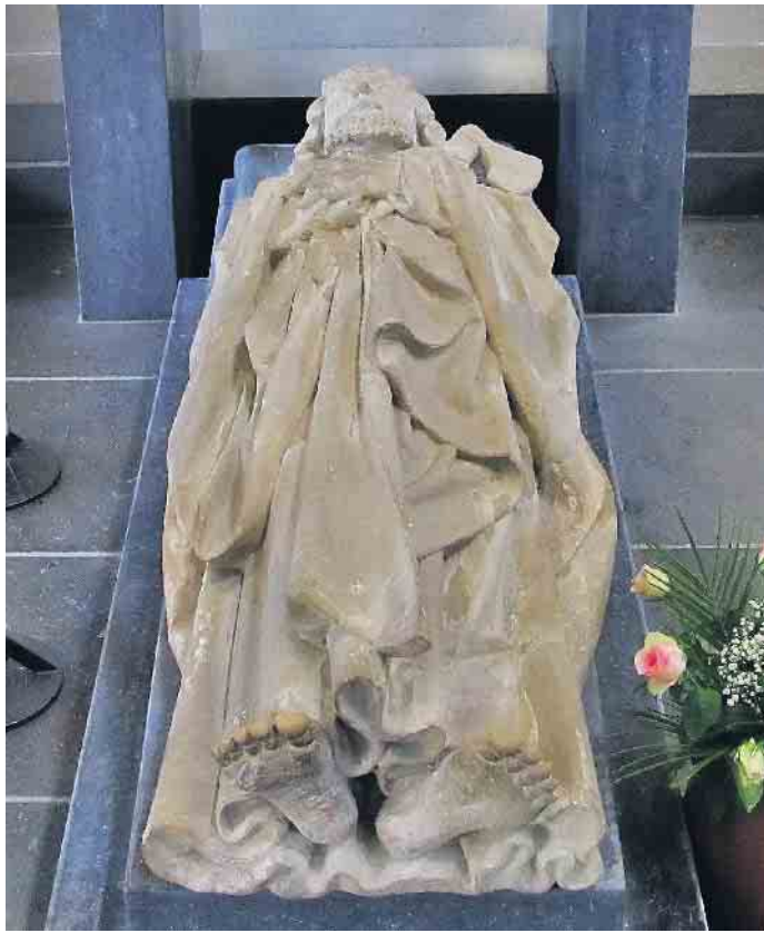
Die St. Matthiasbruderschaften rüsten wieder zur Wallfahrt zum Apostelgrab nach Trier.

Donnerstag, 18. Mai (Christi Himmelfahrt), feiert man zunächst zum Abschied aus der Heimat um 5.30 Uhr eine Pilgermesse im Schwalmtal St. Michael, Waldniel. Danach begeben sich sowohl die Fuß- wie die Radpilger auf den Weg durch die Eifel an die Mosel, am Sonntag treffen sie am Apostelgrab in Trier ein. Die Fußpilger unterbrechen ihre Wallfahrt am Montag, 22. Mai, und beginnen wieder am Abend des 26. Mai in Niederzier. Am