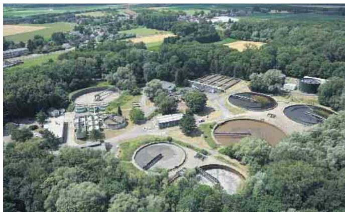
Blick von oben auf die Kläranlage Nette

dieses Jahrhundertprojekt wurden bereits im Januar und Februar dieses Jahres durchgeführt: Die notwendigen Rodungsarbeiten wurden inzwischen beendet. Ende Januar hatte der Niersverband mit den Rodungsarbeiten auf dem Gelände des Klärwerks begonnen, um den für die danach folgenden Umbau- und Neubauarbeiten notwendigen Platz zu schaffen. Natürlich wurden die Arbeiten auf das unbedingt notwendige Maß begrenzt