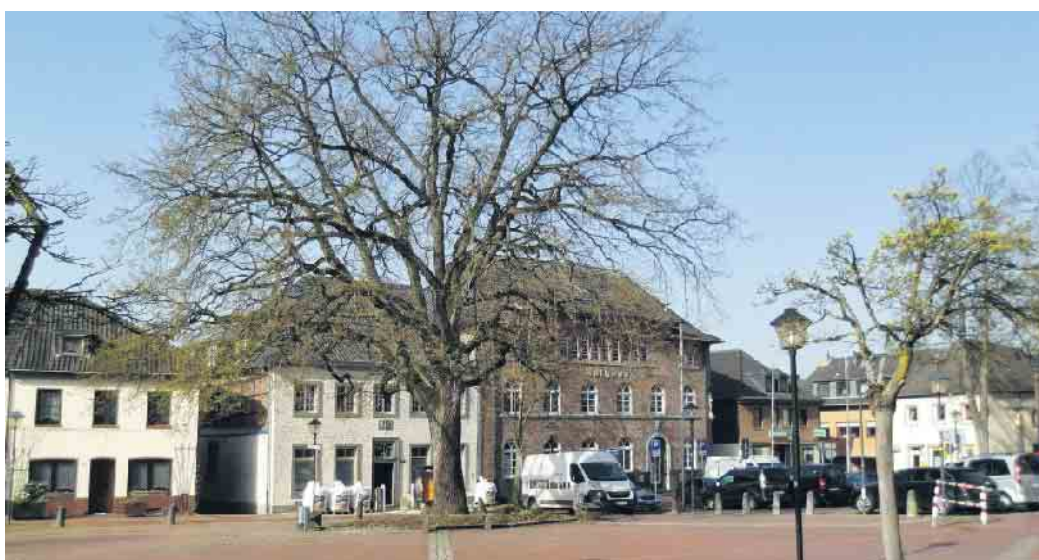
An der Eiche auf dem Waldnieler Markt trifft man sich zur Osterwanderung.

Eine etwa dreistündige Wanderung ohne großen Schwierigkeitsgrad mit Pause ist vorgesehen.