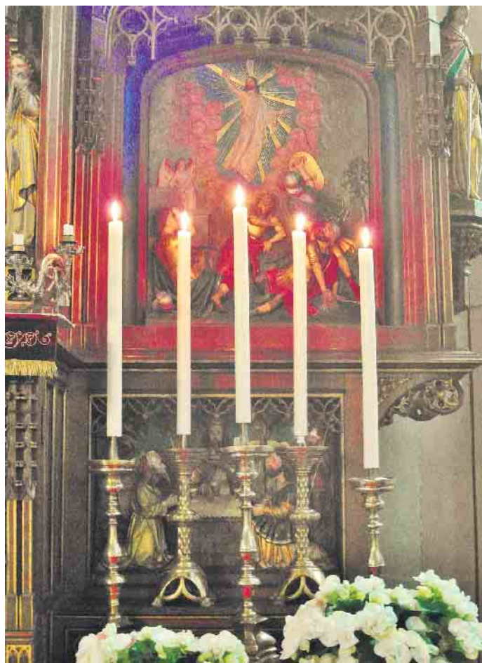
Auferstehung, Tafel aus dem Aufsatz des Hochaltars in St. Gertrud Dilkraht aus der Werkstatt Perey, Kempen (um 1895).

Sonntag, 9. April (Ostersonntag), 9.30 Uhr Festmesse (Hochamt) in St. Georg Amern, 10.30 Uhr hl. Messe in St. Mariä Himmelfahrt, Waldnieler Heide, 11 Uhr Familienmesse in St. Michael