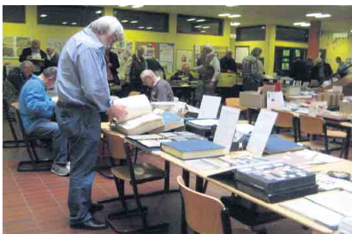
Zum 74. Niederrhein-Großtauschtag in Kaldenkirchen laden die Briefmarkenfreunde Nettetal ein.

Nettetal (hk). Der Verein der „Briefmarkenfreunde Nettetal e.V.“, lädt alle Mitglieder, Sammler und Gäste zum „74. Niederrhein-Großtauschtag für Briefmarken, Münzen, Ansichtskarten und Heimatbelegen“ am 16. April in die Gaststätte „Zur Mühle“ nach Nettetal-Kaldenkirchen ein. Da die Aula der „Gesamtschule Nettetal“ in Breyell in diesem Frühjahr nicht zur Verfügung steht, musste der Veran-