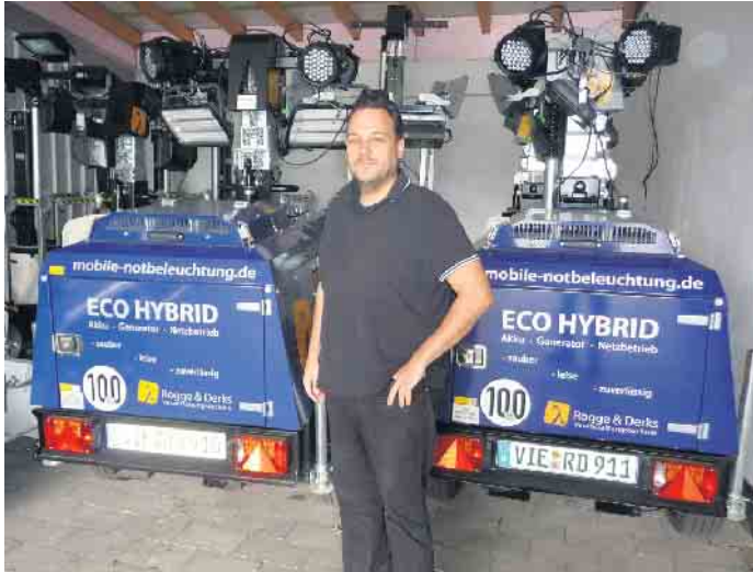
Viele Handwerker suchen händeringend Nachwuchs

Auch dies sagen die heimischen Handwerker: Eine Exzellenzinitiative für die berufliche Bildung müsse so konzipiert werden, dass sie vor allem die Versorgung der Wirtschaft mit Führungs-, Unternehmens- und Spezialistennachwuchs sichert. Immer wieder betont die Handwerkerschaft in ihrem Forderungskatalog, dass die Gleichwertigkeit beruflicher und akademischer Bildung festgeschrieben werden müsse. „Transparenz als Instrument der Exzellenz“ nennt das die Handwerkerschaft und betont: Die berufliche Bildung muss insbesondere in der gymnasialen Oberstufe die