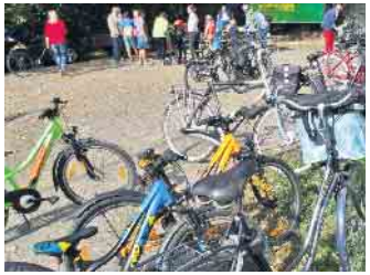
Stadtradeln ist wieder angesagt.

Der 21-tägige Aktionszeitraum startet am Donnerstag, 1. Juni, und endet am letzten Schultag vor den Sommerferien, Mittwoch, 21. Juni. Ziel der Kampagne ist, in dem dreiwöchigen Aktionszeitraum möglichst viele Kilometer mit dem Fahrrad zurückzulegen. Dabei kommt es nicht darauf an, ob die Kilometer auf dem Weg zur Arbeit und Schule oder in der Freizeit gesammelt werden. Alle setzen damit ein Zeichen für den Radverkehr und den Klimaschutz. Jeder im Aktionszeitraum zurückgelegte Kilometer wird im persönlichen Online-Radelkalender eingetragen oder per STADTRADELN-App automatisch aufgezeichnet.