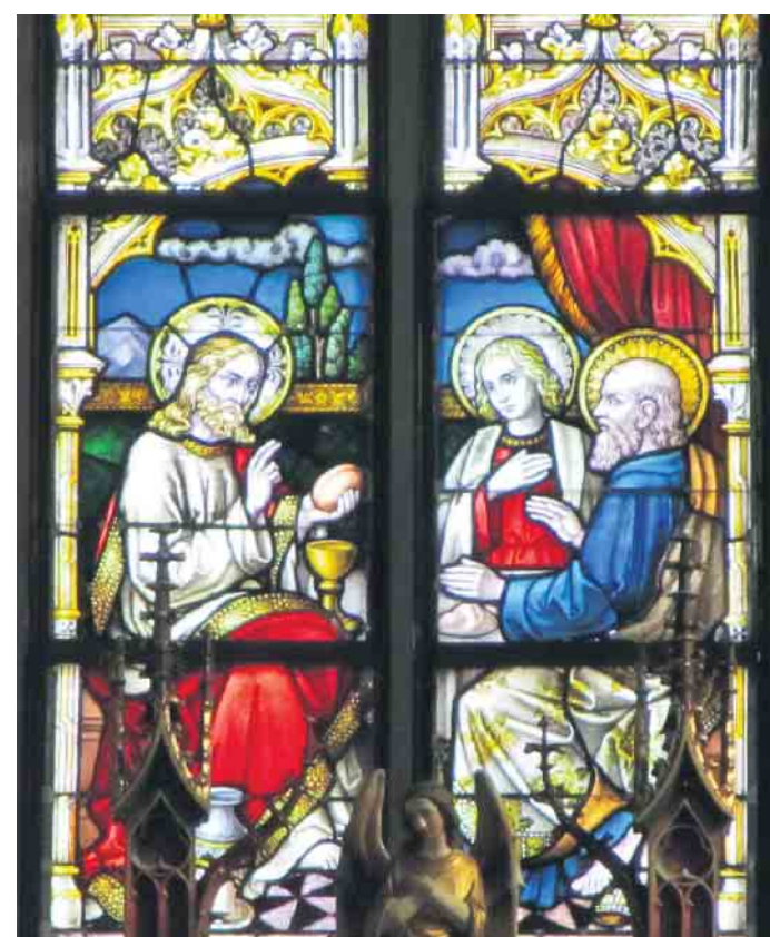
Jesus mit zwei Jüngern beim Mahl in Emmaus. Mittleres Chorfenster in St. Anton Amern.

An die Begebenheit in Emmaus erinnern in den Schwalmtaler Kirchen mehrere Darstellungen. Einmal ist es eine Holzschnitzerei im Zelebrationsaltar der Kirche St. Gertrud in Dilkraht, die noch aus der früheren Kommunionbank stammt. Weiter finden wir Jesus und die Emmausjünger im mittleren Chorfenster der Kirche St. Anton in Unteramern