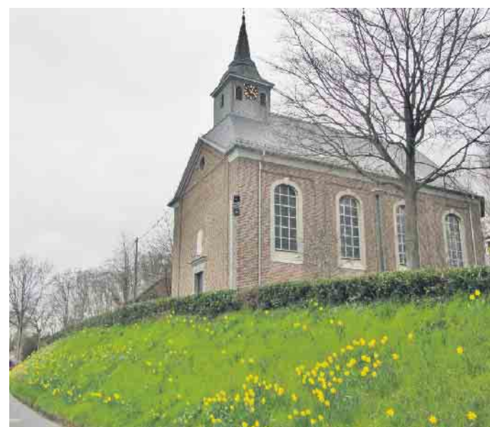
Auch in Lüttelforst erblühen derzeit tausende von Osterglocken, wie hier am Kirchberg.

Grenzland (fjc). Tausende von Narzissen, auch Osterglocken genannt, erblühen in diesen Wochen entlang der Straßen auch im Westkreis. Teils wurden sie von den Kom-