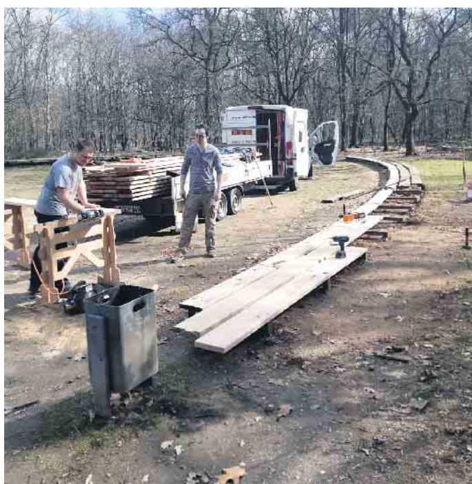
An allen vier Positionen, hier die Gerichtsstelle, montierte die Firma Küppers neue Bretter an Bänken und Stegen.

Gerichtsstätten“ voran geht, war der moderate Grünschnitt der Firma Tüffers an allen vier Positionen im Herbst letzten Jahres. Dieser geschah, da die Flächen im Naturschutzgebiet liegen, in enger Absprache mit den Umweltbehörden und der Biologischen Station Krickenbecker Seen. Die Sanierung der in die Jahre gekommenen Bänke an den Gerichtsstätten Geer, Galgenberg, Geestekull und Schöffenschlucht ist ein Projekt des Verkehrs- und Verschönerungsvereins Hinsbeck mit tatkräftiger organisatorischer und finanzieller Hilfe der Stadt Nettetal und mit Unterstützung der LEADER-Region „Leistende Landschaft“ www.leader-leila.de/projects/sanierung-der-mittelalterlichen-gerichtsstaetten-geer . Gefördert wird das Projekt