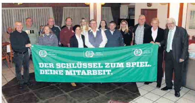
Alle Geehrten auf einem Bild.