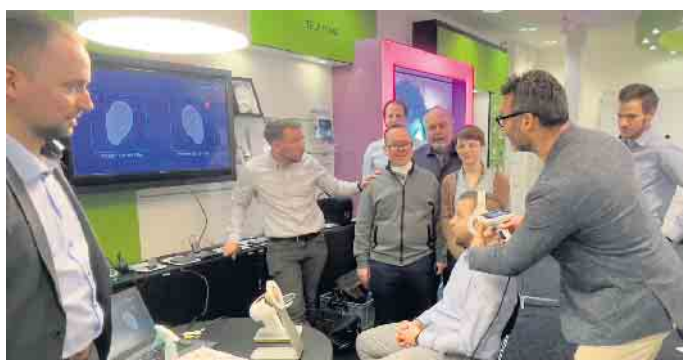
Fortbildung der BECKER-Hörcoaches zur digitalen Ohr-Scan-Technologie Otoscan®

Neu und einzigartig im Großraum Bonn: Ab sofort bietet BECKER Hörakustik auch analog zur Hörsystem-Anpassung bei Cochlea Implantat (CI)-Sprachprozessoren einen CI-Implantat- und Technik-Check sowie CI-Anpassung aus der Ferne / via Remote sowie die neue digitale Ohr-Scan-Technologie Otoscan® an. Diese löst die bisherige Ohrabformung mit dem Material Silikon ab. Das ist nicht nur umweltschonend und zeitsparend, sondern mit den vom äußeren Gehörgang