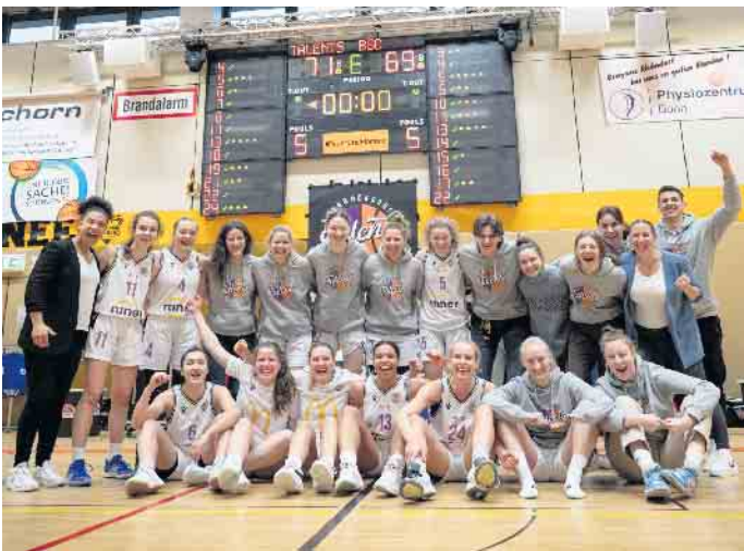
Dritter Saisonsieg für die Talents BonnRhöndorf in der 2. Basketball-Bundesliga.

favorisierten Niedersächsinnen enorm wichtig für Bea Waffenschmieds Mannschaft. Nach gewonnenem ersten Viertel (15:9) war der Matchplan gegen den BBC aufgegangen. Karoline Steffen und Sina Flottmann hatten die nötigen Distanztreffer gelandet, die man gegen Osnabrücks starke Zonenverteidigung braucht - der 31:23-Zwischenstand hätte eigentlich für eine Pausenführung sorgen müssen. Was bei den Osnabrückerinnen jedoch prima klappte, waren Ballantizipation und Fast Breaks. 26 Ballverluste, die meisten davon haarsträubend, leisteten sich die Talents im ganzen Match. Immer wieder fing der BBC die Pässe der Talents-Guards ab. Osnabrück gelang ein 9:0-Lauf zur 32:31-Halbzeit-führung.