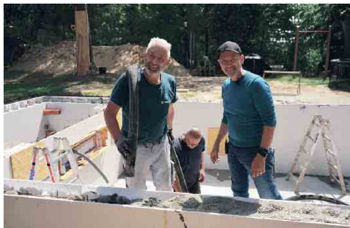
Gute Laune beim Poolbau.

Gibt es einen Beruf, in dem man Träume erfüllen kann? In dem individuelle Beratung genauso gefragt ist wie handwerkliches Können und ein Gespür für Ästhetik und Design? In dem man Werte schafft, die für andere den „Himmel auf Erden“ bedeuten? Schwimmbadbauer ist so ein Beruf - vor allem, wenn es um den Bau privater Pools geht.