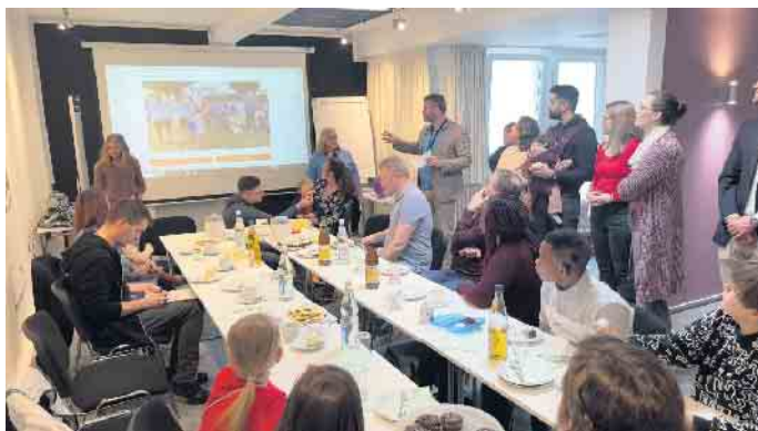
Ein kurzweiliger wie informativer Nachmittag beim Bonner CI-Treff für KIDS

Am 15. Juni, ab 14 Uhr findet das Sommer- und Grillfest statt - ein Highlight im Veranstaltungsjahr. Die regelmäßig stattfindenden Veranstaltungen des Bonner CI-Treffs werden von den Mitgliedern und deren Angehörigen sowie von