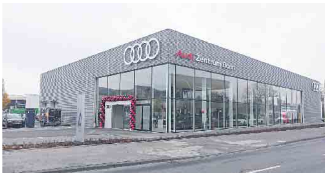
Straßenansicht des neuen AUDI Zentrums an der Bornheimer Str. 222 in Bonn

Das Traditionsunternehmen Fleischhauer-Franz hat am 17. November sein neues, dreigeschossiges AUDI Zentrum am Standort Bonn in der Bornheimer Str. 222 eröffnet.