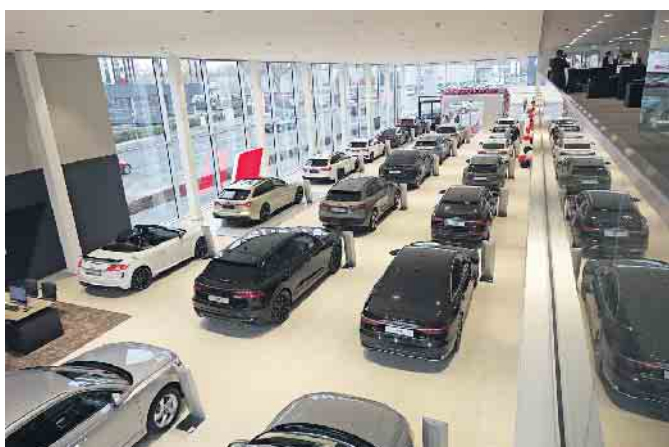
Die großzügige Ausstellungsfläche im Bonner AUDI Zentrum rückt die neuen AUDI Modelle ins rechte Licht.