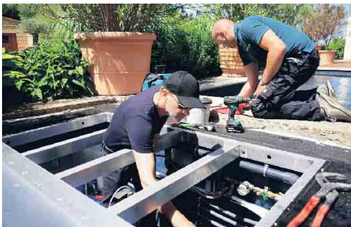
Arbeiten am Technischacht.