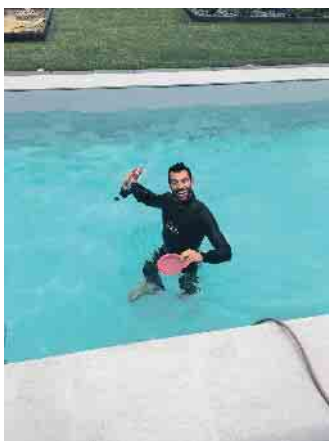
Wasserspaß bei der Arbeit.

Jobangebote aus der Schwimmbadbranche findet man auf der Website des Bundesverbandes Schwimmbad & Wellness e.V. (bsw) unter www.bsw-web.de . (akz-o)