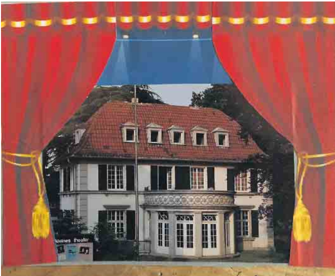
Theater, Theater, der Vorhang geht auf