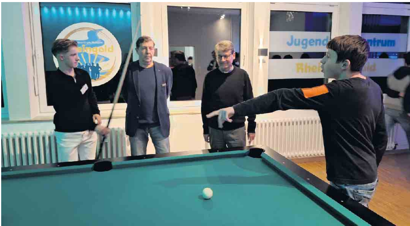
Die erste Partie am neuen Billardtisch.

Das Jugendzentrum Rheingold feiert Einweihung am neuen Standort