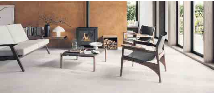
Die Verbindung verschiedener Wohn- und Lebensbereiche durch Fliesen erweitert den Grundriss optisch und lässt ihn großzügiger wirken.

wohnliche Oberflächendekore wie Natursteininterpretationen oder authentische Holzanmutungen im Trend. Mutige können offenen Räumen auch mit kräftigen Farben und Kontrasten Charakter und Persönlichkeit verleihen - zum Beispiel mit historischen Dekoren in Look von Zementfliesen. (DJD)